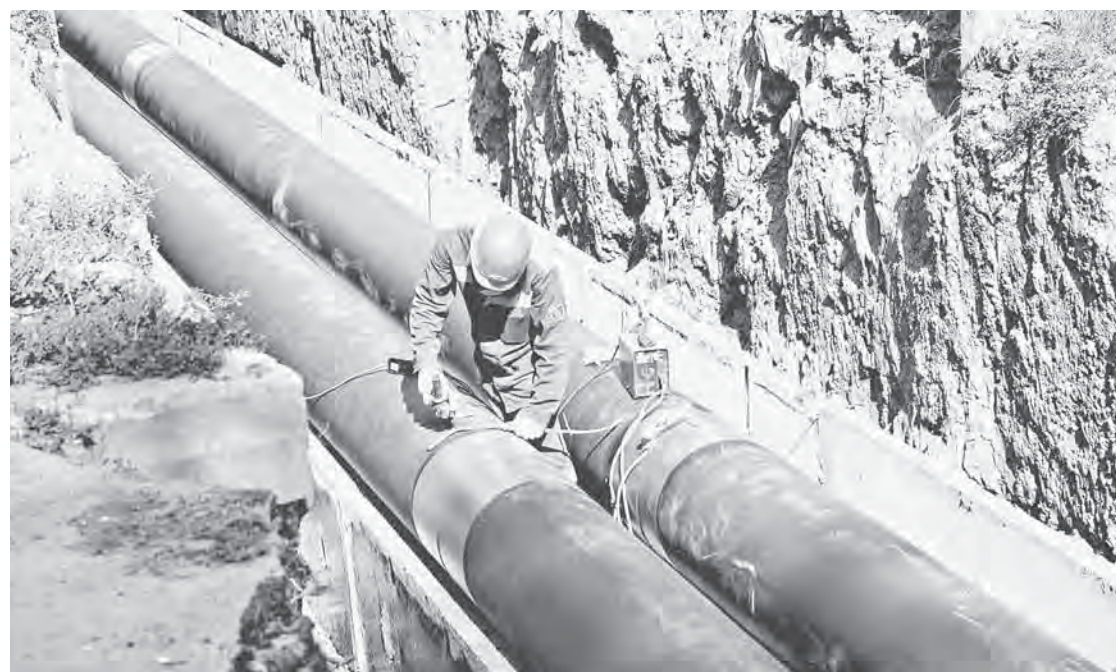
Работы по подготовке к следующему отопительному сезону будут проводиться по октябрь включительно.