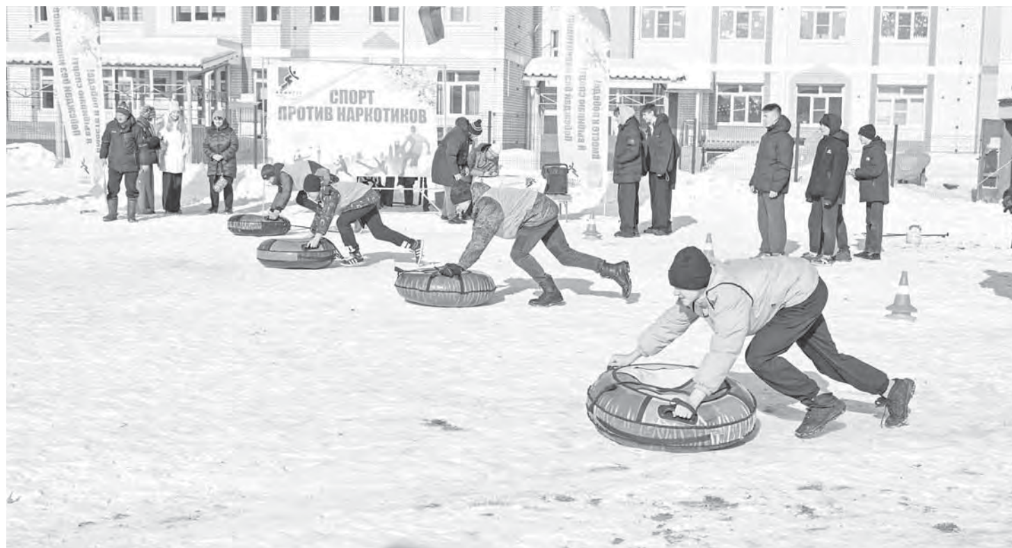
Спортивные соревнования оставили у подростков массу положительных эмоций.

Вовлечение подростков в спортивные мероприятия, на мой взгляд, самая эффективная форма работы. Благодаря ей они сплавляются, вовлекаются в интересные события и постепенно возвращаются на истинный путь. Подобные