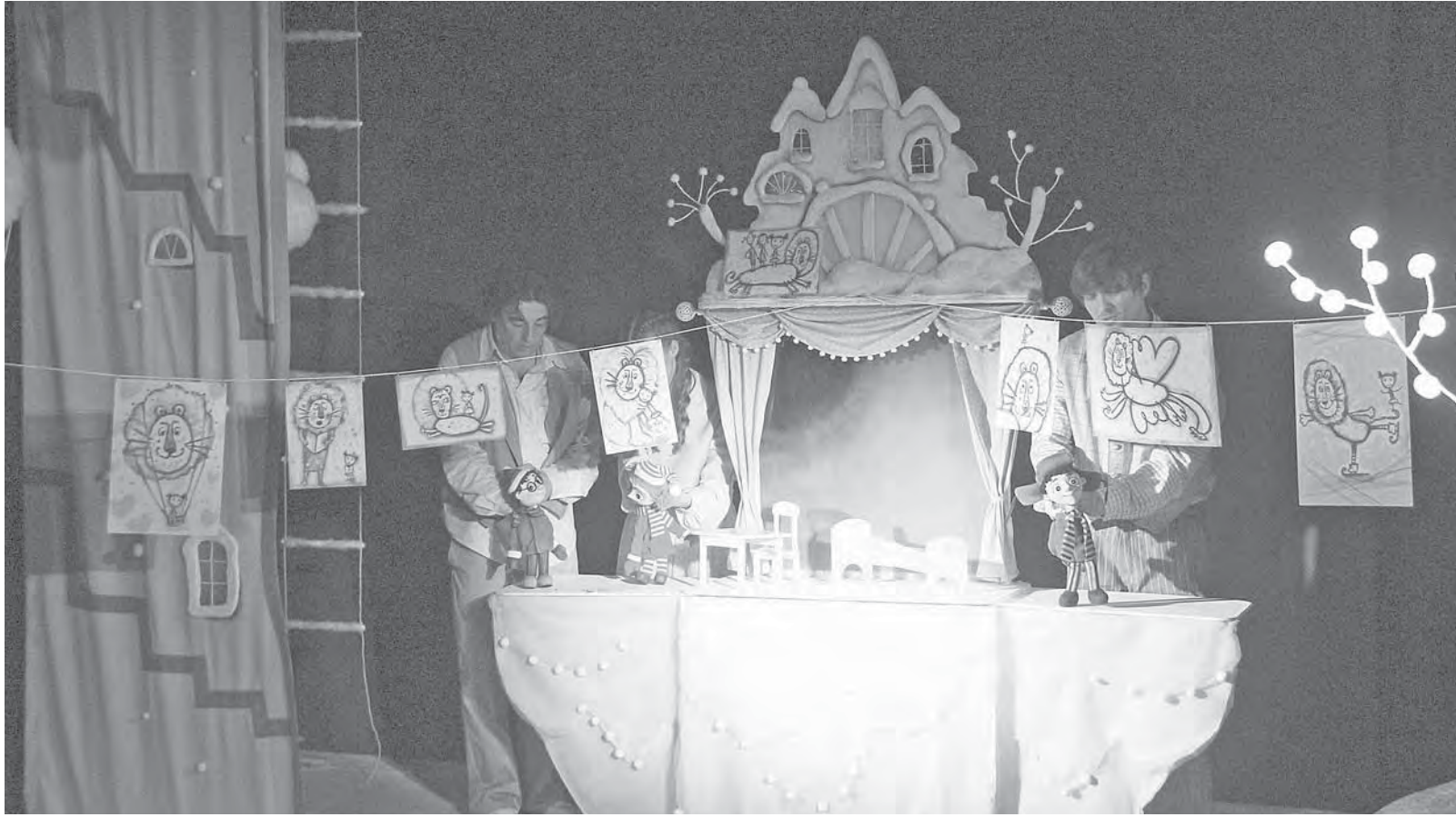
В формате «театра на подушках» бэби-мюзикл «Сказки» воспринимается особенно трепетно.