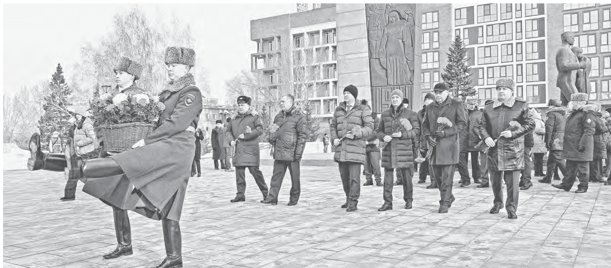
Первые лица города и края почтили память соотечественников, отдавших жизнь за Родину.