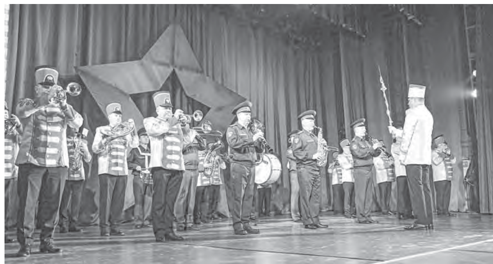
В зрительном зале присутствовали юнармейцы, ветераны, участники СВО, а также их родные.