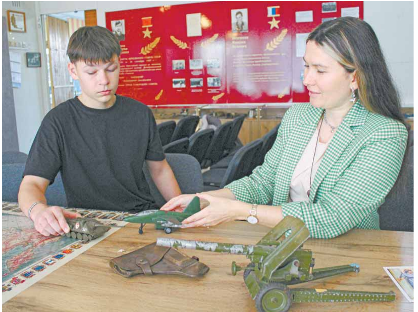
Активисты гимназии № 5 участвуют в формировании музейных экспозиций.

Сейчас для него выделена отдельная витрина с надежным остеклением. Здесь же хранятся архивные фотографии времен блокады. Это стало возможным благодаря решению гимназистов преобразить школьный музей по проекту «Я считаю».