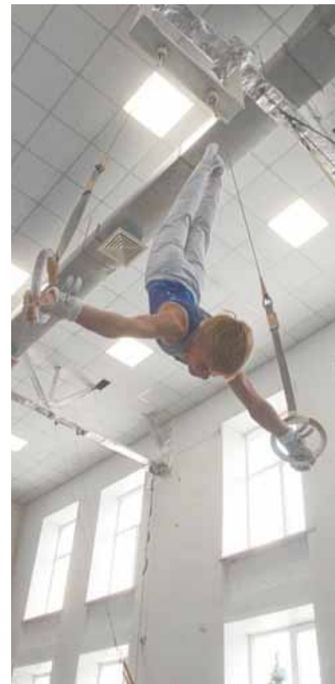
Соревнования собрали лучших гимнастов со всей Сибири.