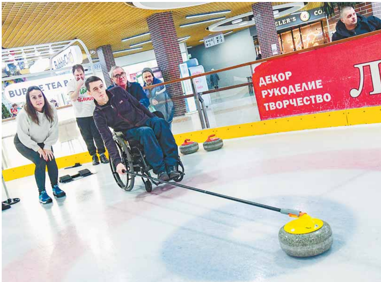
Алтайская федерация керлинга уже готовит молодую команду Барнаула к участию в российских чемпионатах.