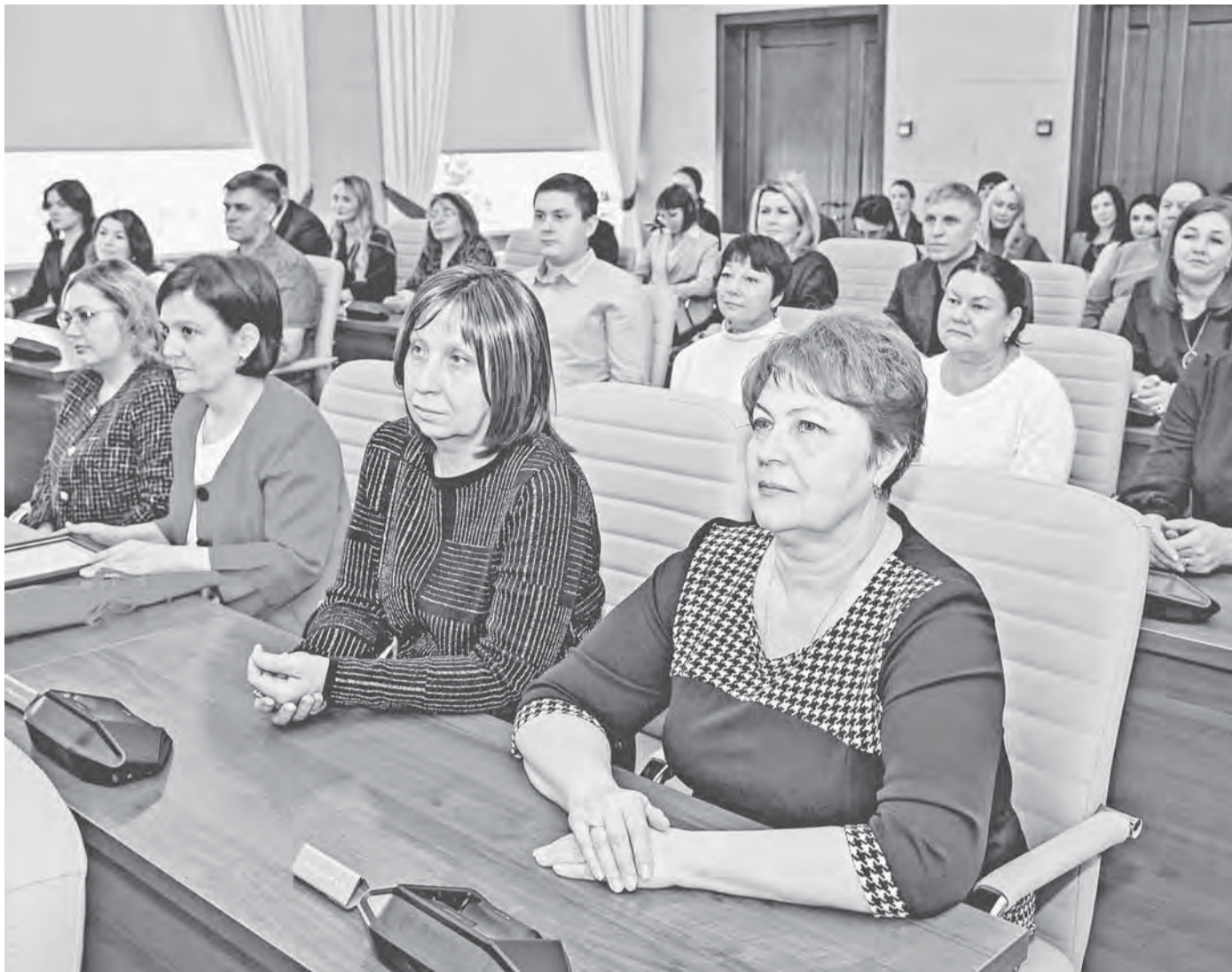
Представители разных отраслей удостоились наград за работу на благо города.