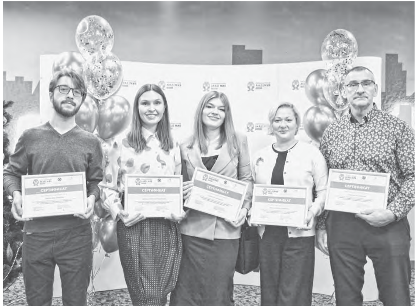
Ежегодно выпускники программы показывают успешные результаты обучения, повышая эффективность своих бизнесов.

Чему научились выпускники Губернаторской программы подготовки профессиональных кадров для бизнеса