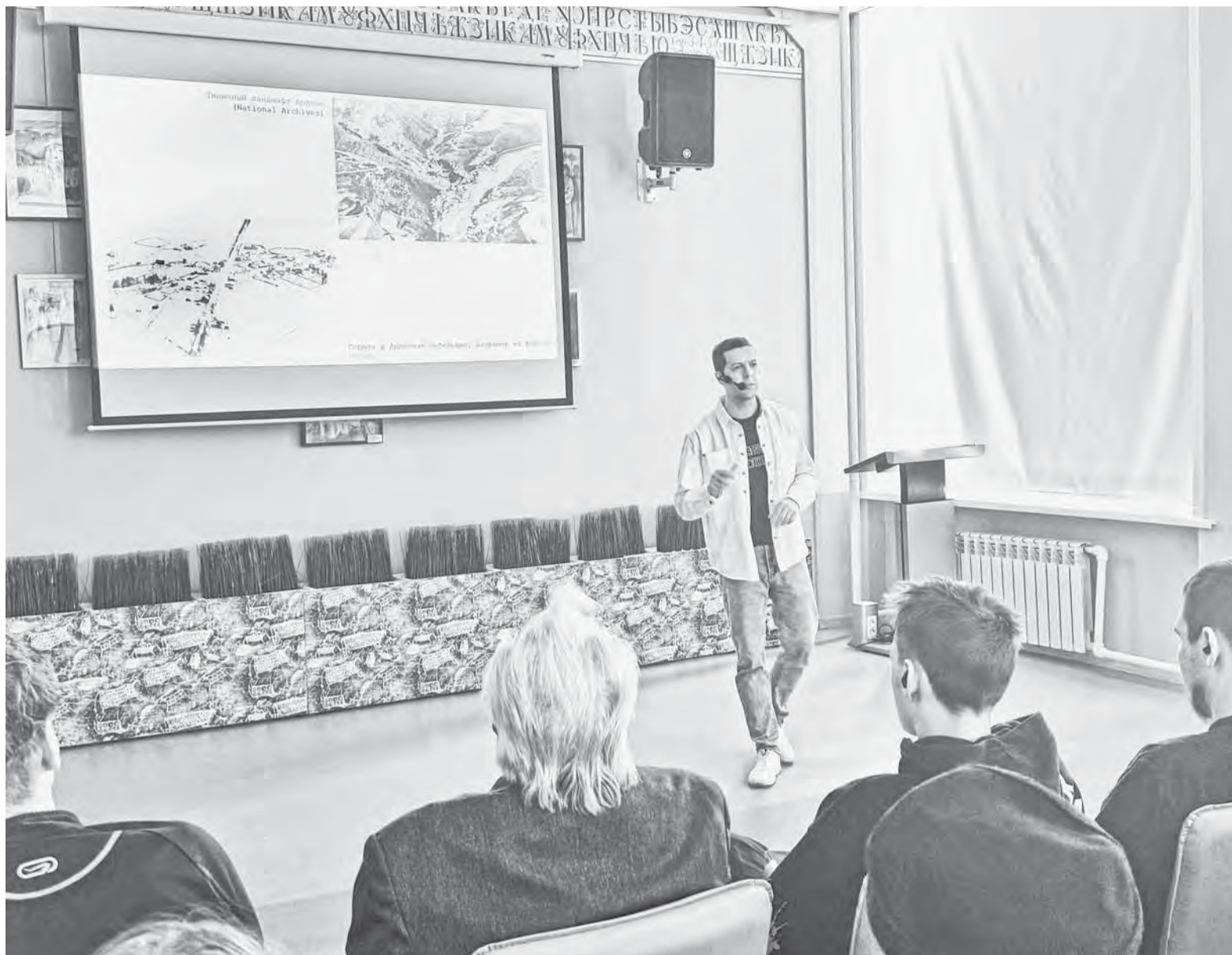
Жители краевой столицы с интересом погрузились в военную историю.