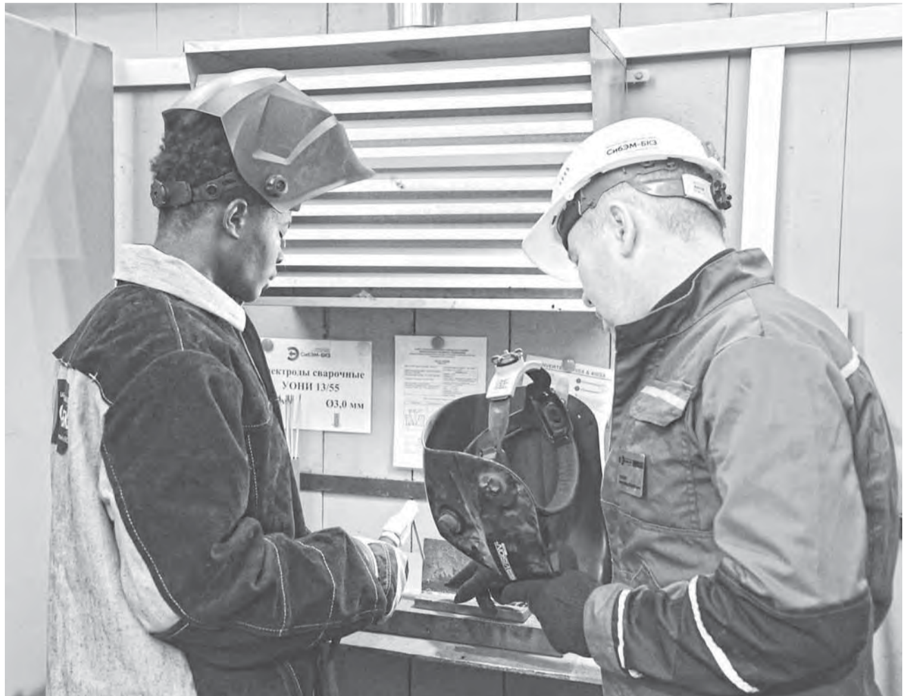
Студенты пробуют пользоваться оборудованием завода под руководством начальника лаборатории сварки.

Предприятия Алтайского края участвуют в подготовке кадров для себя