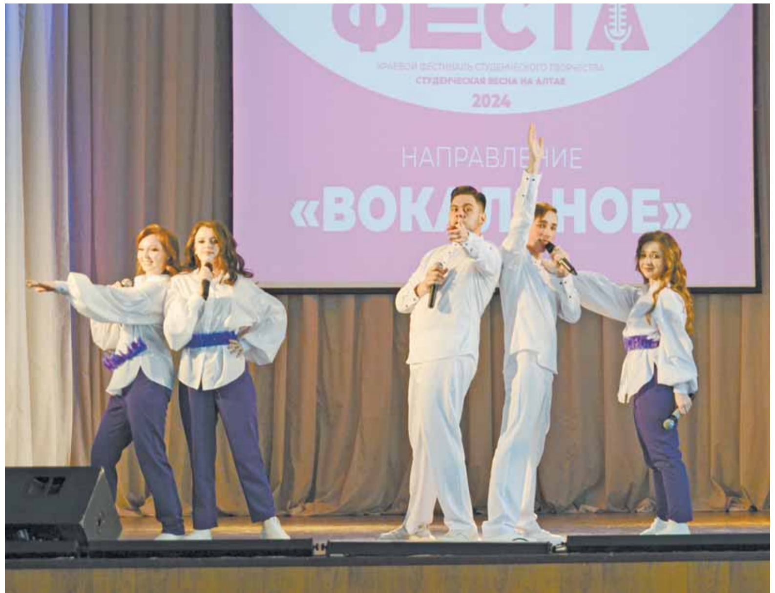
Участники фестиваля выступают сольно, дуэтами, в ансамблях и даже готовят целые концертные программы.