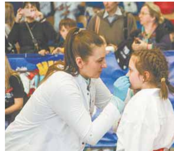
Для Барнаула проведение чемпионата и первенства Сибири стало традицией.