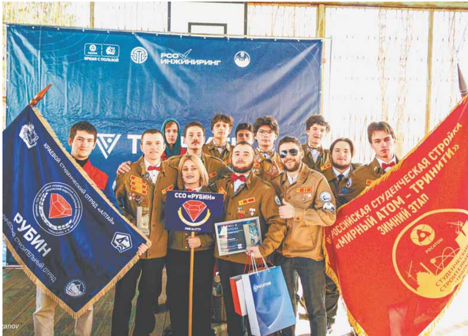
Для зимнего трудового проекта строительный отряд «Рубин» сделали сводным: под его знаменем собрались ребята из разных студенческих коллективов.

В 2024 году студенческие отряды Алтайского края отмечают двойной юбилей — 60 лет с момента зарождения студенческих отрядов региона и 55 лет акции «Снежный десант». Студенческие отряды страны отмечают 65-летний юбилей с момента создания движения и 20-летие с начала современной истории студотрядов. В честь этих событий по всей стране запланировано проведение более сотни мероприятий, которые объединят свыше 1 миллиона человек.