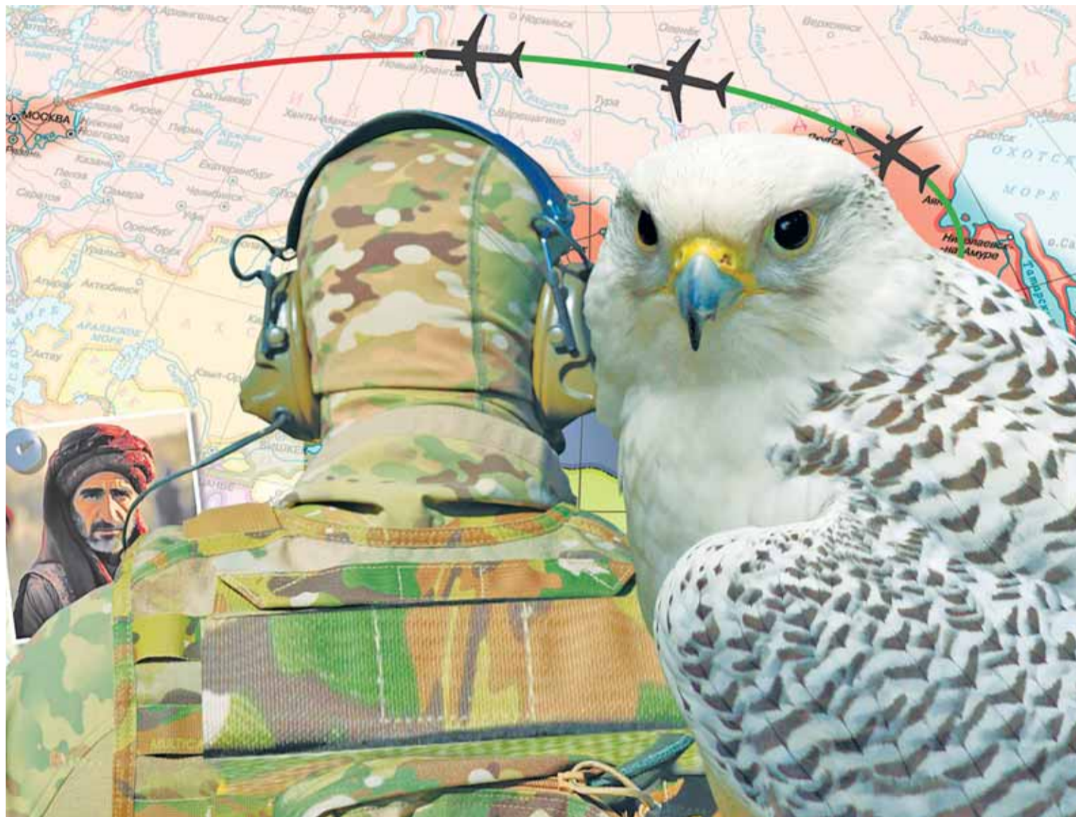
Коллаж Александра ЕРМОЛОВИЧА

– Носов, чтобы смягчить себе наказание, согласился участвовать в дальнейших оперативно-разыскных мероприятиях, – рассказывает