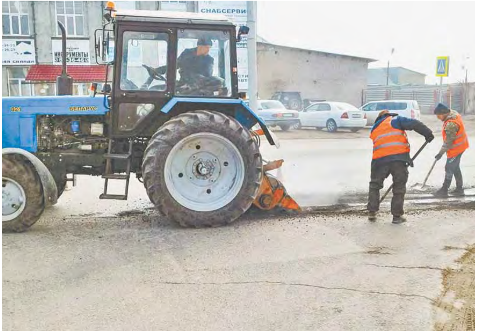
Дорожники приступят к ремонту проезжей части с применением горячего асфальта, когда позволят погодные условия.

Напомним, что с 26 по 29 марта в Барнауле работала межведомственная комиссия по обследованию дорожно-уличной сети. После заседания комиссии будет сформирован итоговый план текущего ремонта дорог, куда войдут и основные магистрали краевой столицы, и улицы