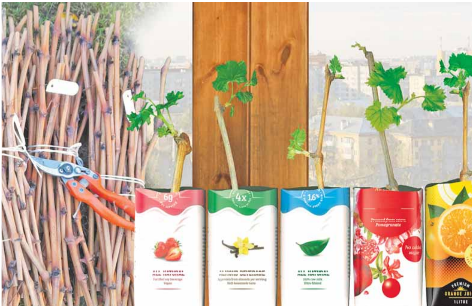
Коллаж Александра ЕРМОЛОВИЧА

Перед отправкой черенка на проращивание очень важно обновить срезы. Острым и чистым секатором, отступив на 0,5-1 см от нижней почки, укоротите черенок. Это поможет простимулировать рост корней.