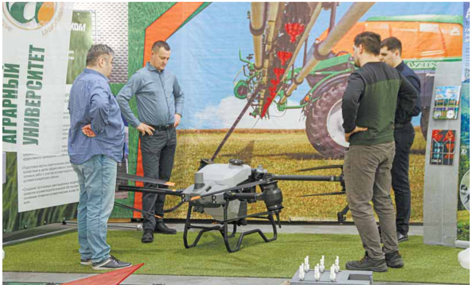
Для обучения используют наиболее популярные на мировом рынке агродроны БПЛА - DJI AGRAS T40 и XAG P100.

Занятия для первого набора «Летной школы» нового формата стартовали в конце марта, пятерке слушателей предстоит учиться две с половиной недели каждый день с утра и до обеда, сейчас идет теория.