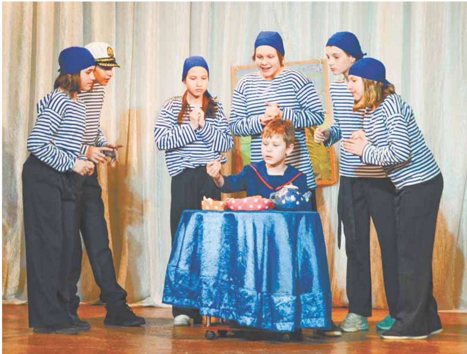
Более 15 спектаклей представили барнаульские коллективы.