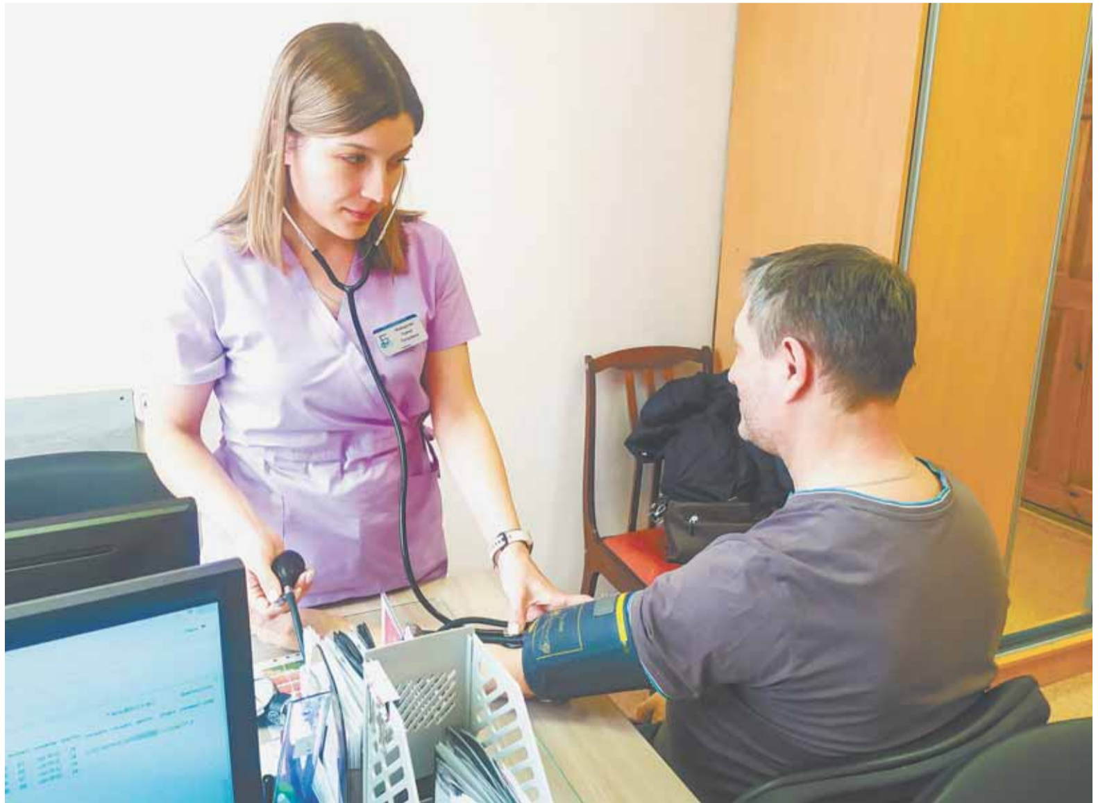
Диспансеризация позволяет прежде всего предупредить онкологию и развитие болезней сердечно-сосудистой системы.

– Наше подразделение занимается проведением профилактических медицинских осмотров и диспансеризацией взрослого населения. Также проводим активную вакцинацию взрослого населения. Эта работа ведется не только на участках, но и в наших кабинетах. Помимо популярной и широко известной противогриппозной вакцины взрослым пациентам важно не пропустить иммунизацию против дифтерии и столбняка. При-