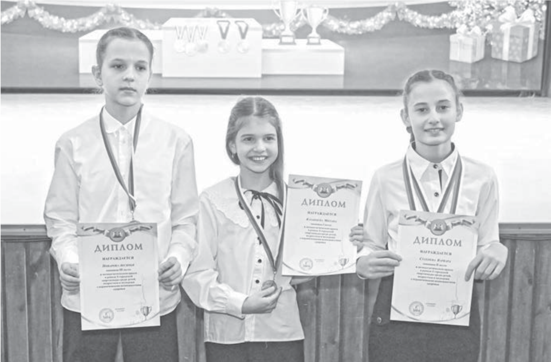
Многие участники завоевали медали в нескольких дисциплинах.