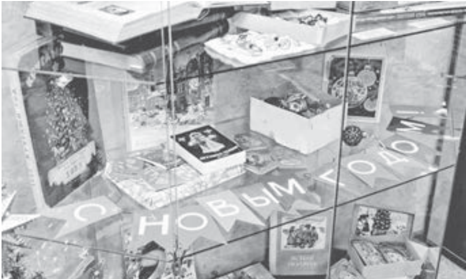
В витринах музея – книги, игрушки, открытки и журналы прошлых эпох.