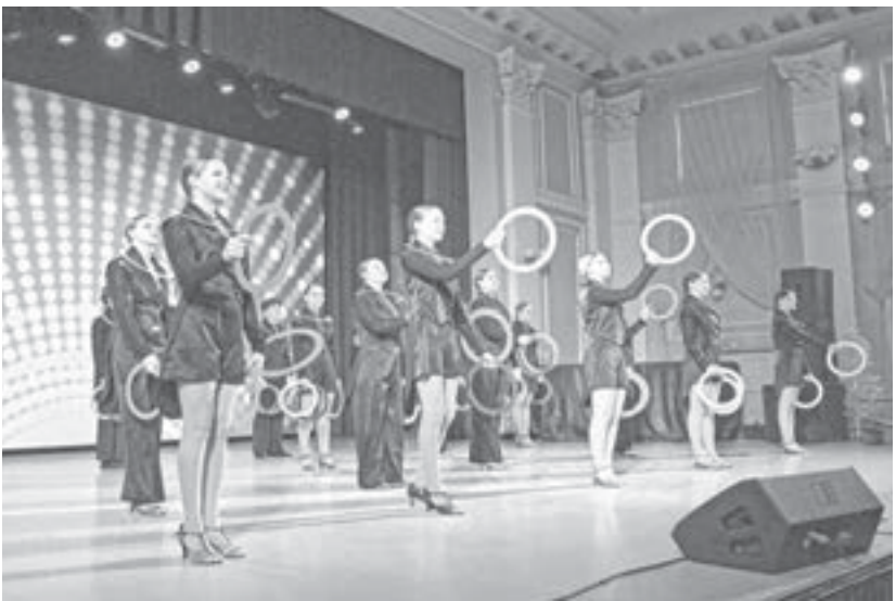
С яркими номерами выступили творческие коллективы.