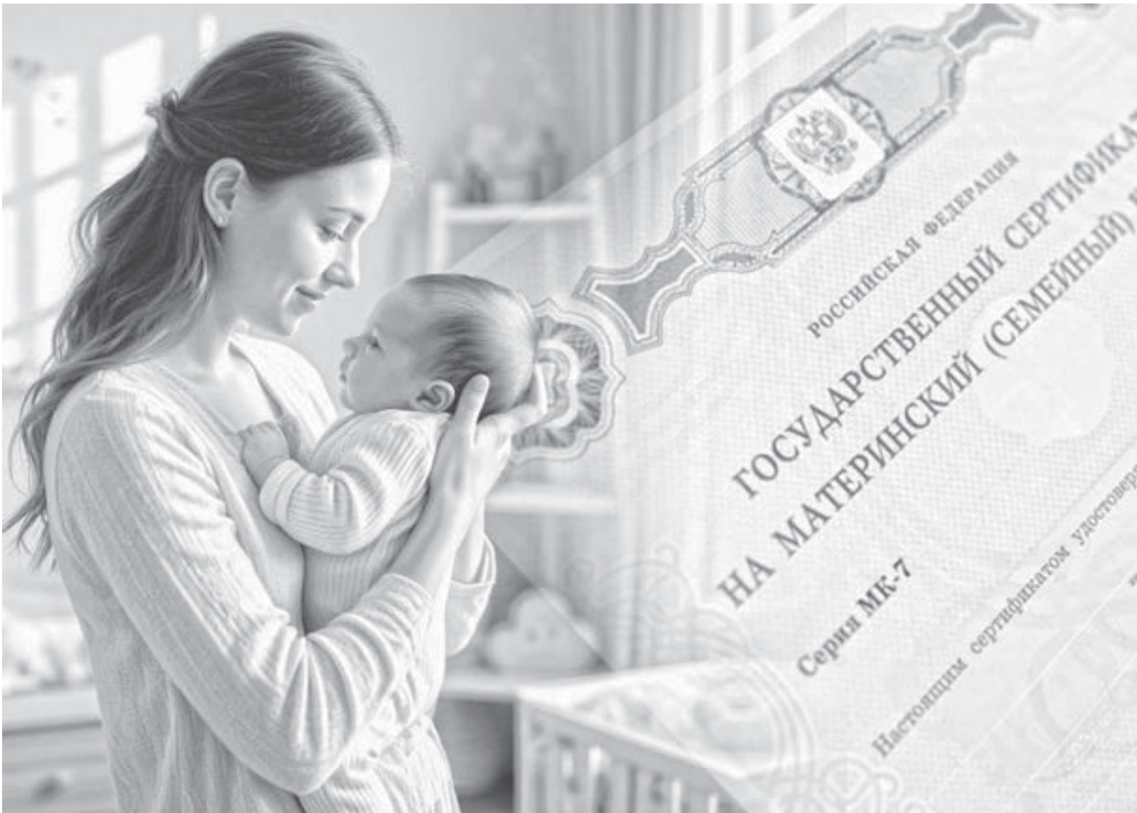
Коллаж Александра ЕРМОЛОВИЧА

С полным списком мер поддержки семьям с детьми можно ознакомиться на сайте СФР в специальном разделе «Семьям с детьми».