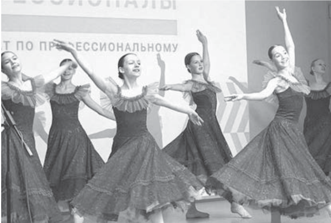
Выступления артистов подарили положительные эмоции гостям мероприятия.

– Моя задача состояла в проведении комплекса ГТО и разработке плана фитнес-марафона для группы «ВКонтакте». Работа проходила в детском саду № 261. Взаимодействовал с волонтерами от школы. Чтобы мотивировать их продолжать сдавать ГТО, я рассказывал о премиях – это дополнительные баллы к поступлению, укрепление физического здо-