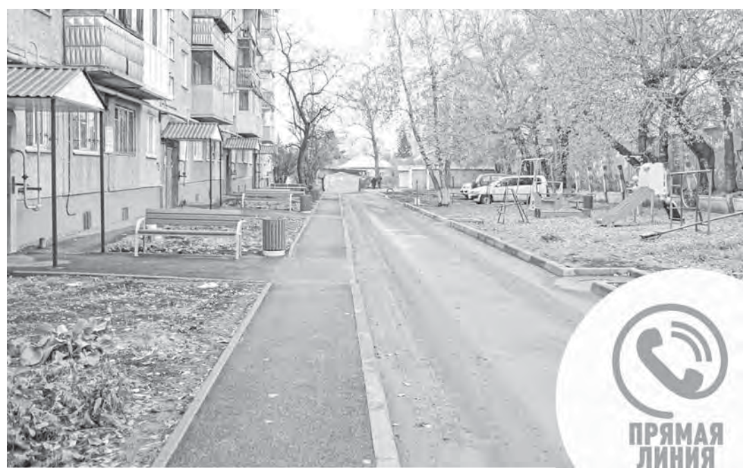
Двор по адресу: улица 80 Гвардейской Дивизии, 42, был благоустроен в 2024 году.

– Верно, полномочия по согласованию размещения информационных конструкций – у районной администрации. По указанному адресу мы проведем проверку, есть ли раз-