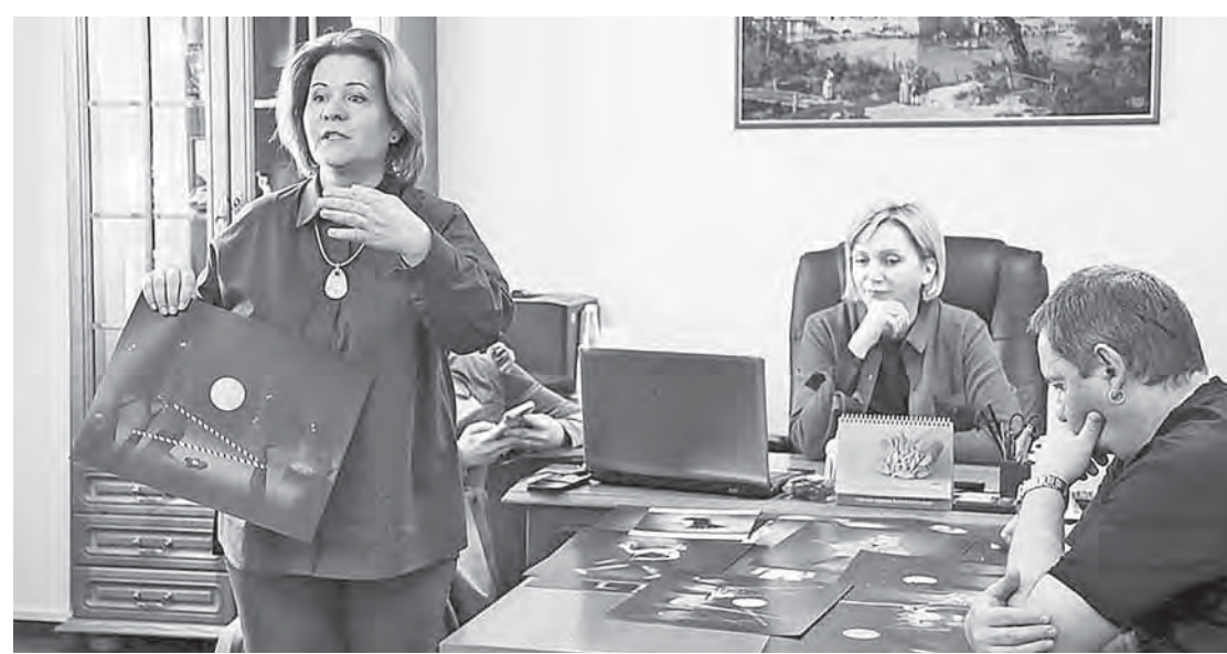
Художественный совет, посвященный новой постановке.

В театре поясняют: герои «Зверского детектива» неоднозначны, сложны, во многом противоречивы. Волк – хоть и