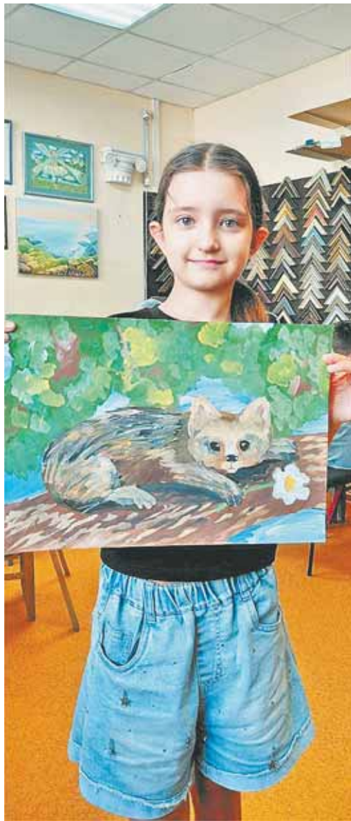
Своим творчеством дети напомнили о необходимости беречь природу.