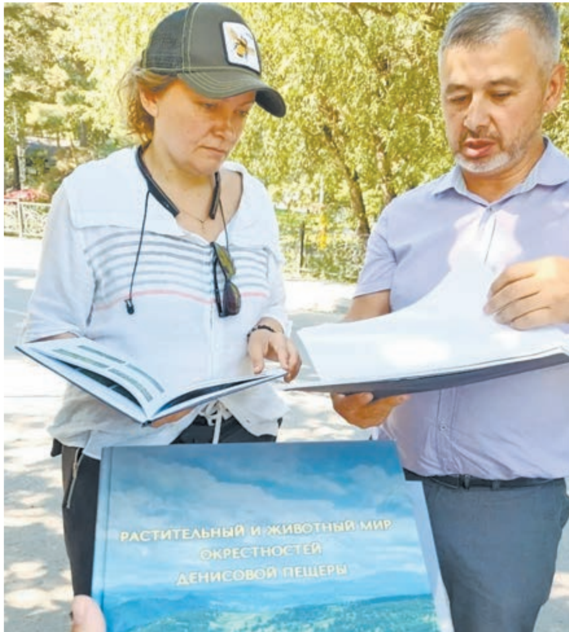
Работе над сценарием предшествовало изучение большого объема информации.

В составе этой экспедиции были представители творческого объединения «Таратумб» (Москва), которых принято называть режиссерами-этнографами. Они много путешествуют по разным регионам страны и, погружаясь в атмосферу