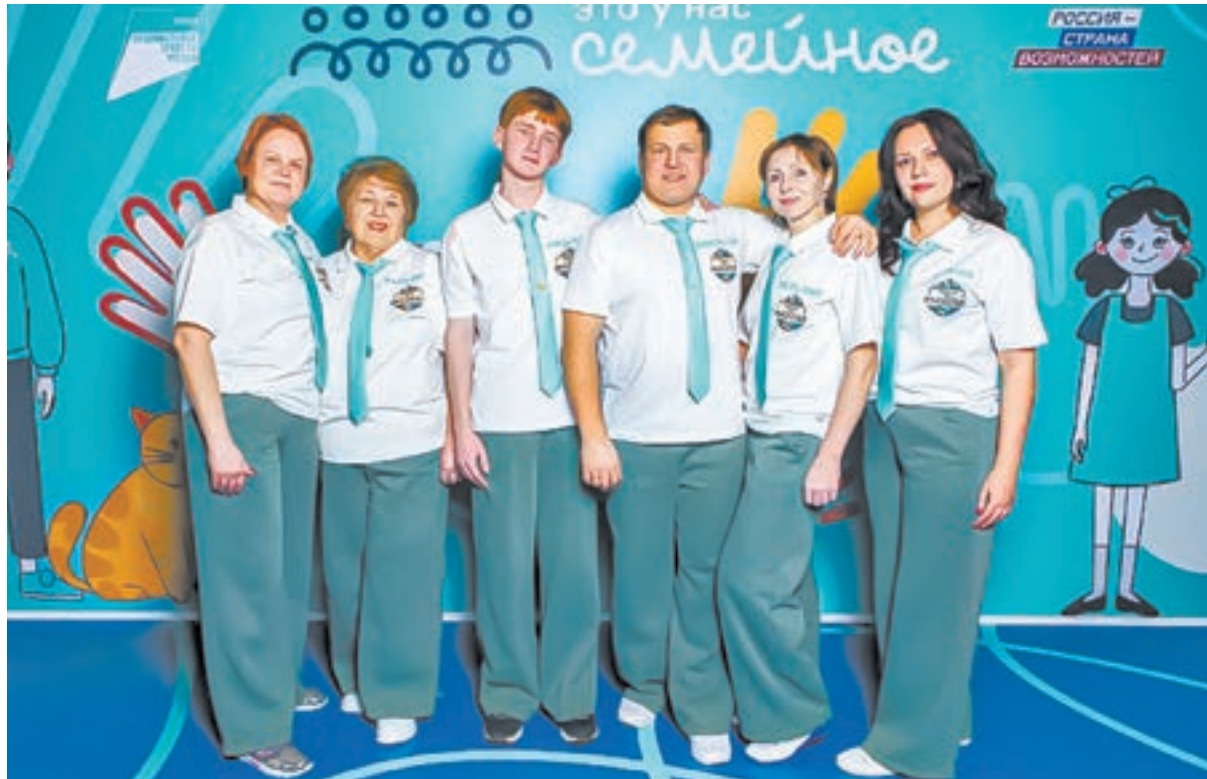
Конкурс объединил несколько поколений семьи.

– В конце июня ездим в Колывань на Белое озеро. Эта традиция связана с тем, что мама, тетя и их брат раньше жили в деревне Колыванстрой, где их отец работал директором училища. Сейчас это место стало точкой сбора для всех потомков. А в последние выходные августа отправляемся в Белокуриху к моим