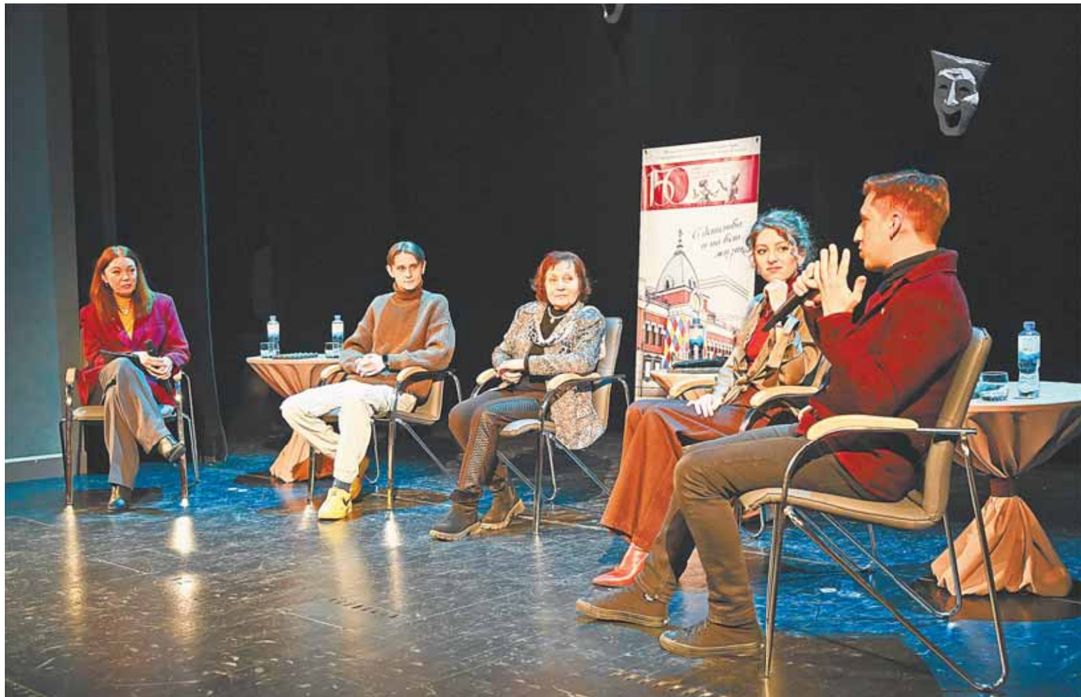
Актеры барнаульских театров рассказали о себе, о своем пути в профессии.

В календаре дат есть еще числа, в которые принято вспоминать работу артистов. Это Международный день актера, который отмечается 26 августа, Международный день кукольника — 21 марта и Всемирный день театра — 27 марта.