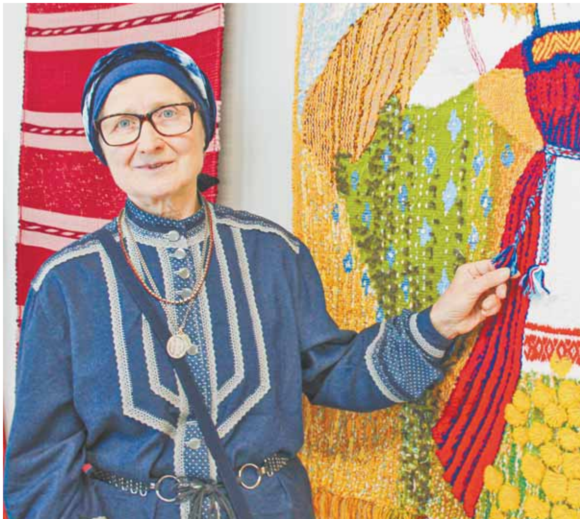
Эксперты безоговорочно считают работы Татьяны Горбуновой произведениями искусства.