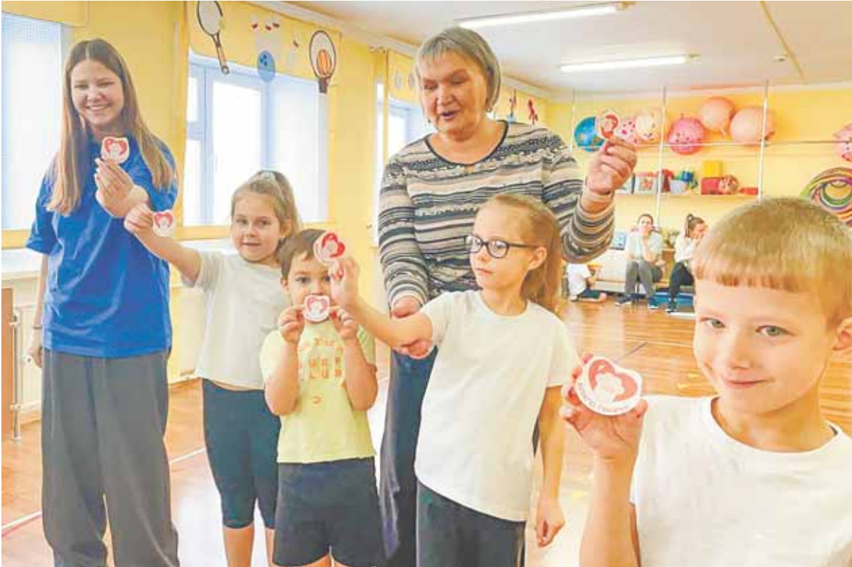
Дошколята с радостью совершают добрые дела.