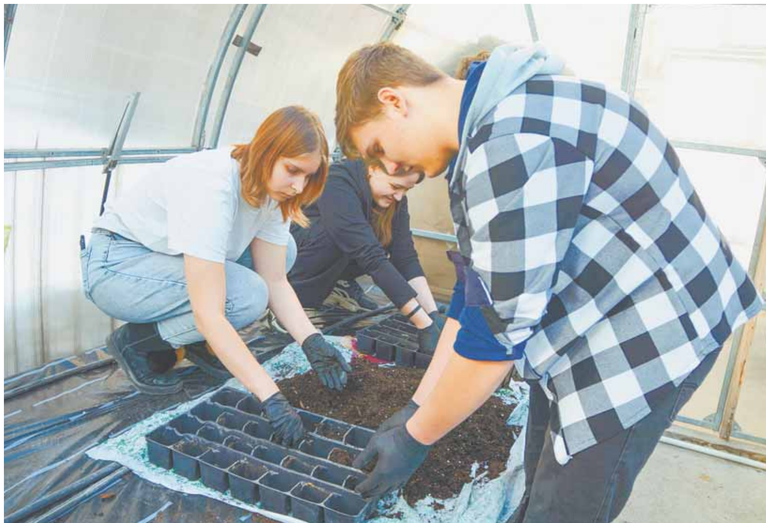
Будущие агрономы АГАУ уже приступили к набивке грунтом рассадных кассет: скоро сев.

Если есть возможность, то в период морозов и при отсутствии ветра можно открыть двери или форточки уличной теплицы из поликарбоната, чтобы проморозить вредителей. Если напало много снега, то можно его удалить мягкой щеткой или поставить дополнительно внутрь конструкции прочные подпорки.