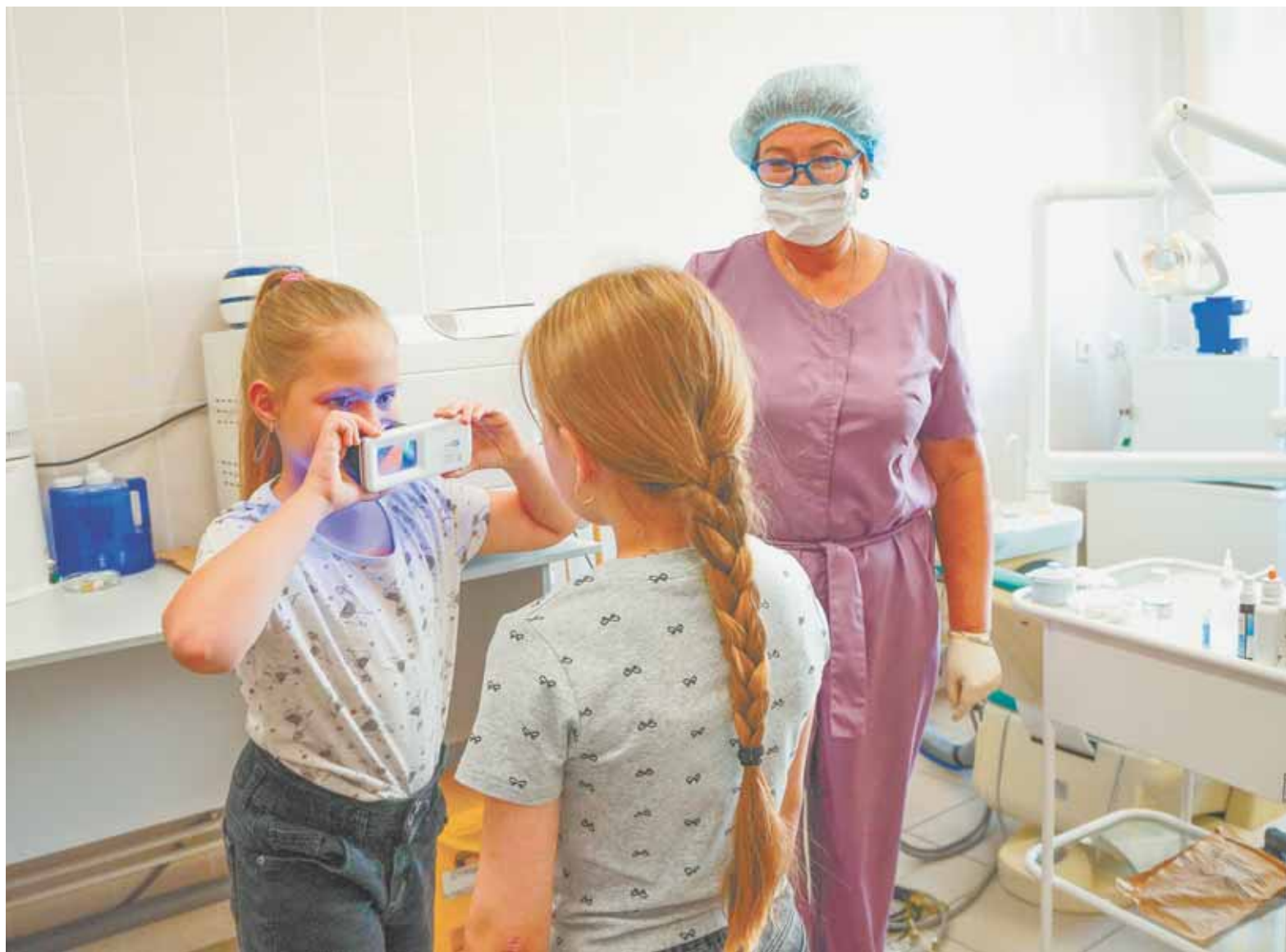
В стоматологическом кабинете школы № 132 специальный гаджет помогает ребятам убедиться, что зубы почищены правильно.

– Проанализировав итоги профосмотров, мы получаем пласт проблем, которые нужно решать. Важно предпринять комплекс мер, чтобы помочь этим детям. Именно в этих целях в Алтайском крае реализуется региональный проект в сфере здравоохранения «Школьная медицина», направленный на создание эффективной системы медицинского сопровождения таких учеников, – поясняет Ирина Потапова.