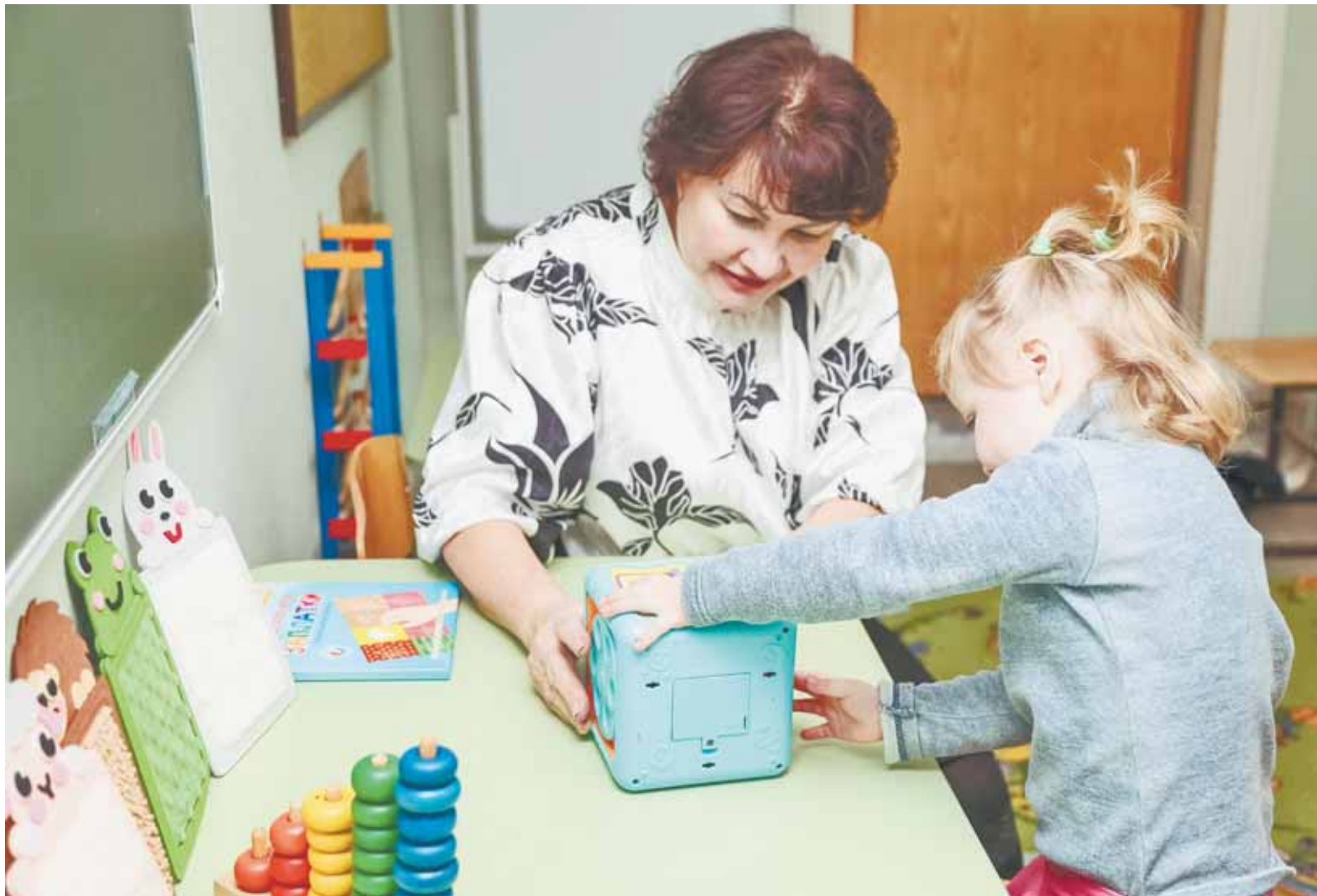
На базе центра проходят как групповые занятия, так и индивидуальные.

По сути мы сейчас продолжаем ту же деятельность, только теперь в новом помещении и при поддержке региона. Проект продлится