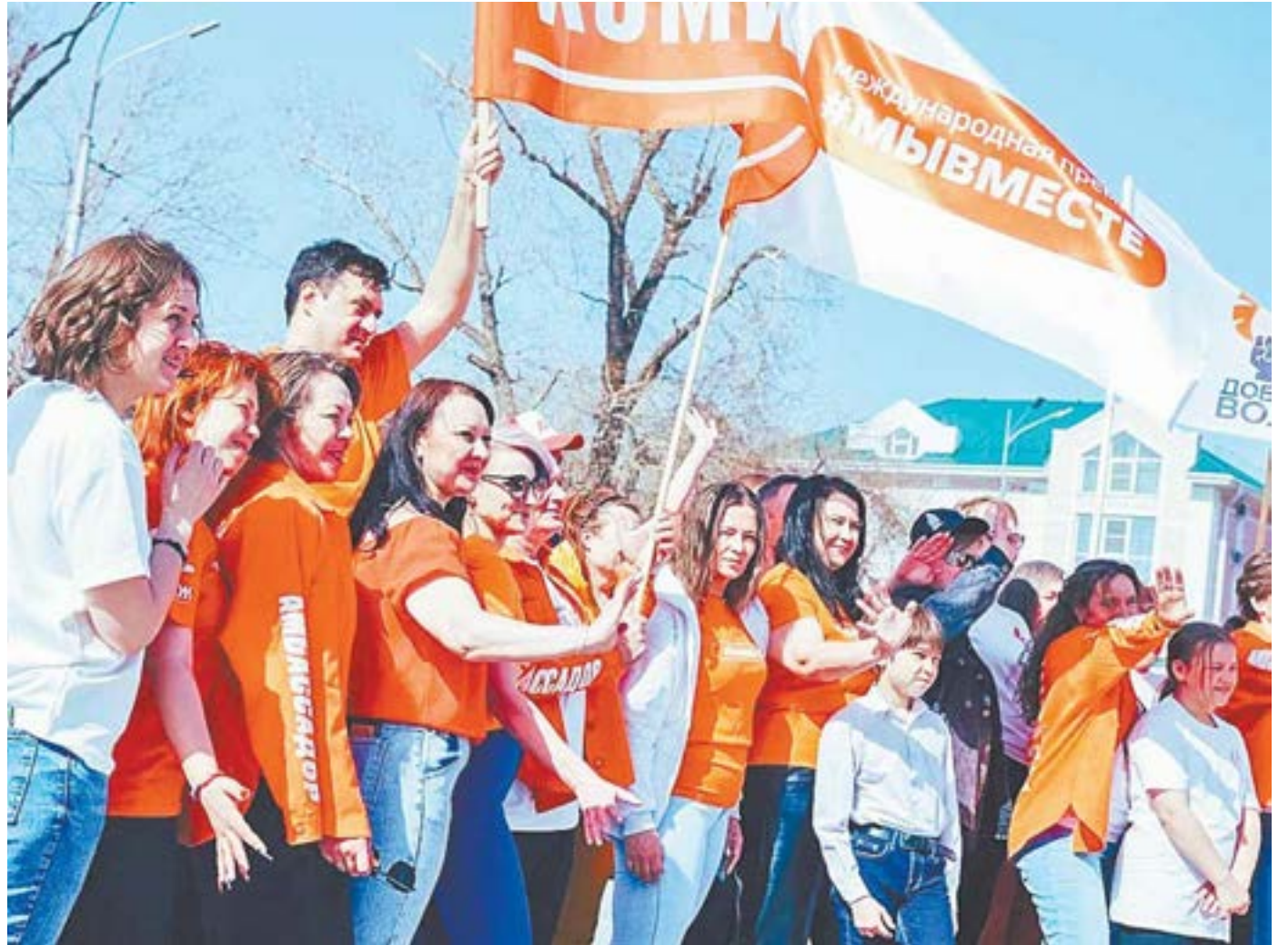
Старт V сезона премии #МЫВМЕСТЕ в Алтайском крае.

Алтайский региональный клуб #МЫВМЕСТЕ создан в декабре 2023 года. В него входит 155 человек — это руководители некоммерческих организаций, волонтерских объединений, представители бизнеса и органов власти.