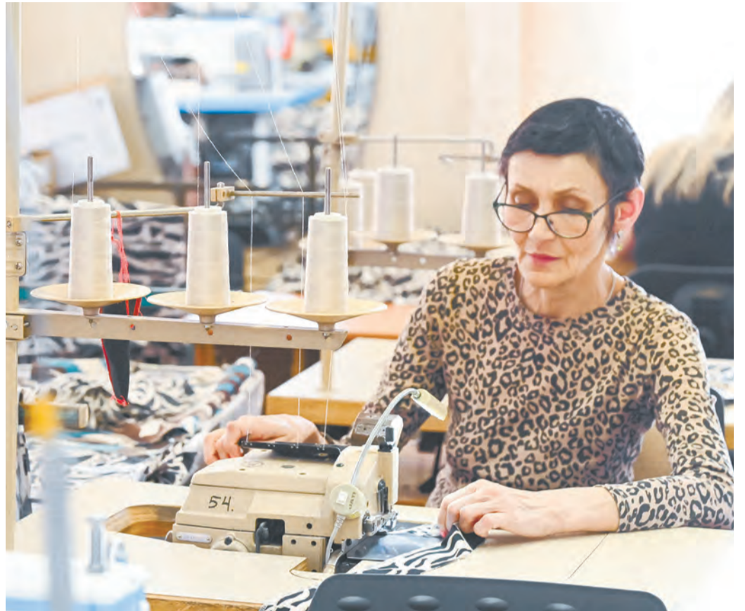
Школьники увидели, как устроено швейное производство.

В «Авангард» требуются специалисты. Причем разных направлений: швеи, конструкторы, технологи, а также инженеры, механики, программисты – производство здесь полуавтоматизировано, часть техники работает на программном управлении.