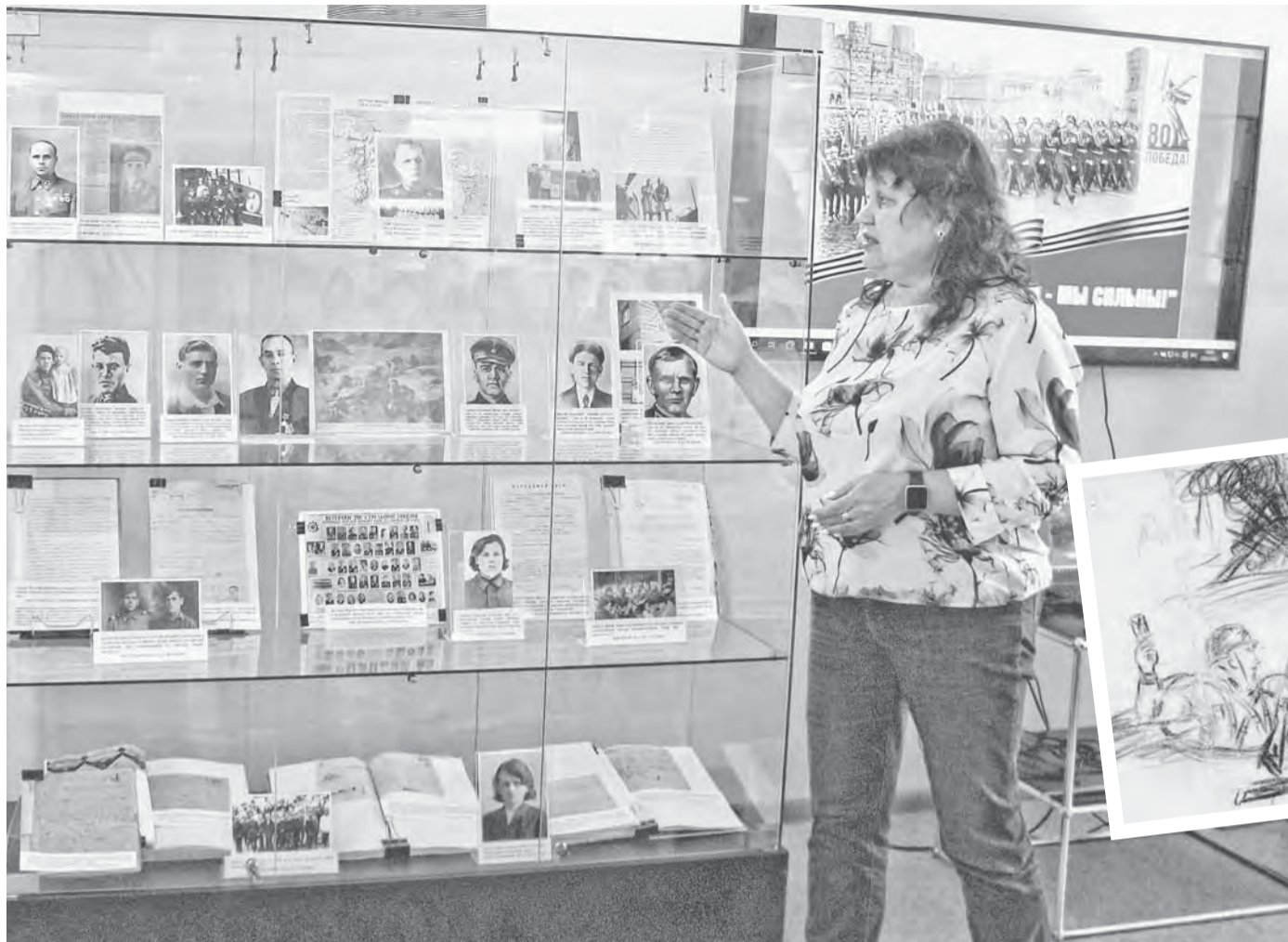
Экспозиция архива заинтересует широкий круг посетителей и будет полезна при внеклассной работе с учащимися.