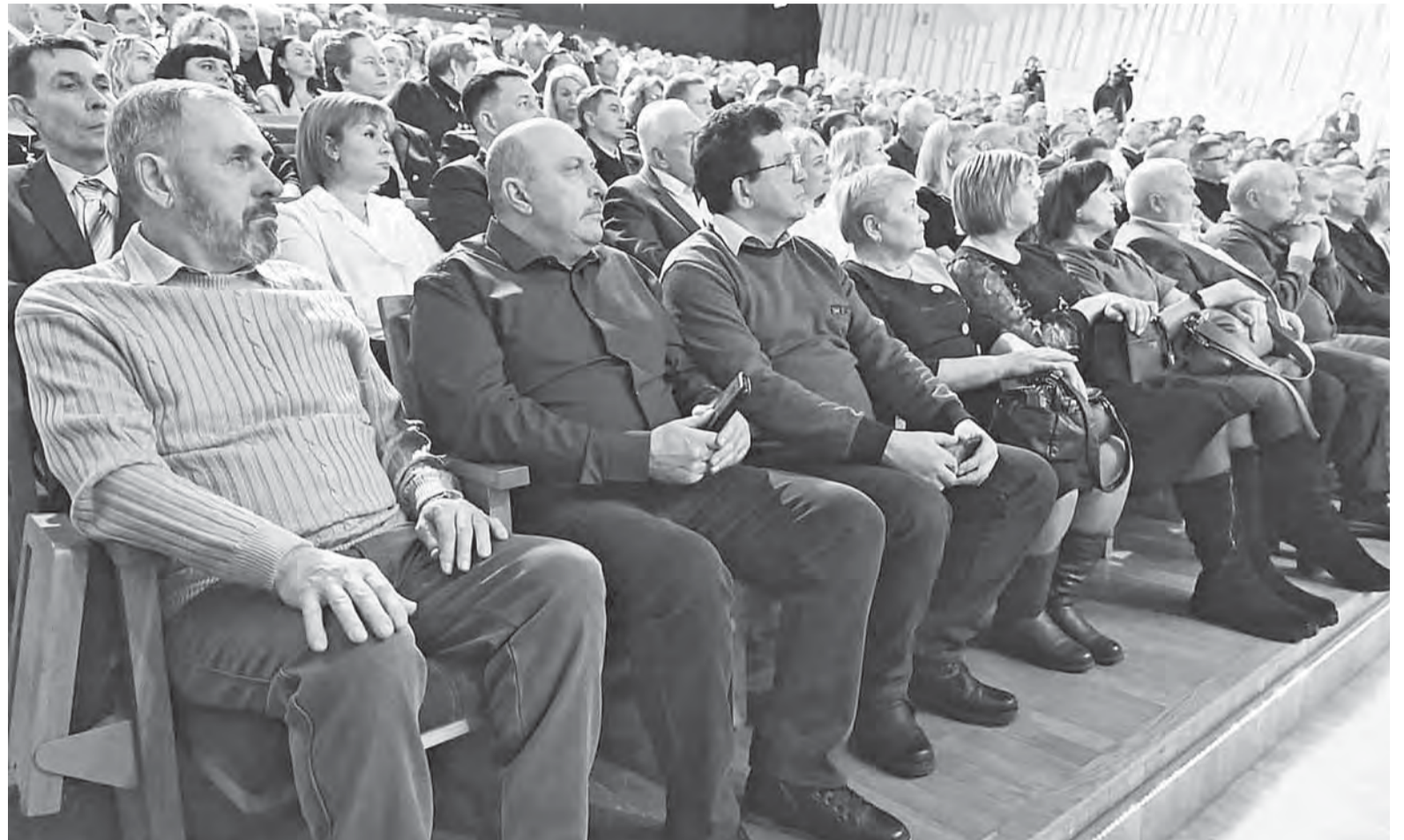
День работников бытового обслуживания населения и ЖКХ отмечается в таком широком региональном формате впервые.

– Благодаря каждому, кто вносит свой вклад в четкую работу всех коммунальных систем. А это тепло в наших домах, электричество, водоснабжение и многие другие аспекты, которые влияют на комфорт жизни буквально ежедневно, – подчеркнул Виктор Томенко. – Понимая все сложности в работе коммунального хозяйства края, ежегодно вкладываем в его обновление очень значительные суммы краевых средств, а также привлекаем федеральные. Важные проекты, за счет которых мы значительно улучшили надежность ЖКХ, были реализованы за последние несколько лет практически повсеместно. Так,