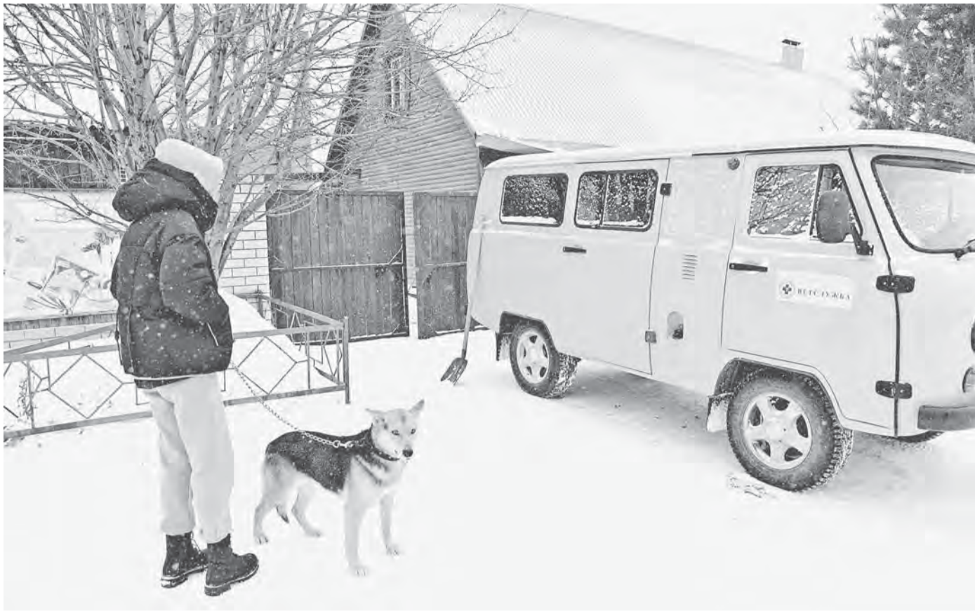
Жители пригорода зарегистрировали в мобильных пунктах более 3,5 тыс. животных.