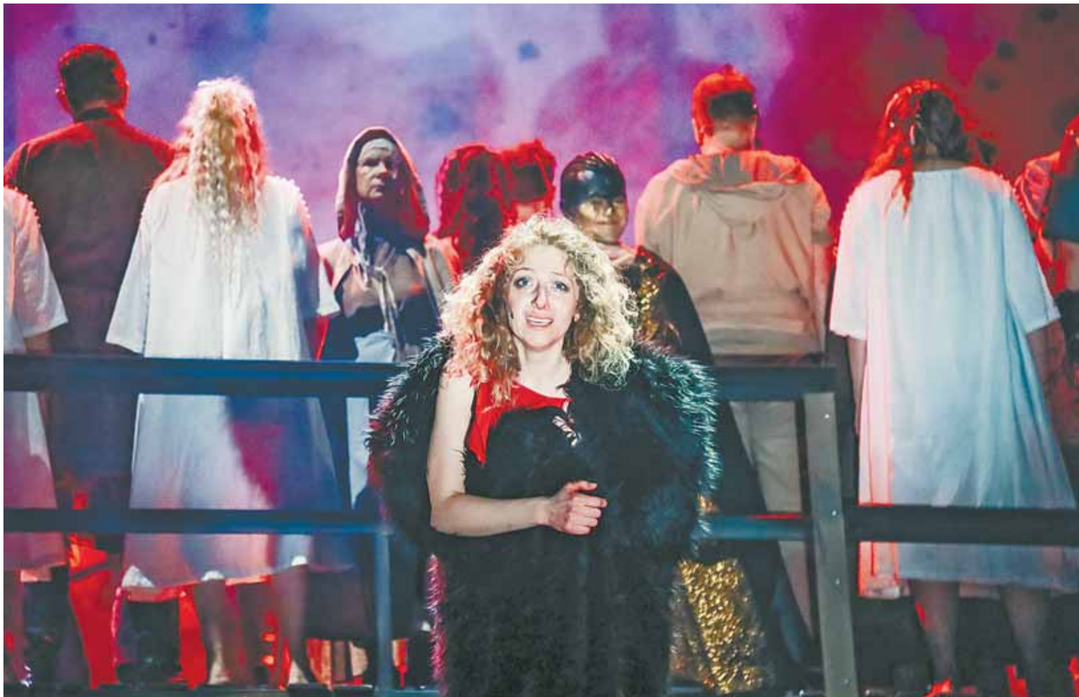
Новый спектакль МТА – в жанре музыкального мифа.