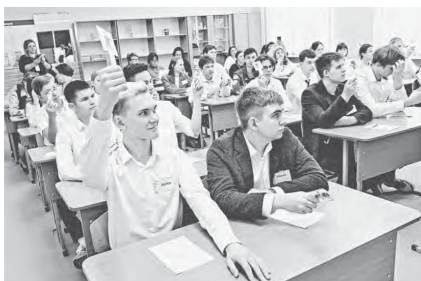
В этом году к конкурсным испытаниям привлекли одиннадцатиклассников школы № 136.

Уровень воды в Оби в районе г. Барнаула на 42 см выше нуля водомерного поста. Температура воды плюс 2 градуса.