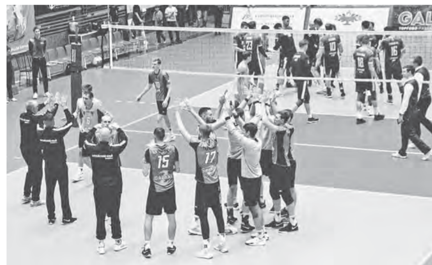
Первый круг «Университет» завершил на мажорной ноте.

В заключительных матчах первого круга стартового этапа Высшей лиги «А» чемпионата России по