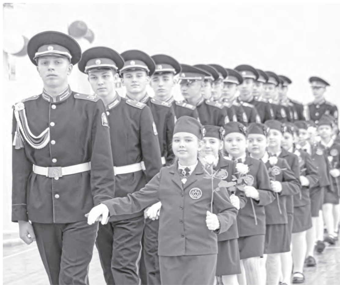
Во время церемонии посвящения юных воспитанниц сопровождали кадеты-старшеклассники.

У учащихся вторых классов все впереди. Первый шаг на большом пути – получение погон с буквой В. Значит, воспитанник. Настоящими кадетами они станут чуть позже. Сначала нужно многое научиться и многое узнать, например о знамени Барнаульского кадетского корпуса. На каждой церемонии посвящения знаменная