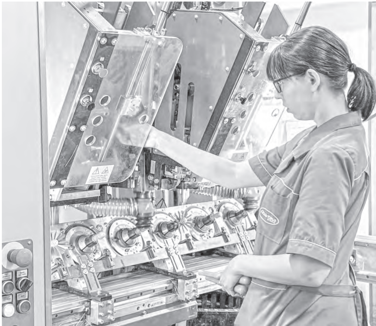
Туроператоры и гиды ознакомились с экскурсионными возможностями промышленных предприятий.

Первым экскурсионным объектом стала барнаульская компания «Мартика». За 25 лет работы на рынке пластиковых изделий предприятие нарастило ассортимент почти до полутысячи видов продукции. За полчаса экскурсии по цехам выпуска готовых изделий туроператоры и гиды Барнаула многое узнали о производстве эргономичных товаров для детей, дома и сада, которые реализуют в регионах России и шести странах.