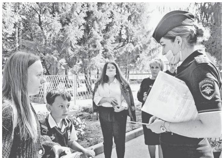
Школьникам напомнили о правилах на дороге.