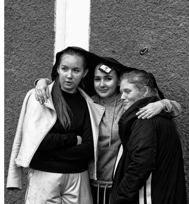
Дождь не помешал барнаульцам проявить себя в любимых видах спорта.