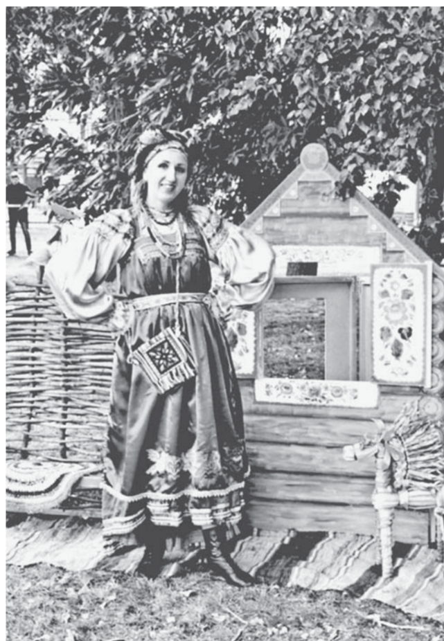
Красочные выставки цветов, спортивные баталы, кулинарные изделия и множество других моментов запомнятся барнаульцам и гостям города.