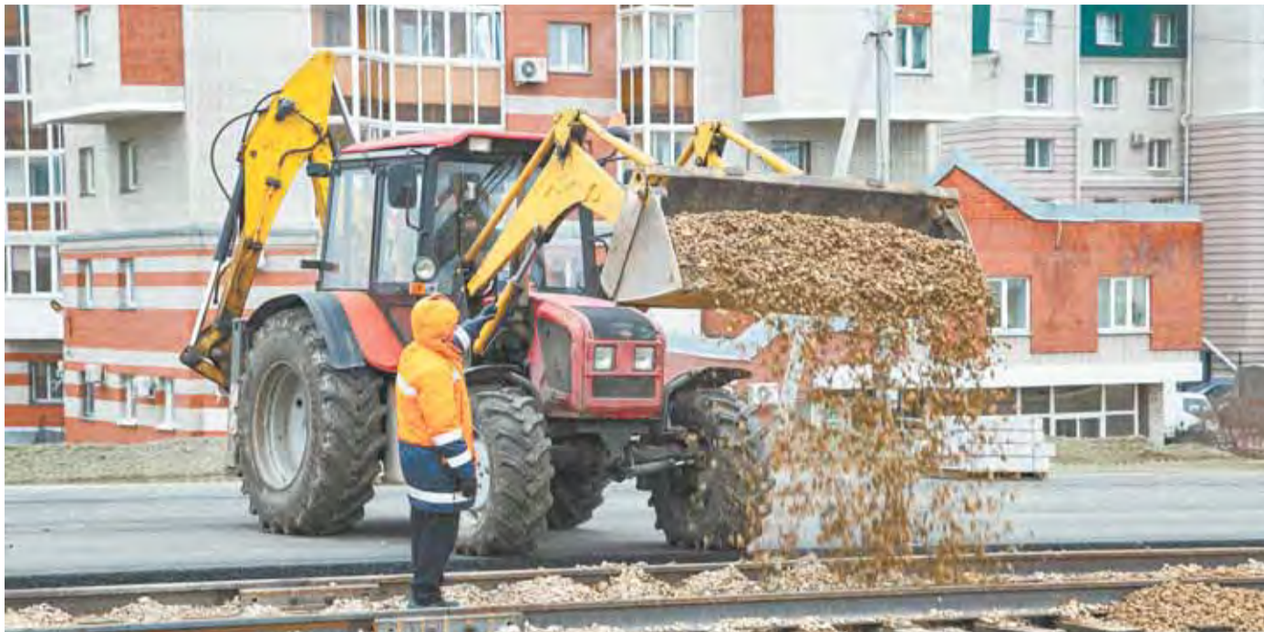
Работы по реконструкции моста идут в соответствии с графиком.

Пятница, 27 октября 2023 г. № 160 (5833)