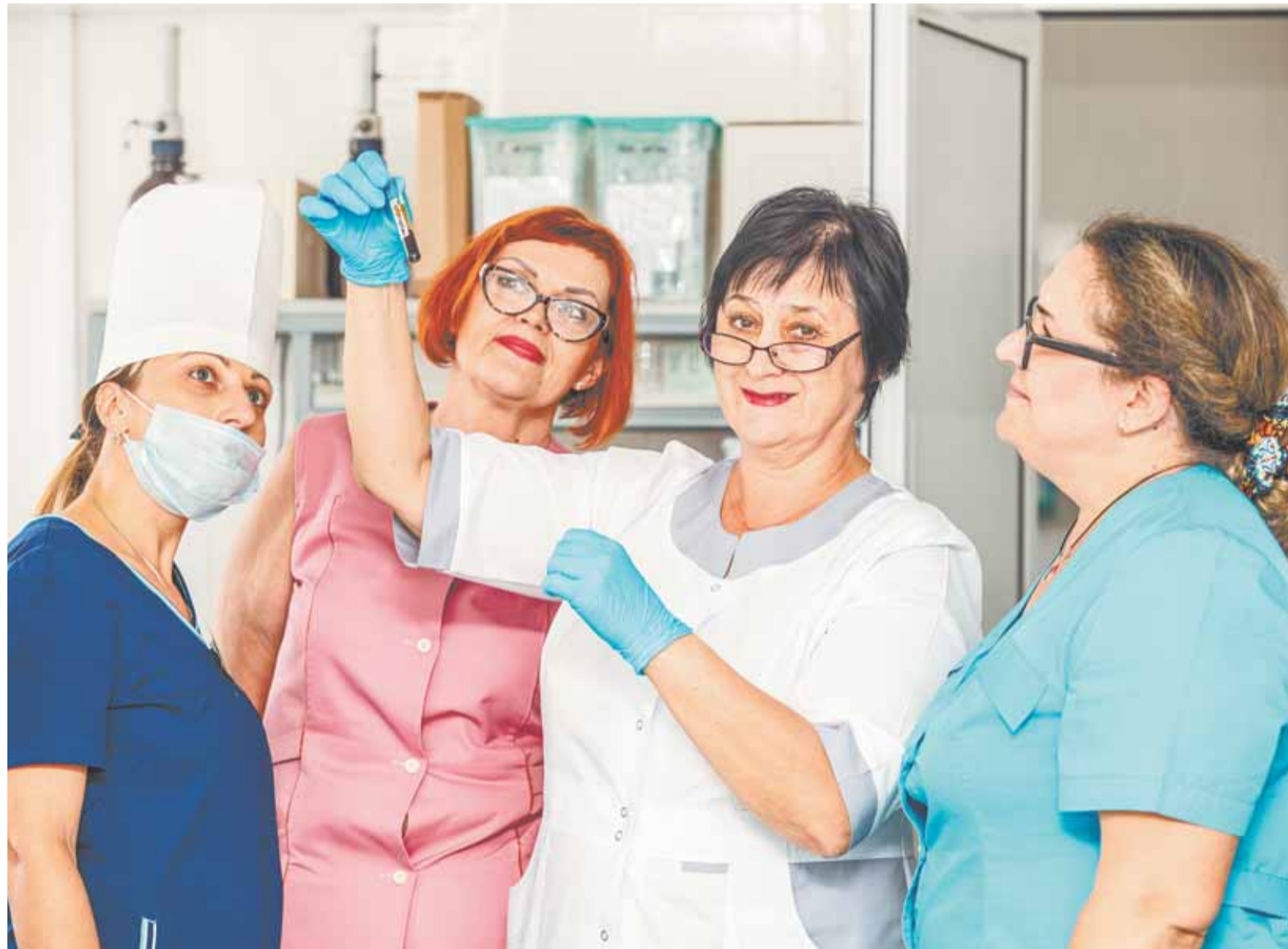
Труд специалистов экспресс-лаборатории незаметный для пациента, но очень важный.

– После ковида появились новые виды анализов. Кроме