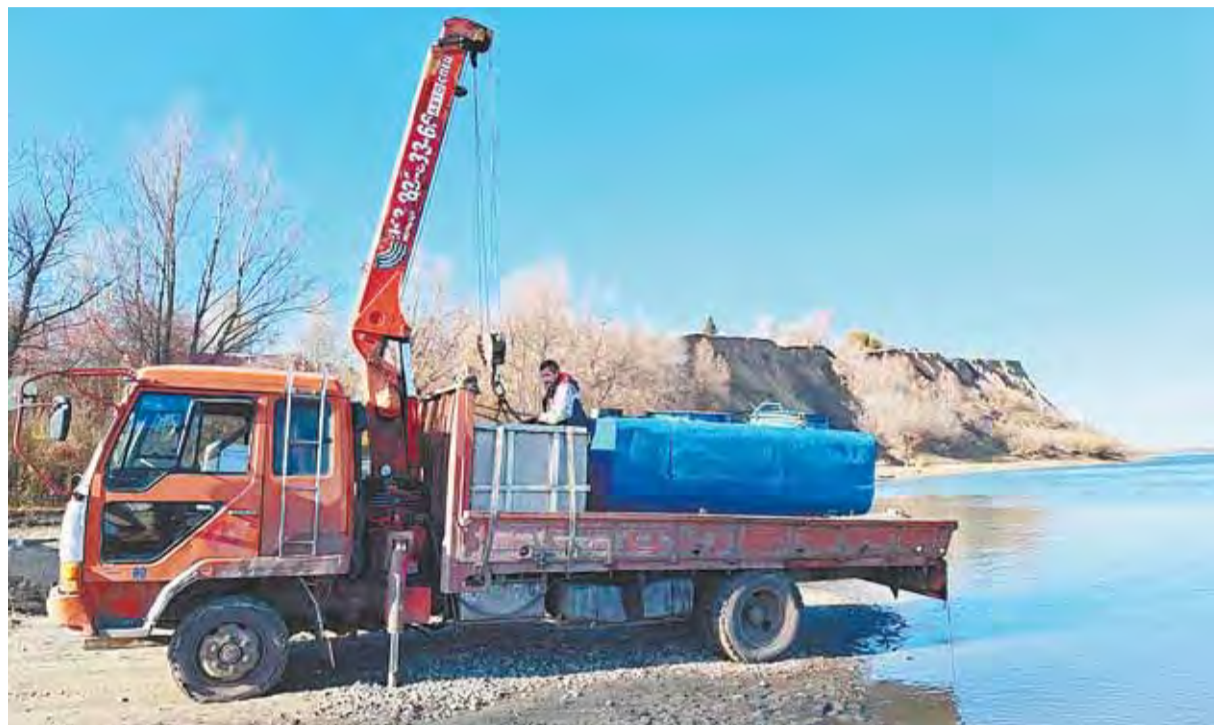
Выпуская мальков каждую осень, предприятие помогает реке восстановить ресурсы.