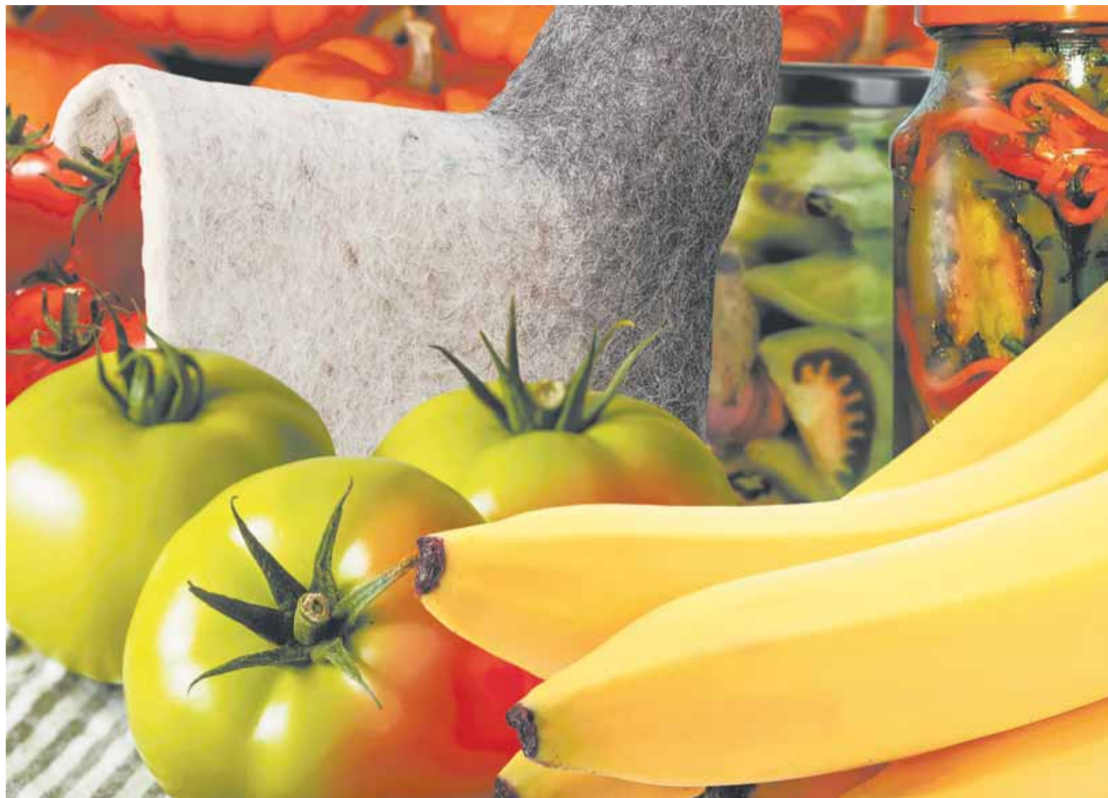
Коллаж Александра ЕРМОЛОВИЧА

А из поспевших томатов можно приготовить замечательное противостудное средство – перекрутить их с добавлением огородного хрена, добавить по вкусу соль. Заготовка будет вкусным и