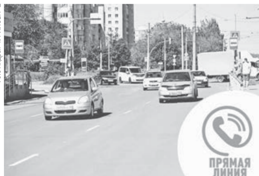
Дорожники уже завершили ремонт по нечетной стороне ул. Антона Петрова от ул. Попова до ул. Малахова и участка малого Павловского тракта.