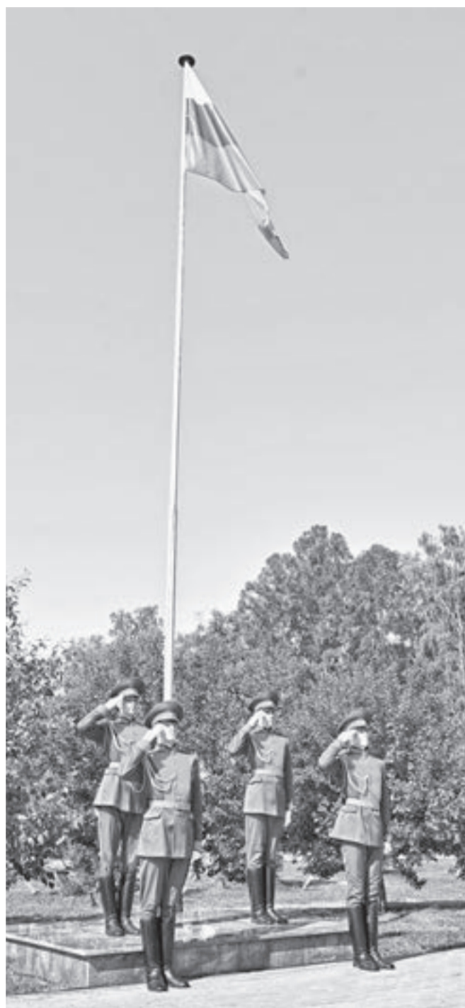
Праздничные мероприятия в честь Дня России прошли во всех районах Барнаула.