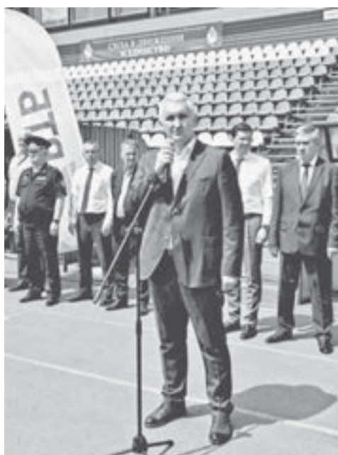
После первого этапа на стадионе «Динамо» состоялась награждение победителей и призеров групповой стадии.