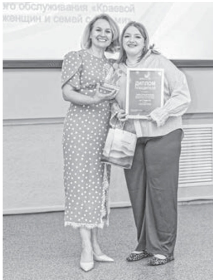
Министр соцзащиты региона Наталья Осыкина (слева) вручила награду победителю профессионального конкурса.

Стоит отметить, что сегодня в регионе трудится порядка 8700 социальных работников, из них около 1500 – представители молодого поколения. Для них на местах создается система наставничества, помогающая влиться в такую непростую сферу. При этом опытные коллеги отмечают, что тоже учатся многому у молодежи, например, работе с новыми информационными программами.