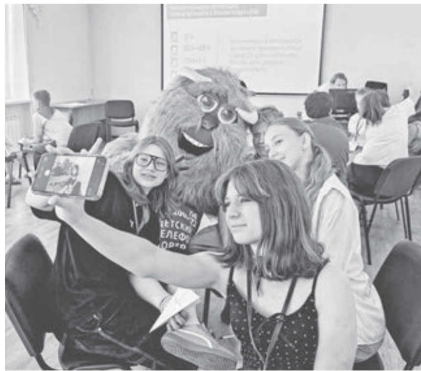
На профильных сменах ребята получают знания и заряжаются позитивом.