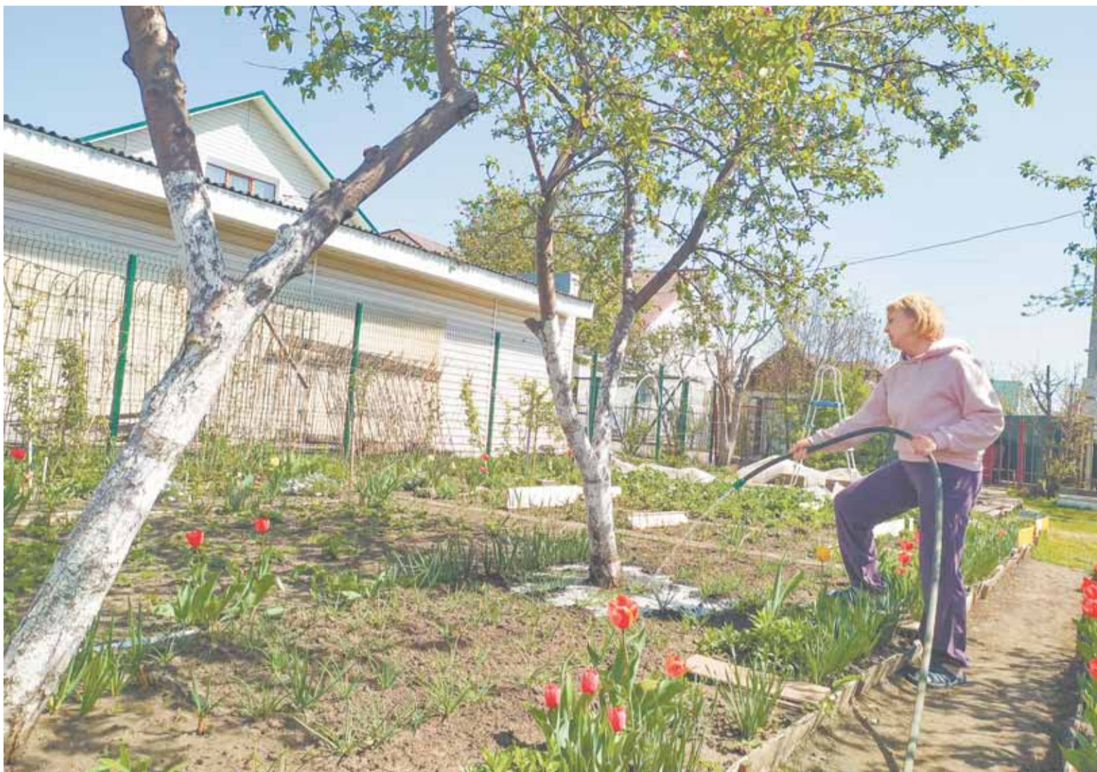
После холодов важно насытить растения влагой.