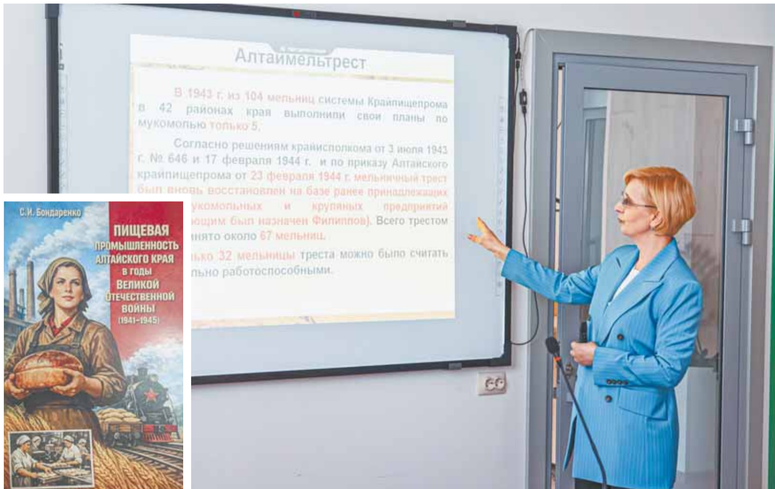
Монография Светланы Бондаренко открывает неизвестные страницы истории военного периода Алтайского края.

Проблемой при изучении темы был тот факт, что далеко не все предприятия пищевой промышленности были трестированы: существовало очень много разнообразных форм предприятий, разной подчиненности от федеральной до местной, так что свести все воедино оказалось крайне сложно. Поэтому изучить отчетную документацию по трестам оказалось наиболее возможным.