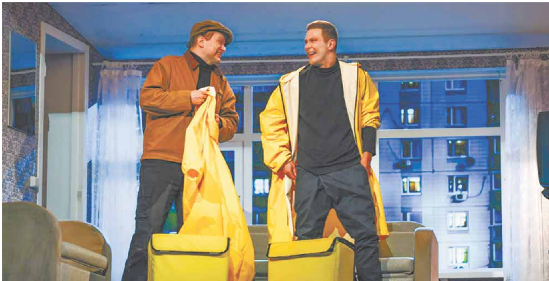
В Московском художественном театре спектакль «Жил. Был. Дом» определен как «народная сказка для взрослых».