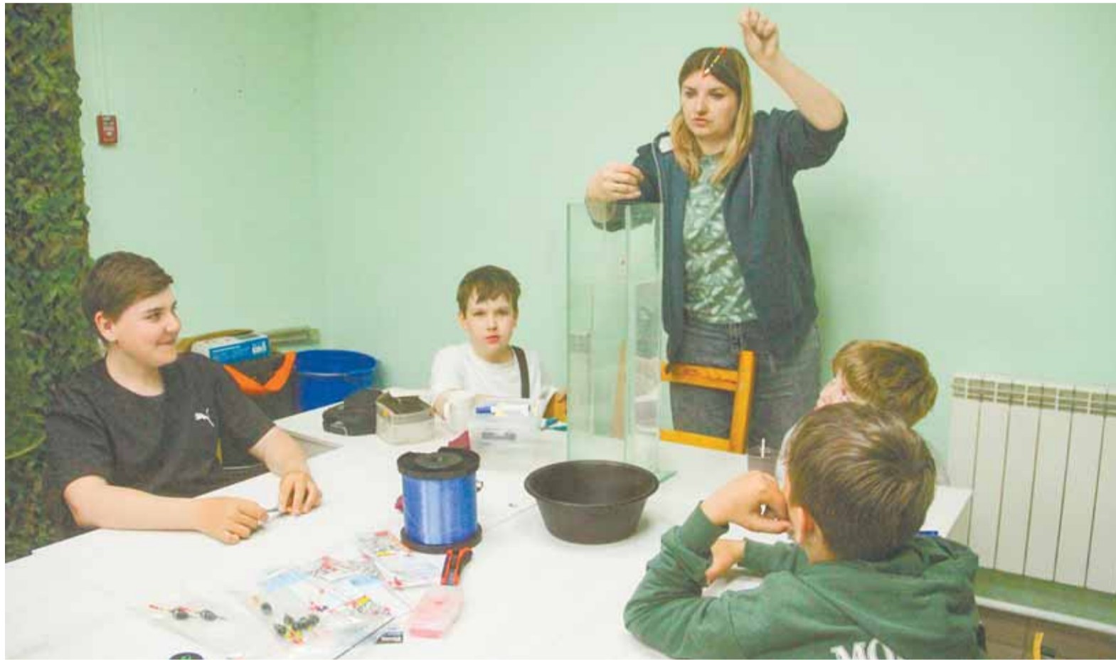
На занятиях теорию юные рыболовы тут же закрепляют на практике.

– Еще более удивительно, что из них только трое –