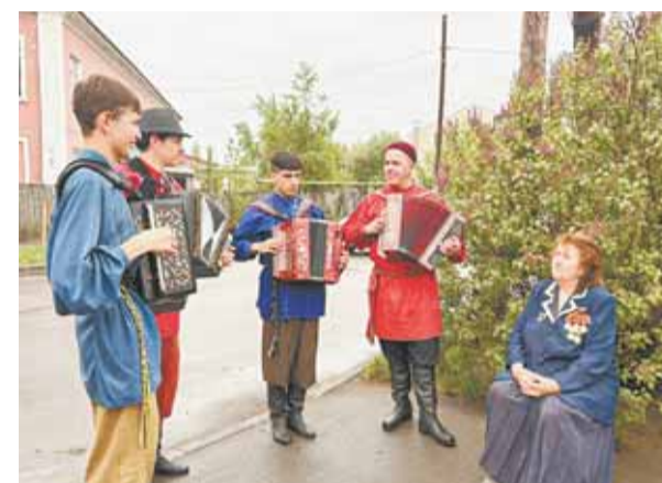
Каждому ветерану поздравляющие сказали много теплых слов.