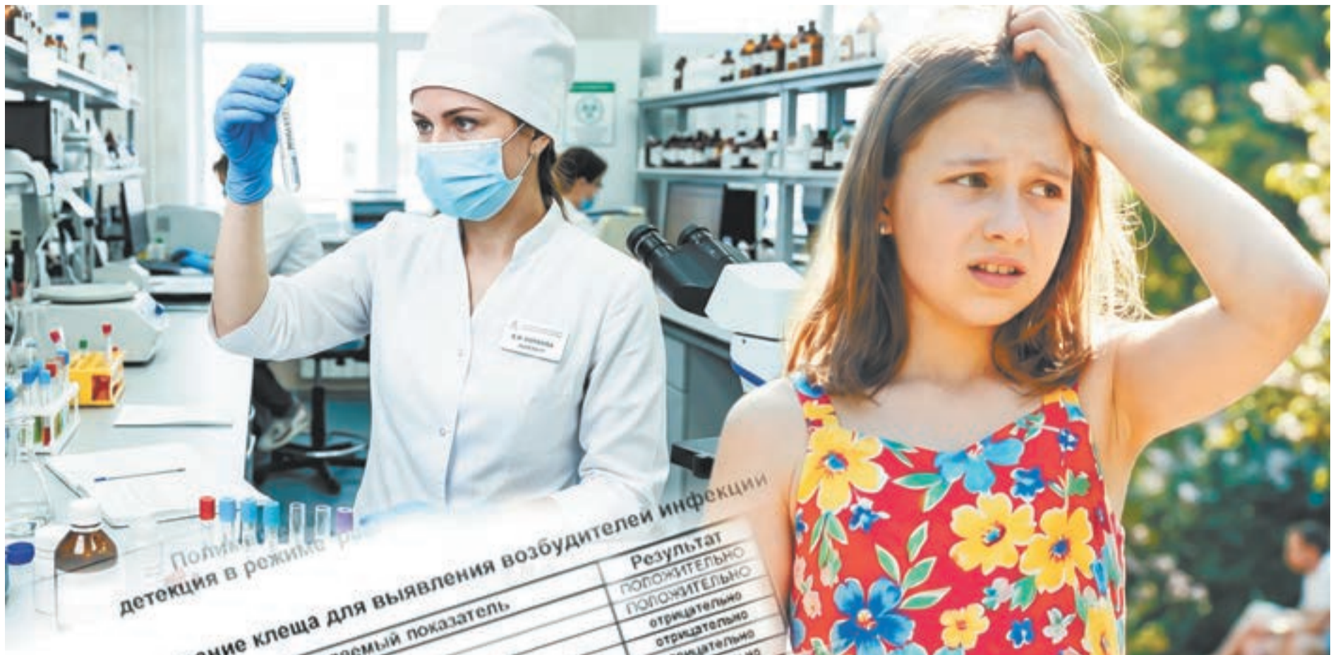
Коллаж Александра ЕРМОЛОВОЙ