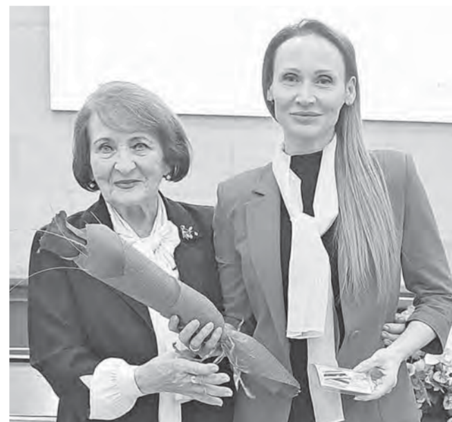
На открытии форума отметили большой вклад женсоветов, в том числе при главе города Барнаула, в развитие муниципалитетов и помощь семьям и детям.