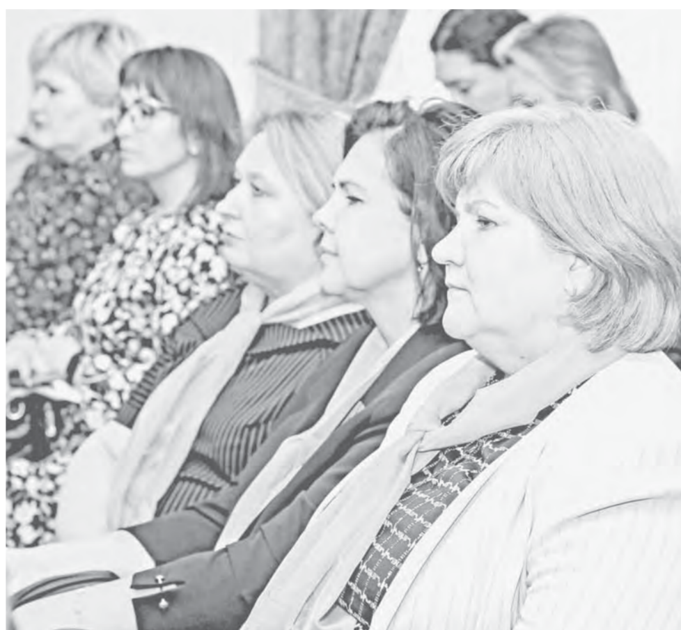
Каждая площадка, которую посетили участницы форума, была насыщена мастер-классами, встречами, обменом опытом.