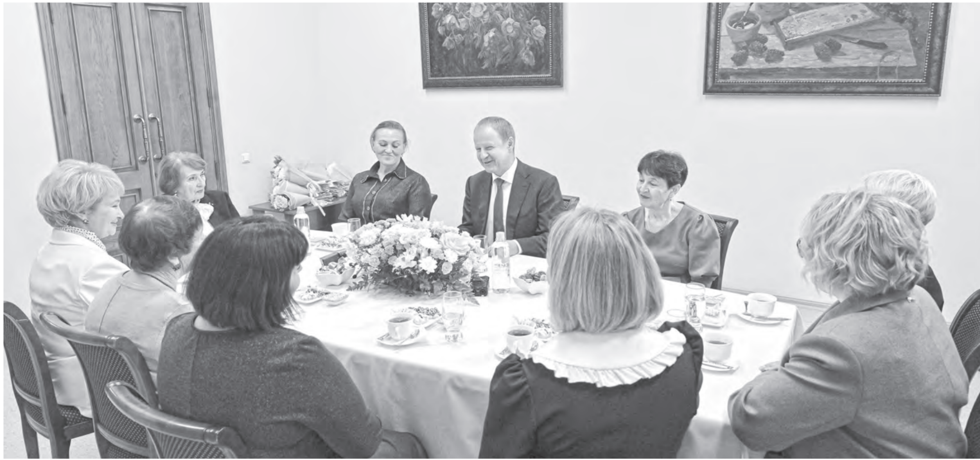
Губернатор поздравил участниц встречи с Днем матери и поблагодарил за достойное воспитание сыновей.

Матери героев ведут активную общественную и патриотическую работу