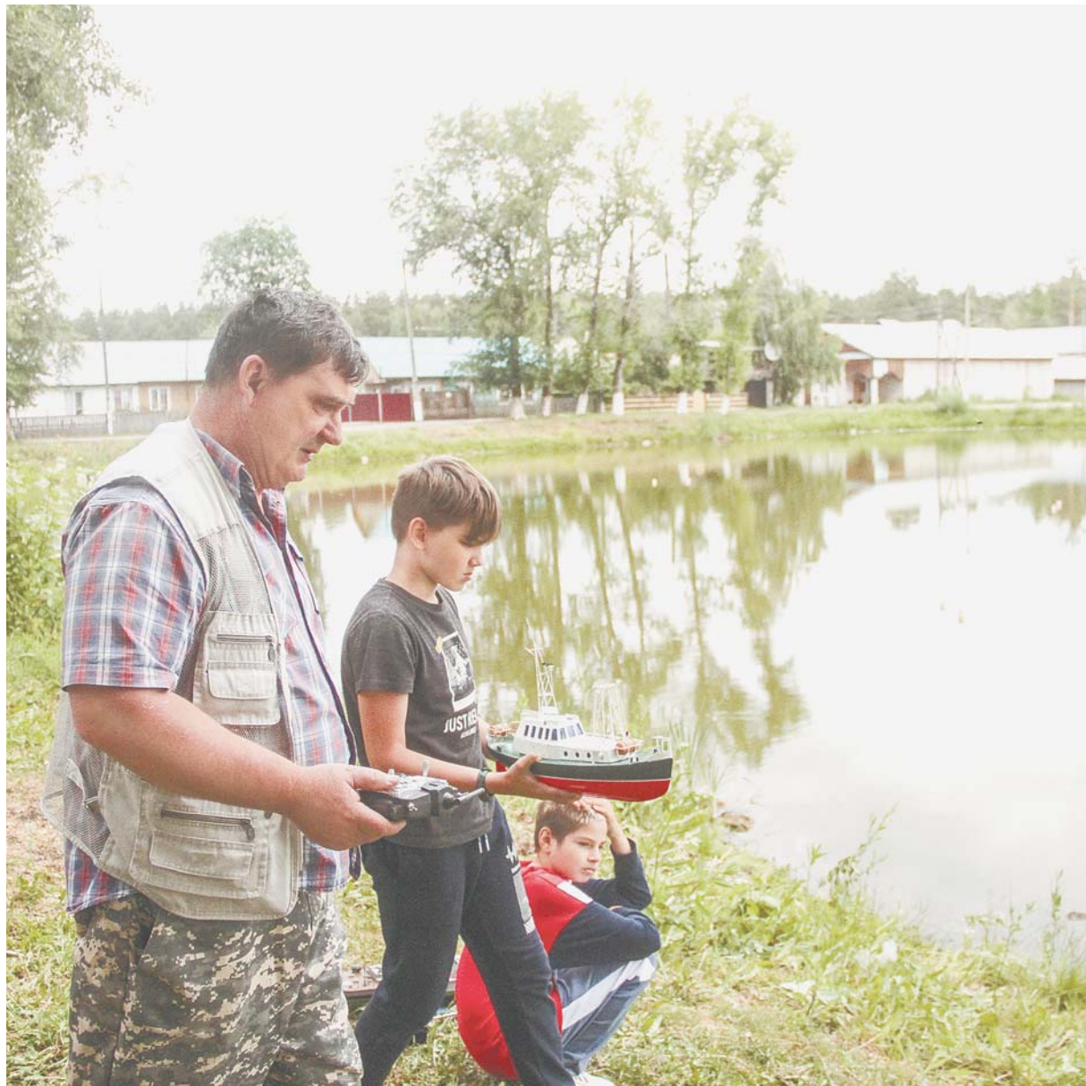
Судомоделирование обязательно поможет мальчикам в будущем.

Третий этап – ходовые испытания, где суда соревнуются в нескольких классах. Одни, например, самоходные – участник с берега вручную запускает корабль, причем должен все рассчитать так, чтобы он прошел по определенной