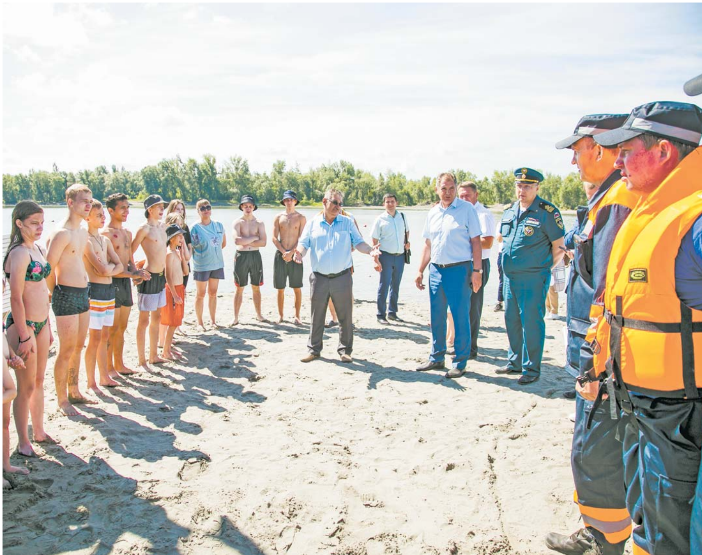
Перед практическими занятиями ребятам рассказали о теоретических основах спасения утопающих.