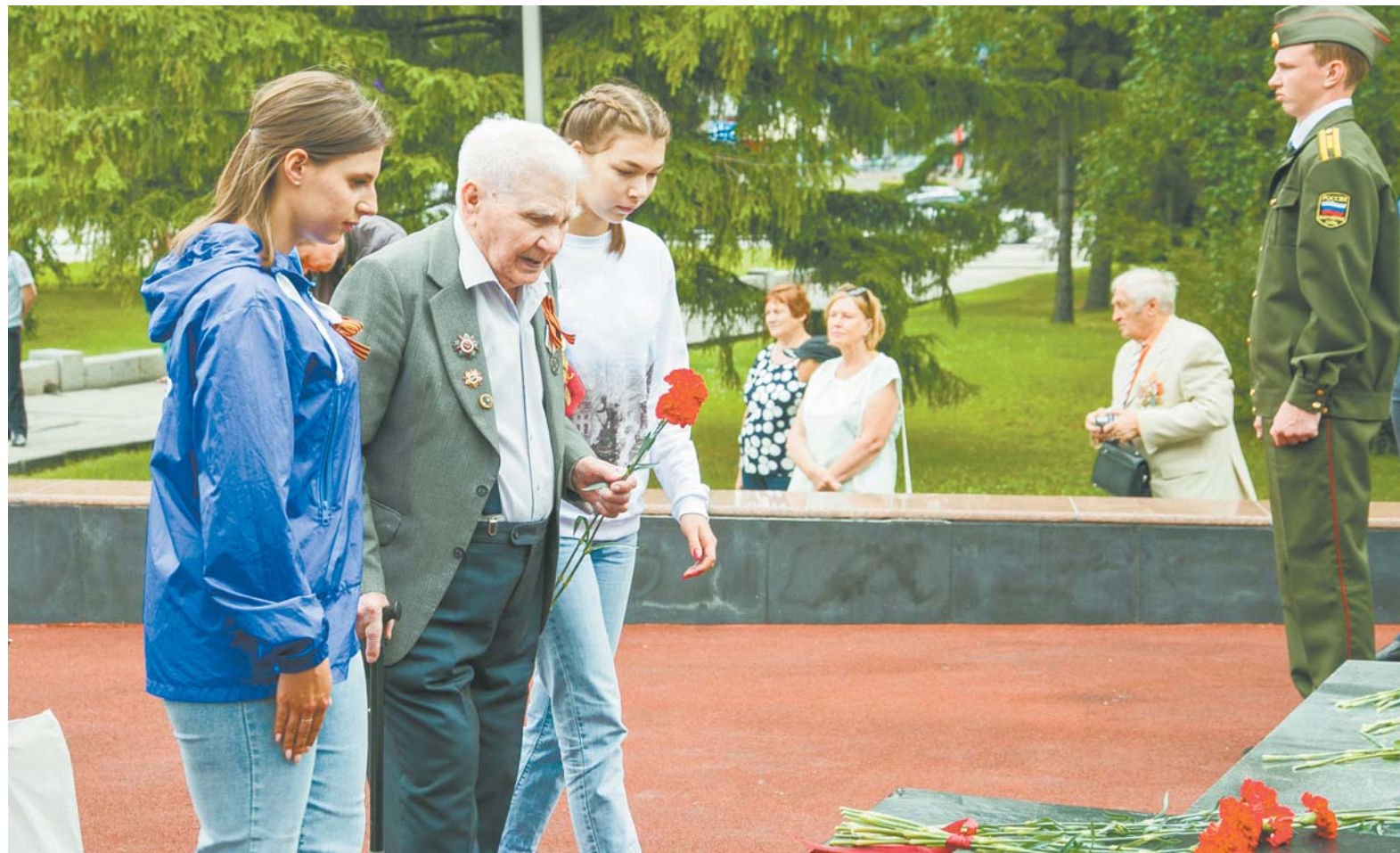
В День памяти и скорби барнаульцы почтили память не вернувшихся с войны героев.