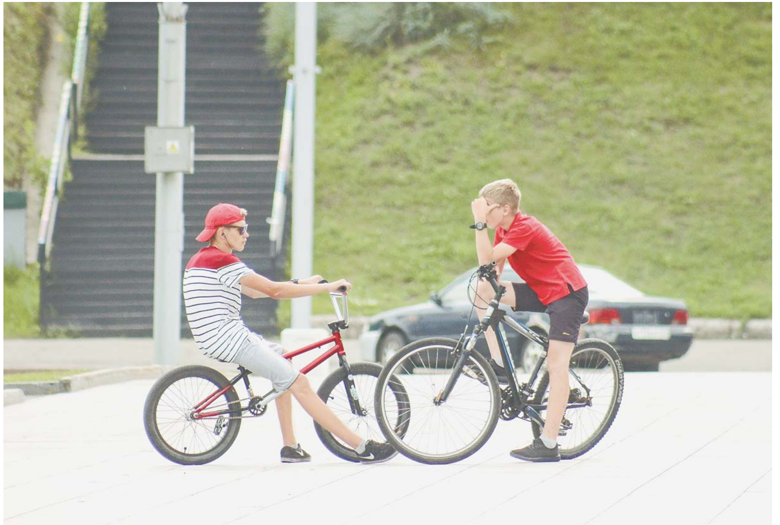
Безопасность детей на дороге в первую очередь зависит от внимательности взрослых.

Конечно, говорить, что все вышеперечисленное касается