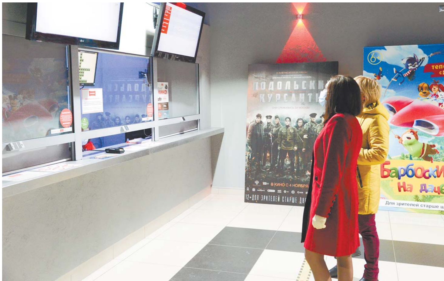
Киноиндустрия - одна из самых пострадавших сфер бизнеса в условиях новых ограничений.