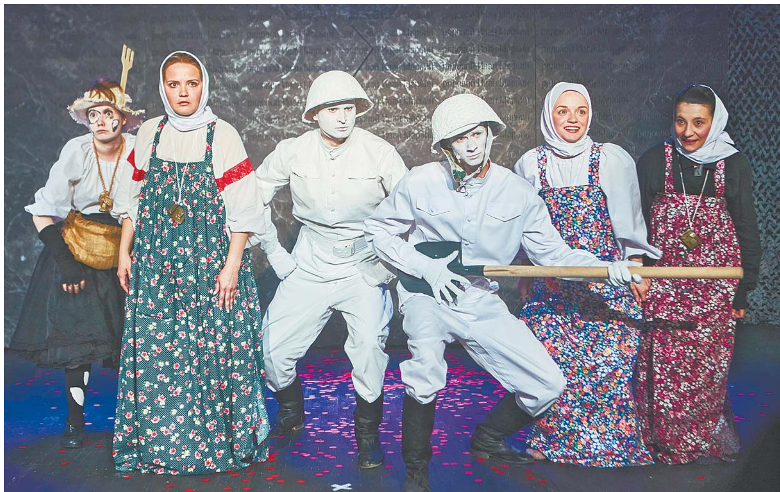
Сцена из спектакля «Марьино поле» Новосибирского молодежного драматического «Первого театра».

14 тонн декораций, оборудования и костюмов путешествовало в рамках фестиваля-тура по четырем городам, а это маршрут протяженностью в 1500 км.