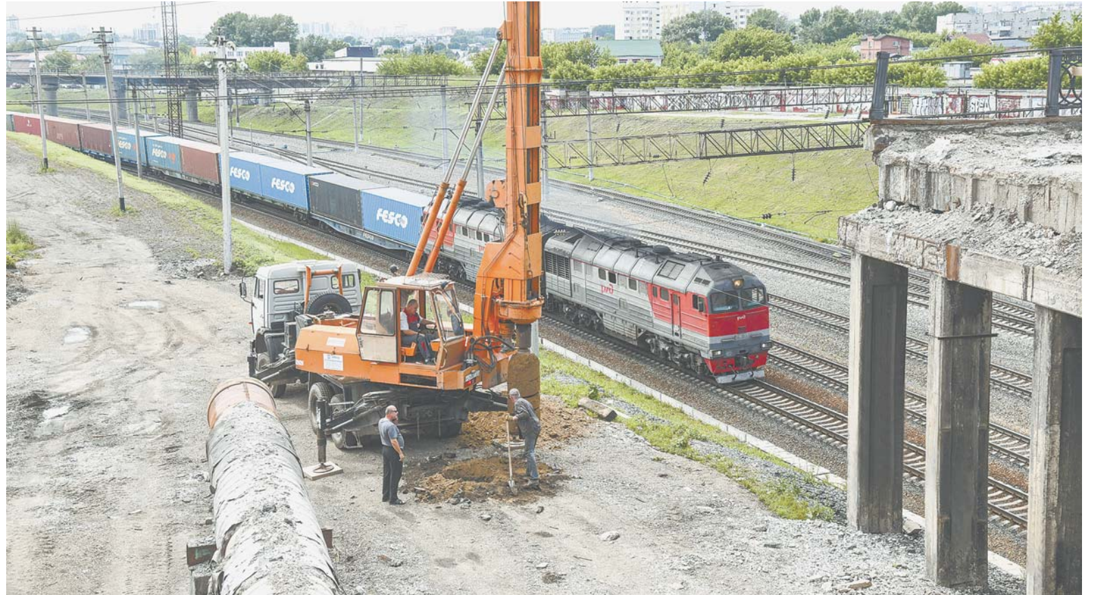
На путепроводе идет демонтаж старых конструкций.

Также на совещании было отмечено, что завершается работа по согласованию проек-