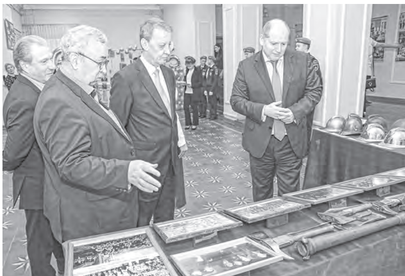
Перед концертной программой почетные гости ознакомились с юбилейной выставкой.