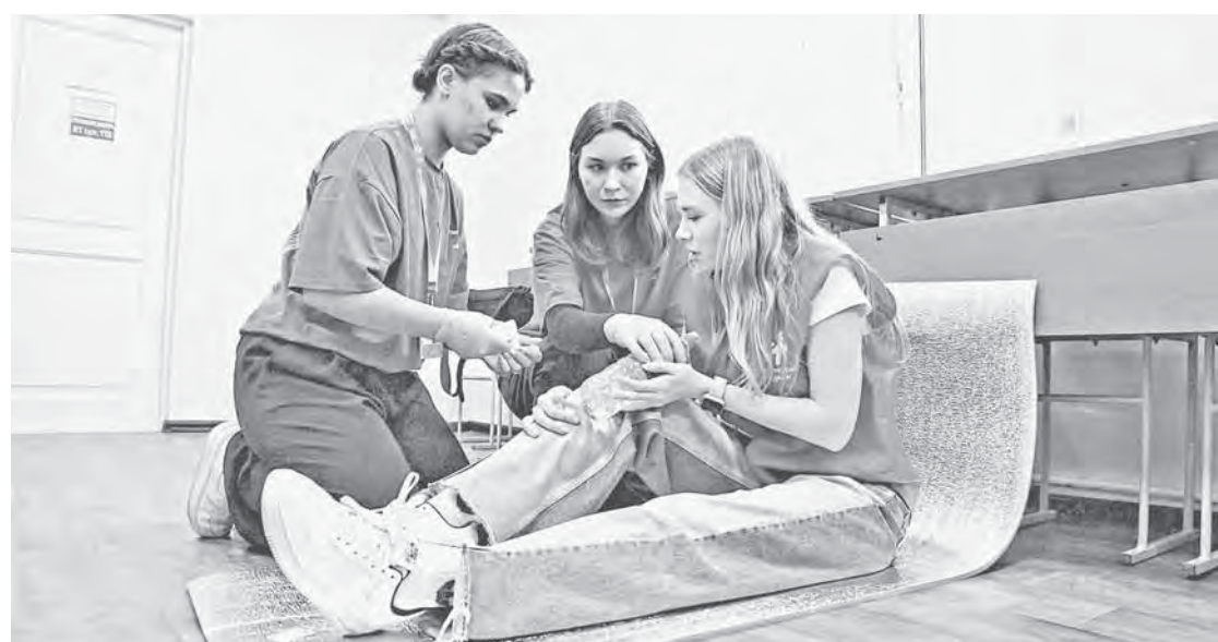
Волонтер изображает травму ноги, а участники соревнований помогают подручными средствами.