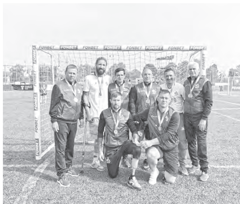
Футболисты «Динамо-Алтай» готовы помочь участникам СВО.