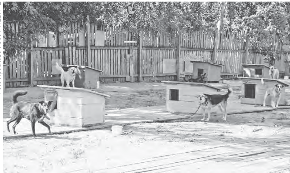
В рамках гранта на территории приюта обустраивают дополнительные места для бездомных животных.