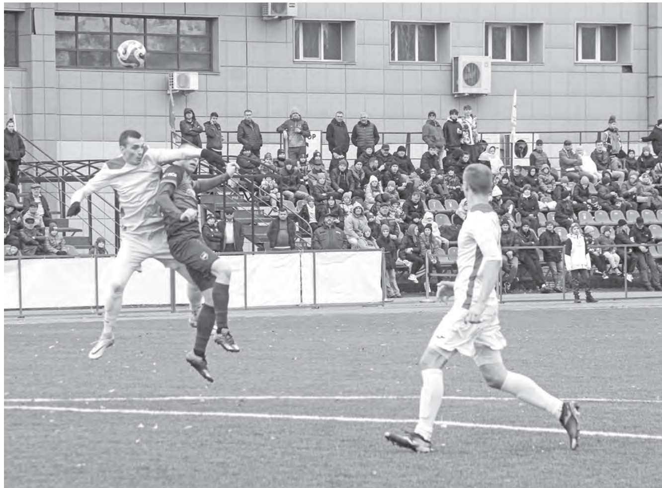
Футболисты порадовали трибуны яркой и напряженной игрой.

Победитель финала Кубка Алтайского края по футболу определен в серии пенальти