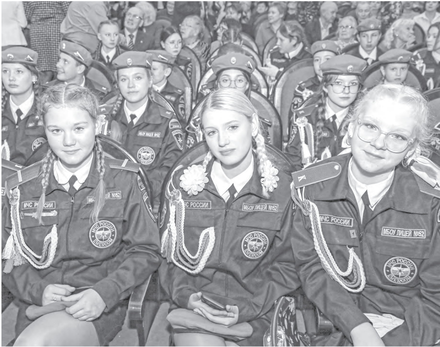
Учащиеся лицея № 52 регулярно показывают свой высокий уровень в различных соревнованиях.