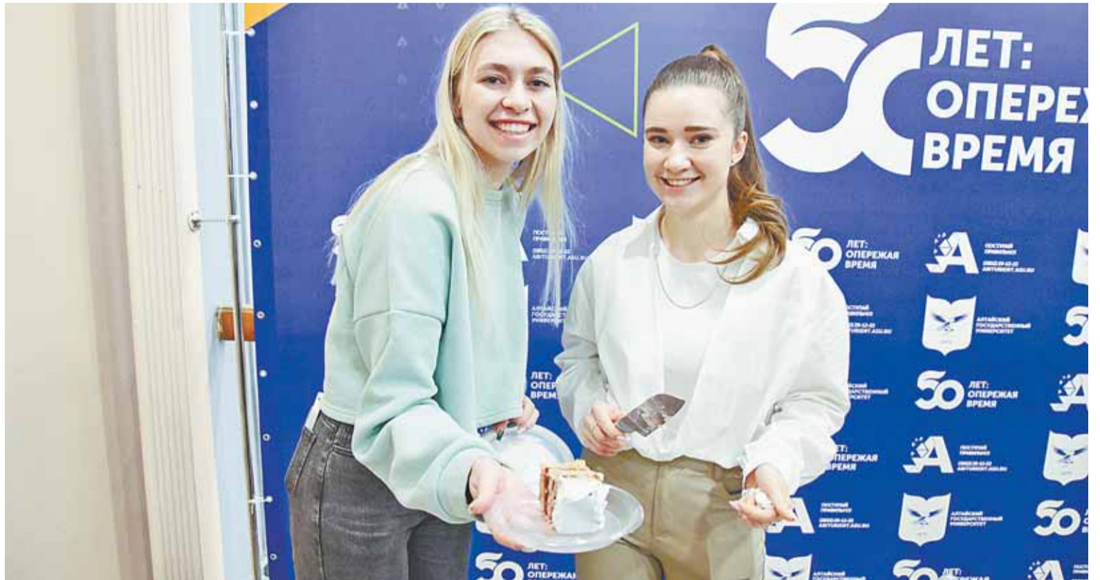
Ежегодно в День студента в АлтГУ пекут огромный торт, которым угощают всех участников праздника.

В Алтайском государственном университете празднования в честь Дня студента начались уже с понедельника. 20 января стартовал фотопроjekt «Твое яркое студенчество в АлтГУ», прошел мастер-класс по росписи шопперов. В течение недели для студентов организовали просмотр научно-популярных фильмов, интеллектуальную игру, массовое катание на лыжах. 24 января АлтГУ устраивает уличные гулянья перед корпусом вуза с традиционным угощением – 50-килограммовым пряничным тортом и 60 литрами сбитня для всех участников праздника.