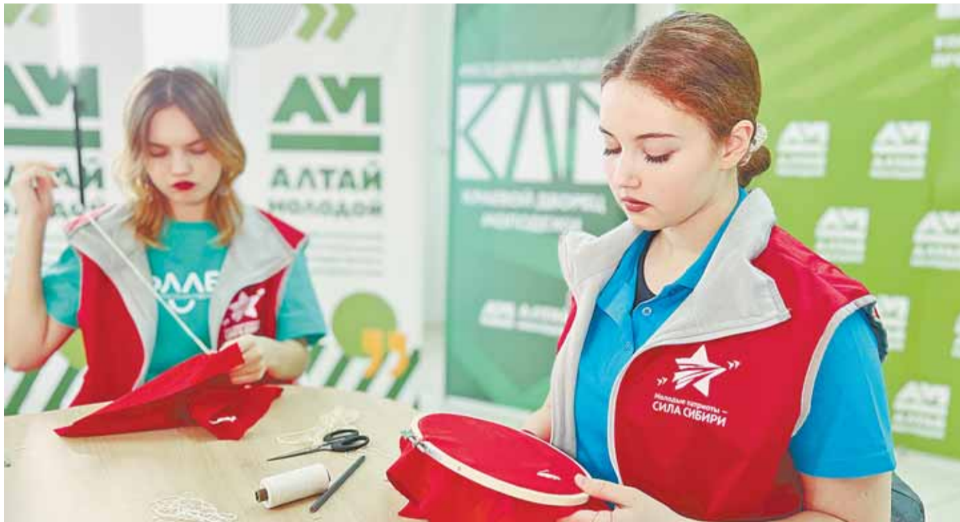
Волонтеры патриотических объединений готовят к запуску в соцсетях ролик об акции и участвуют в ней сами.