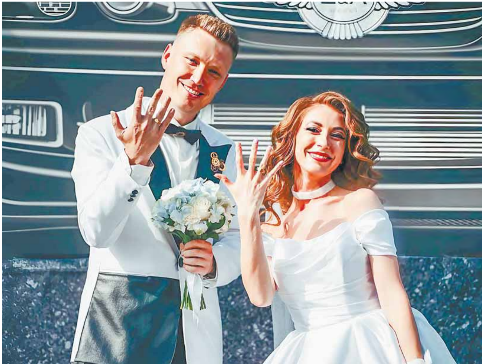
Кольца для регистрации привезла радиоуправляемая машинка.

Выигранный денежный приз супруги Фёдоровы потратят на путешествие мечты.