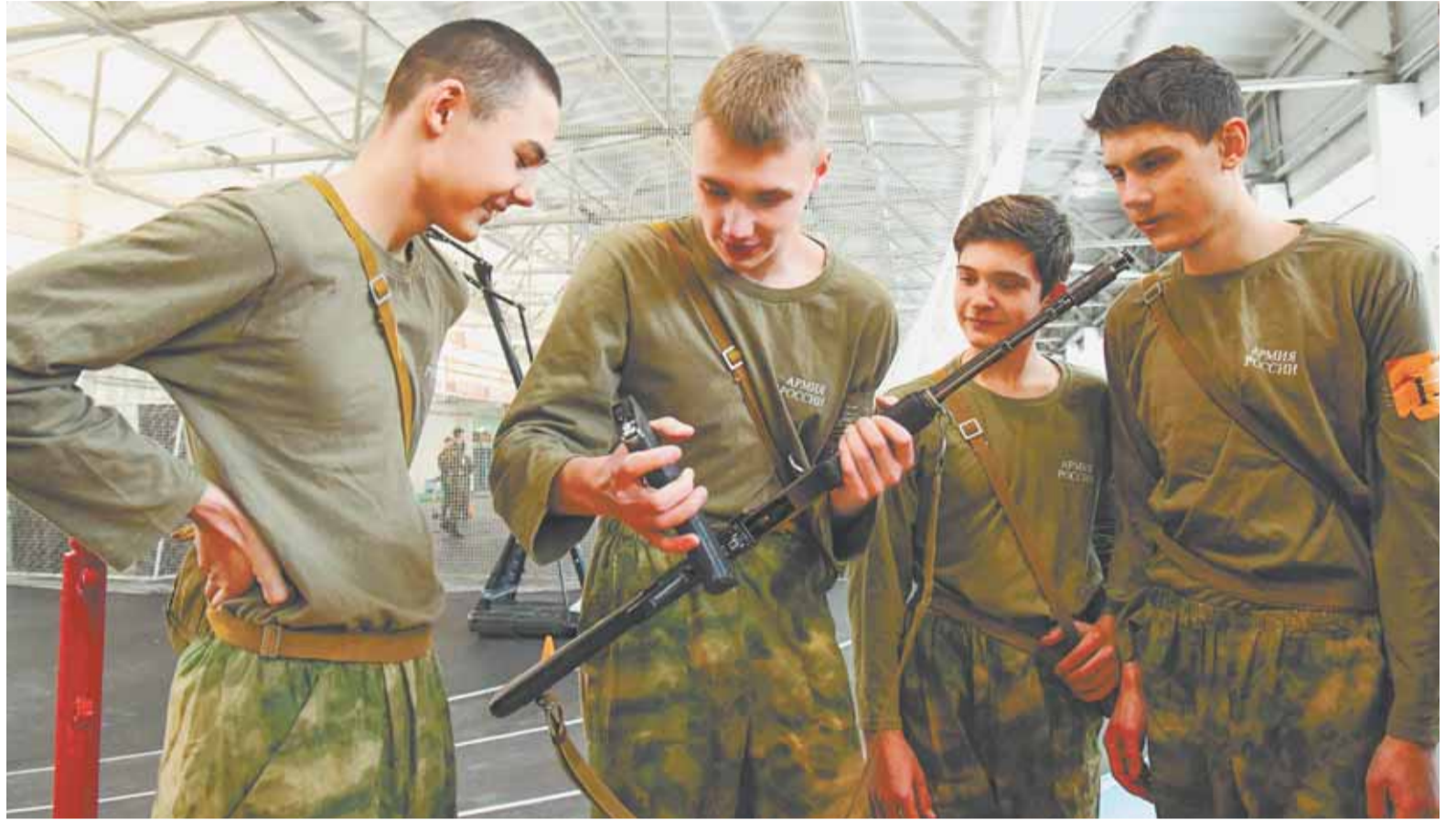
Конкурс «А ну-ка, парни!» – одно из самых ярких событий месячника.

– В рамках месячника в городе пройдет традиционный окружной фестиваль патри-