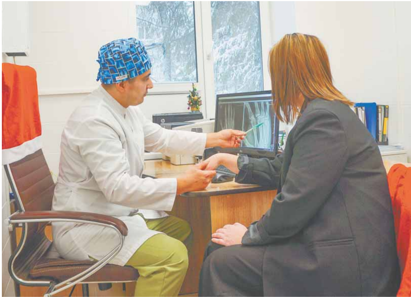
Травмы, полученные во время падения зимой, нередко заканчиваются переломами.

В быту к опасным падениям часто приводит работа по дому на высоте – замена лампочки, переключивание вещей на антресолях, работы со стремянки. За 20 дней января переломы при работе в быту получил 51 человек.