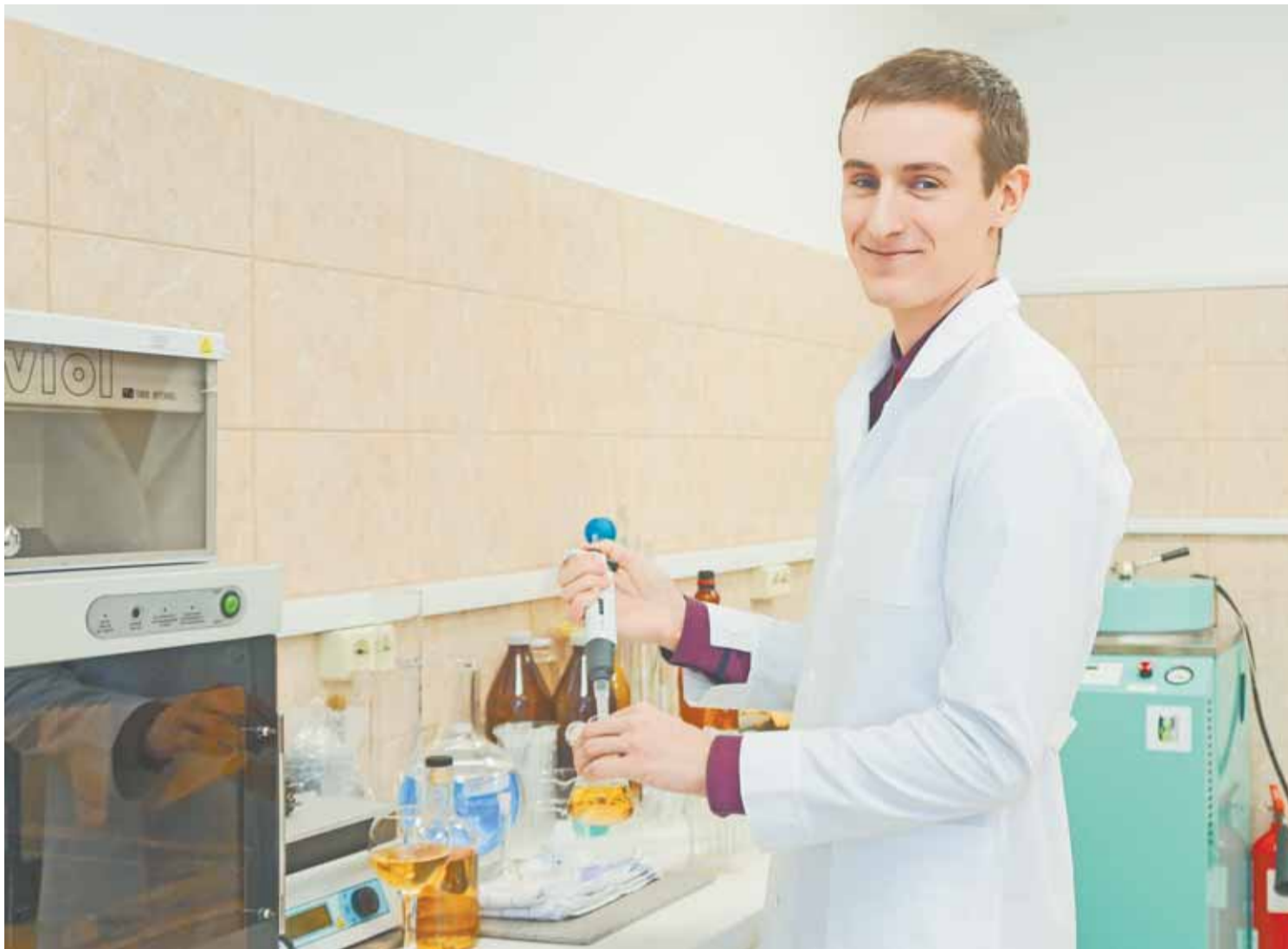
Исследования доказывают: органолептика и физико-химические параметры напитка на высоте.

За последние три года учеными Алтайского технического университета им. И.И. Ползунова получено 86 патентов на изобретения и полезные модели.