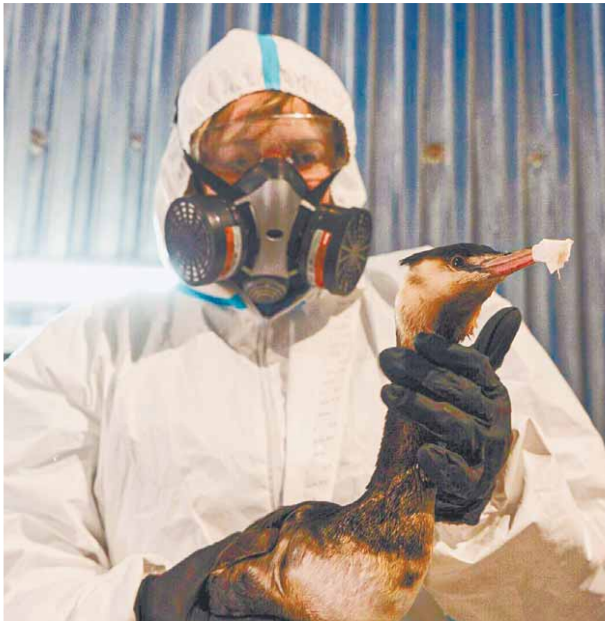
На счету волонтеров – не одна сотня спасенных птичьих жизней.

– Сердце позвало, – говорит она. – Произвели впечатление