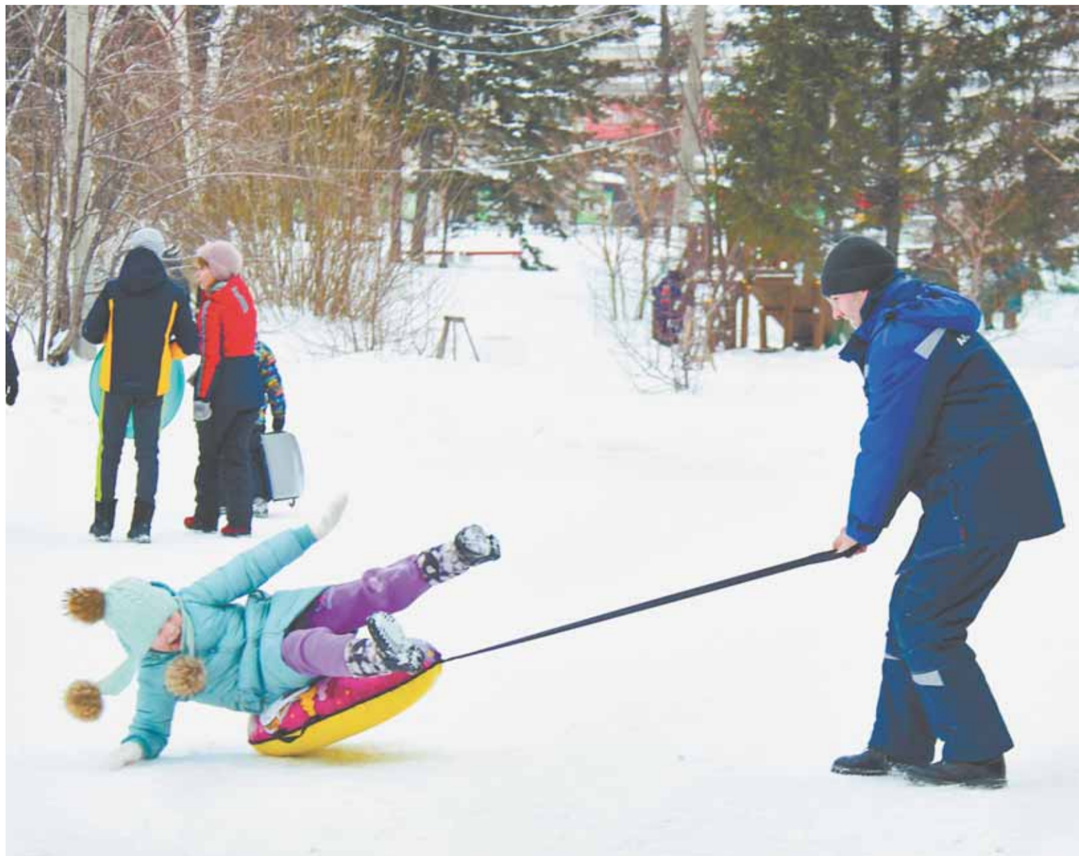
Невинная шалость может привести к серьезным последствиям.