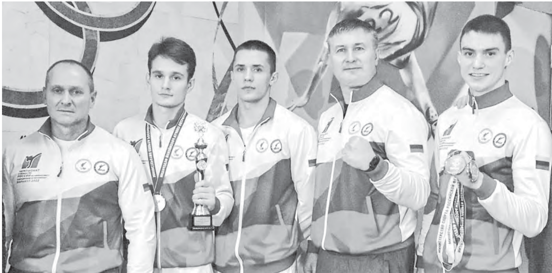
Кикбоксеры региона в новый сезон входят в хорошем настроении.