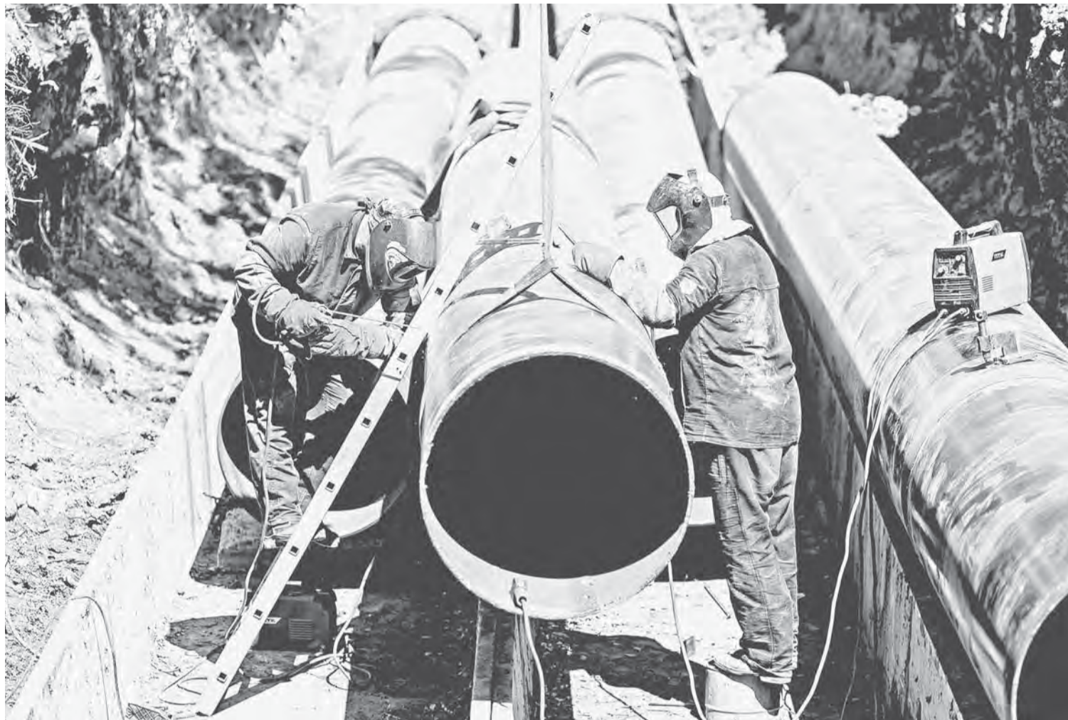
Особое внимание генерирующая компания уделяет плановому ремонту и замене магистральных теплосетей.