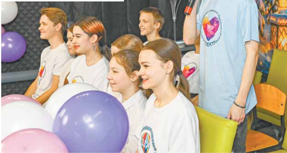
Большинство ребят впервые общались с главным российским Дедом Морозом.