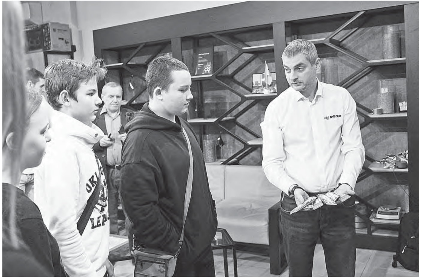
Специалисты рассказали, какие товары до выхода на прилавок проходят через их аппараты.