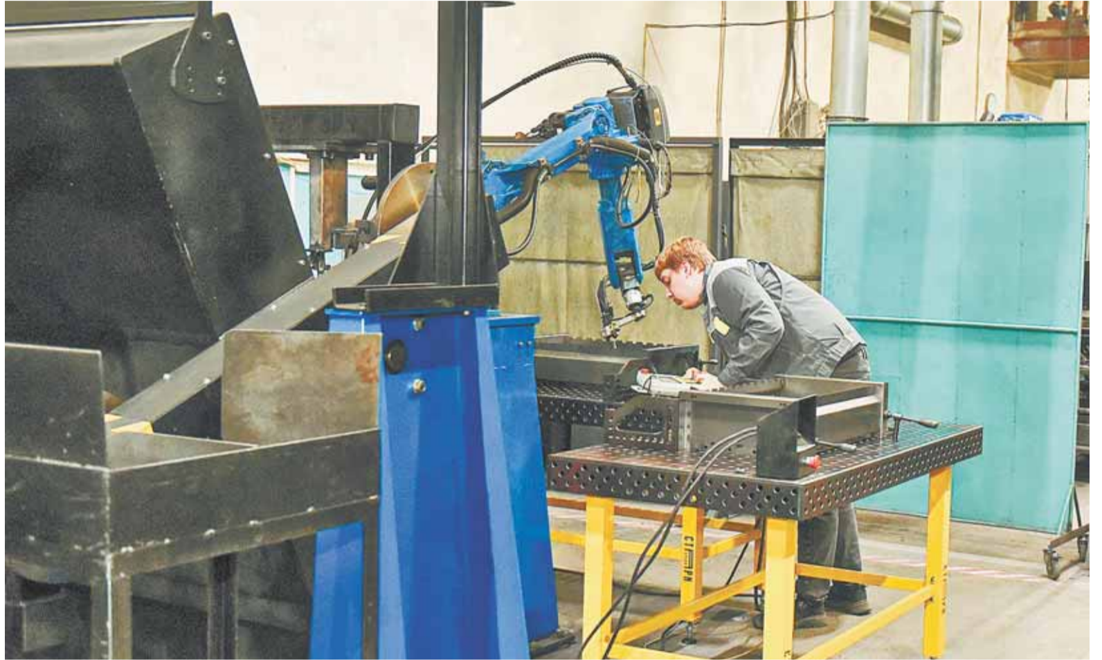
Робот-сварщик способен заменить до трех человек.

Предприятия Барнаула на протяжении последних лет уделяют повышенное внимание автоматизации. Особенно это актуально для производств, где требуется мас-