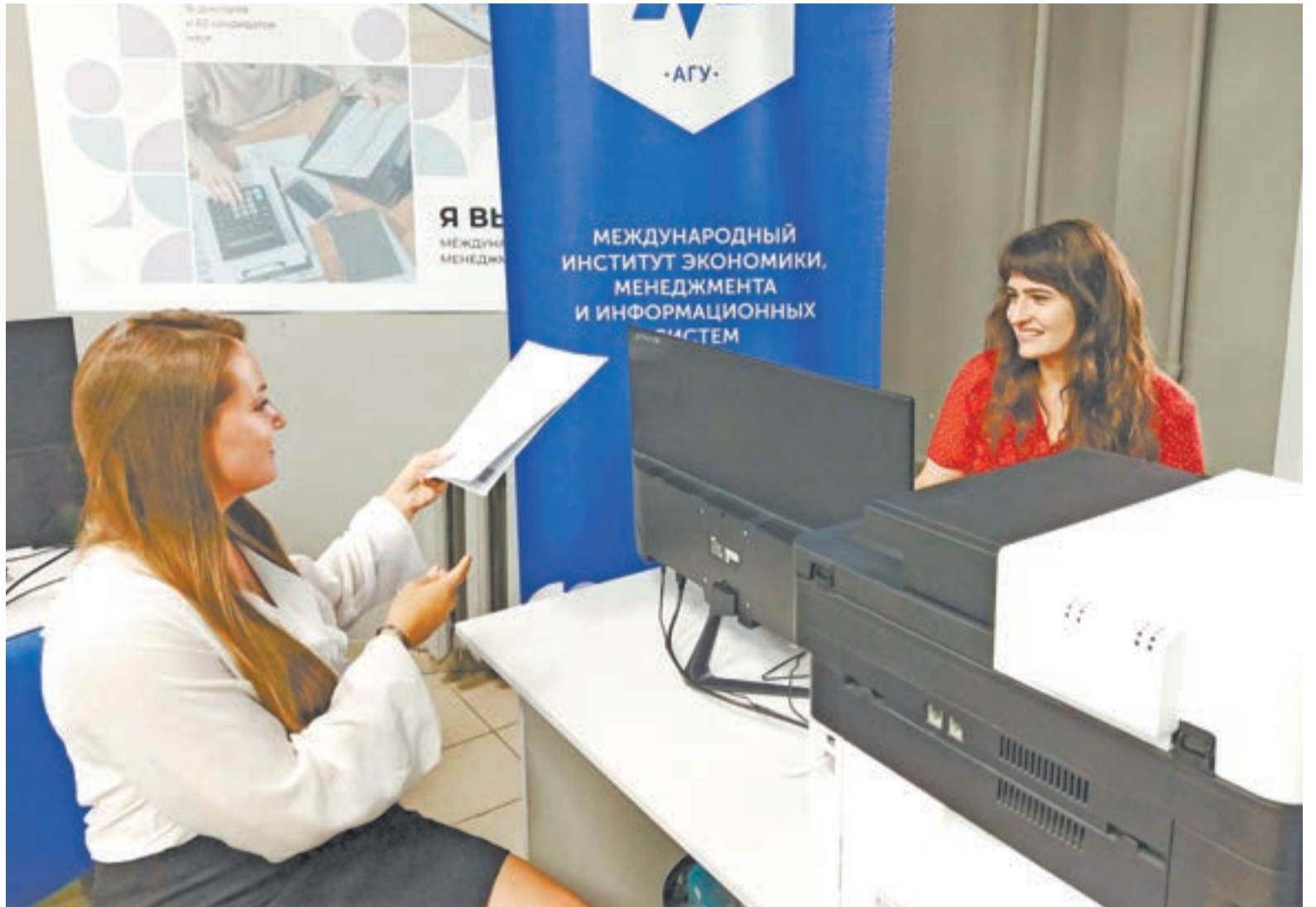
Новые направления и профили подготовки появятся в вузах уже в этом календарном году.

Профиль «Электроснабжение и экономика электроэнергетики» реализуется благодаря запросам компаний, нуждающихся в специалистах, способных решать как технические задачи, так и оптимизировать финансово-экономические показатели энергохозяйства. Учащимся предстоит освоить способы повышения энергоэффективности и управления энергоресурсами, учитывая рыночную экономику.