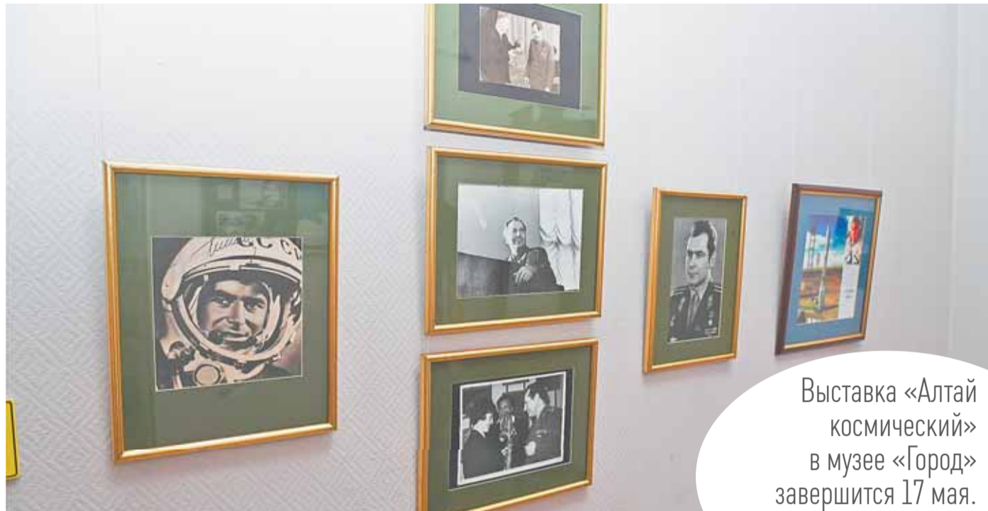
На выставке представлены плакаты, газеты, значки, посвященные важным датам отечественной космонавтики.

Выставка «Алтай космический» в музее «Город» завершится 17 мая.