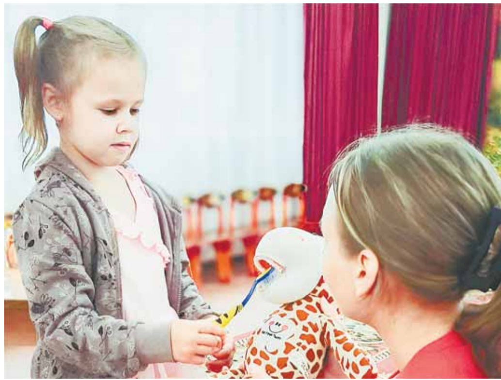
Волонтеры-медики со специалистами детской поликлиники № 9 проводят для детей профилактические занятия, направленные на сохранение здоровья полости рта.

– Дошкольный возраст является важным этапом становления способностей человека. С рождения до семи лет у ребенка закладываются основы здоровья, долголетия, всесторонней двигательной подготовленности и гармоничного физического развития. И мы на базе поликлиники создали обособленное отделение, специалисты которого тесно работают с нашими детскими