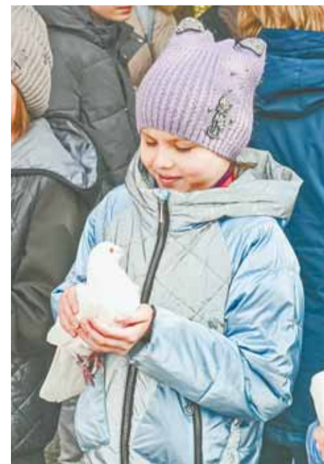
Праздник посетили около 200 человек.