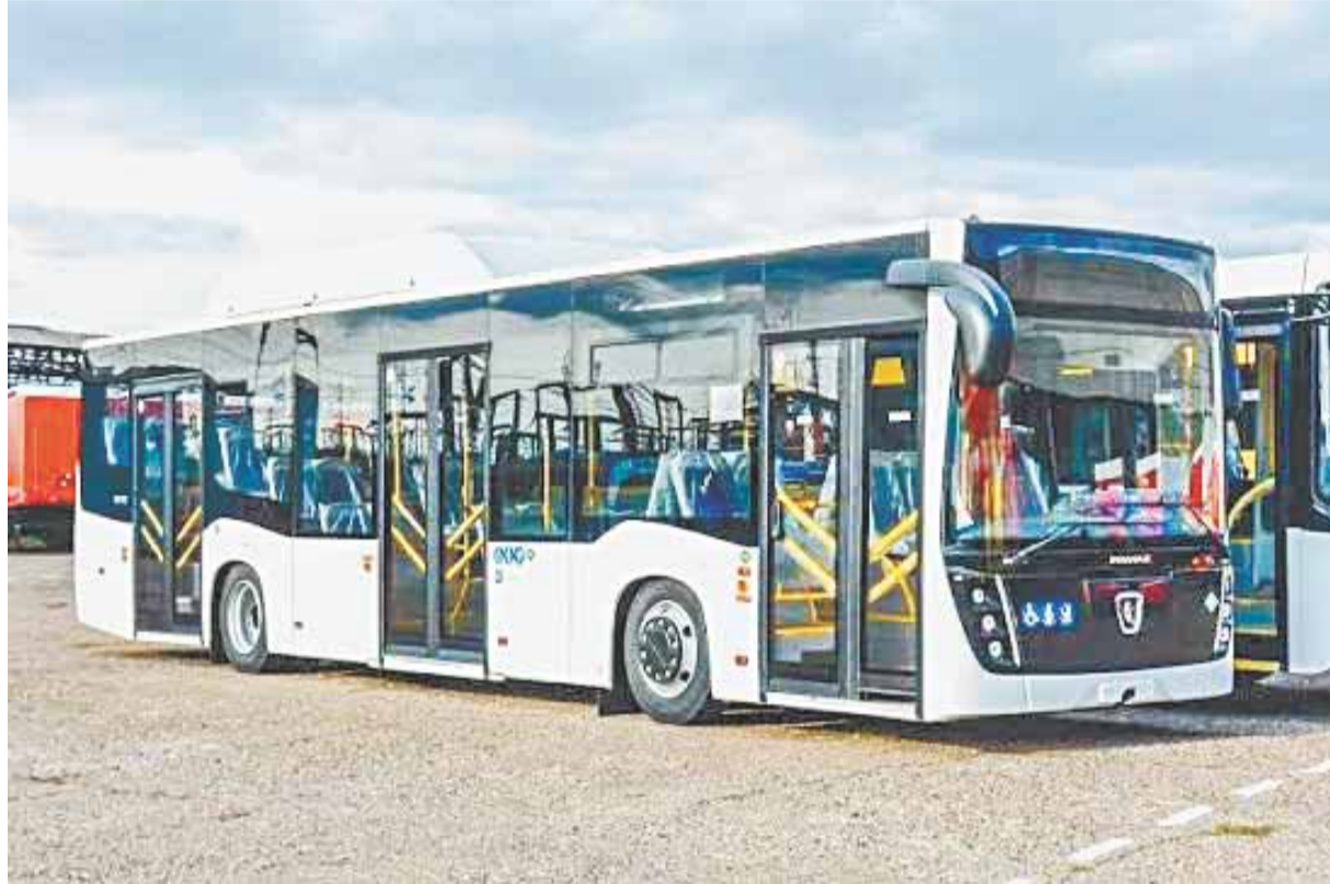
В Барнауле тестируют новый газомоторный автобус НЕФА3 на маршруте №55.