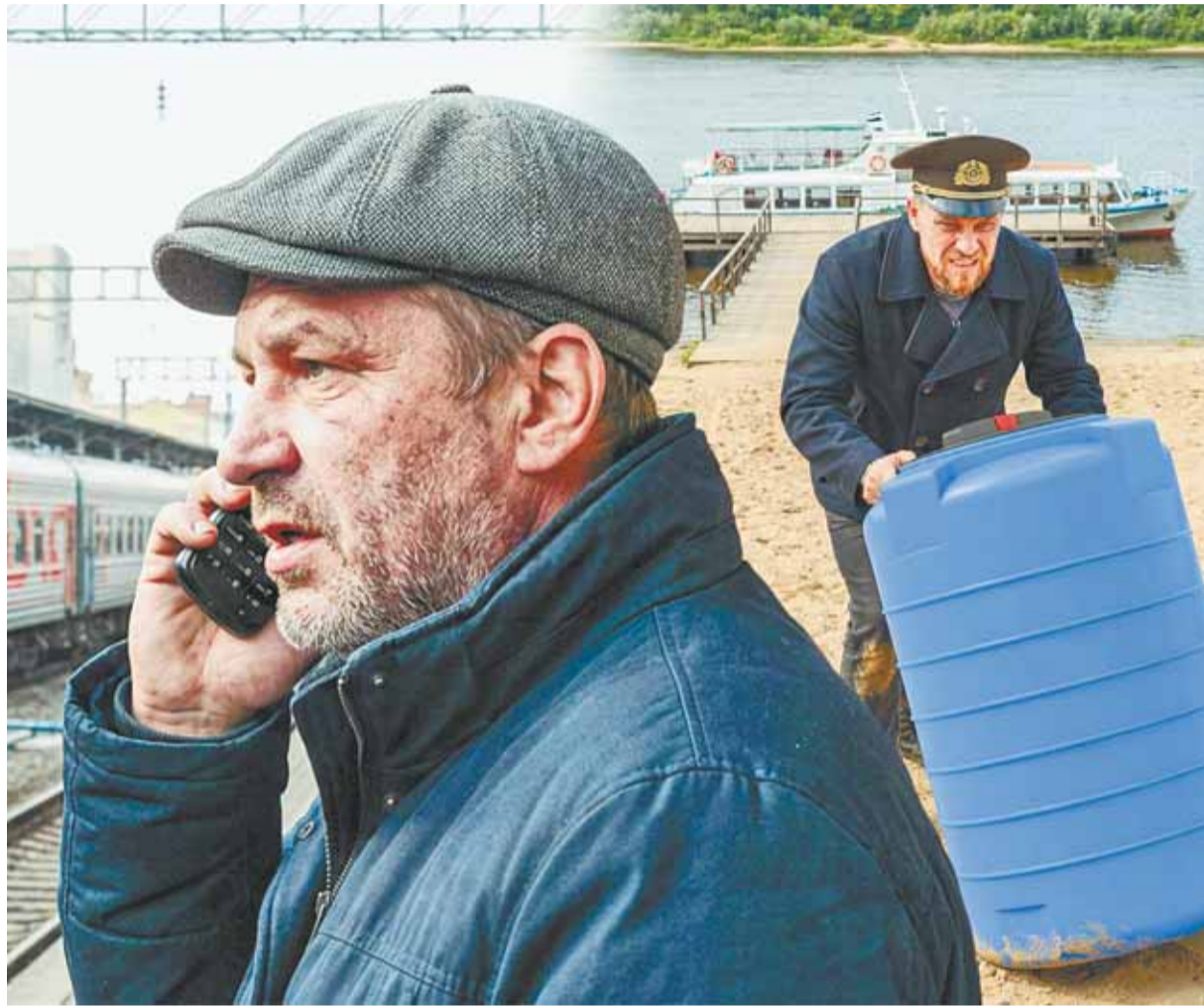
Коллаж Александра ЕРМОЛОВИЧА

– Удивил также круг «клиентов» наркоторговца, среди которых были успешные люди, имеющие семьи, хорошее образование и место работы. В результате слаженной работы следствия и оперативных подразделений удалось пере-