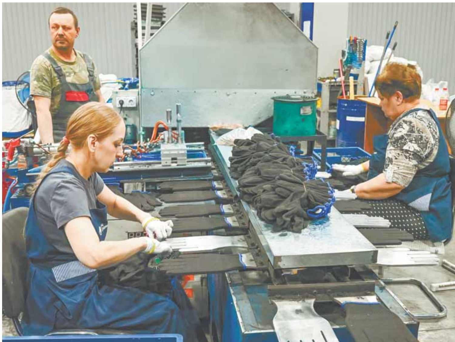
Заседания городской трехсторонней комиссии проводятся ежеквартально, выездной формат таких событий позволяет глубже ознакомиться с условиями труда на барнаульских предприятиях.