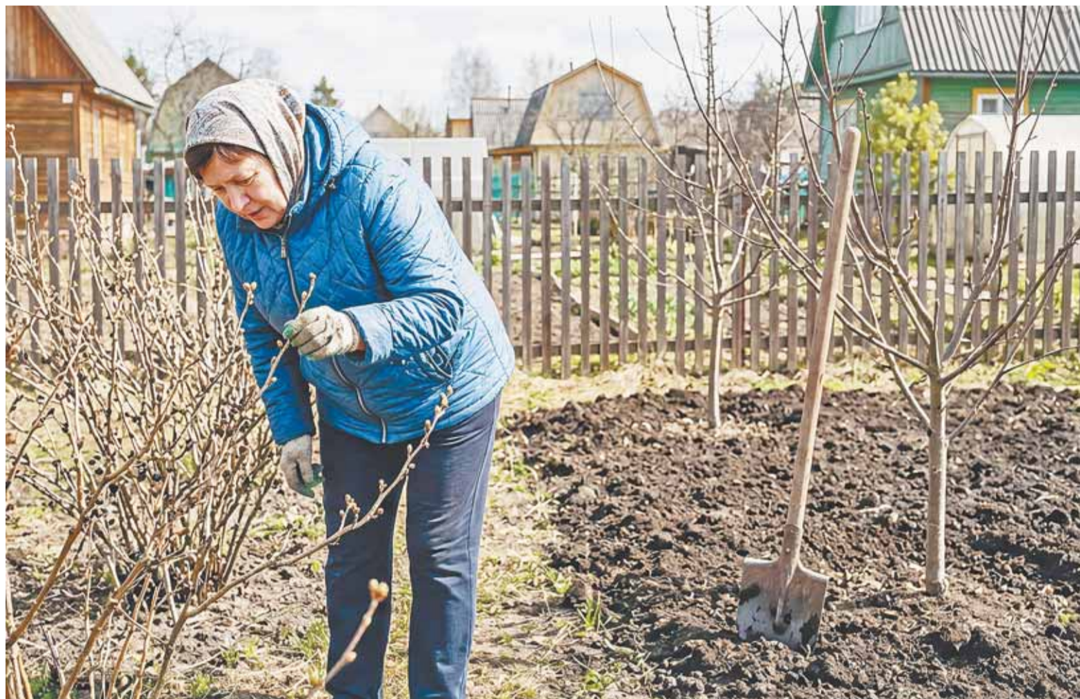
Коллаж Александра ЕРМОЛОВИЧА

Для весенней обработки сада чаще всего используют бордоскую смесь, препараты на основе хлорокиси меди и мочевины.