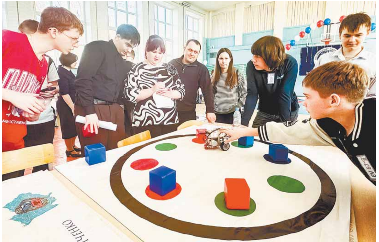
Роботы выполняли разные задания, например, нужно было вытолкнуть кубы из точек.