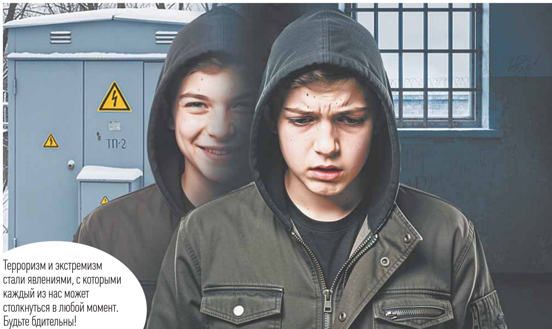
Коллаж Александра ЕРМОЛОВИЧА

Терроризм и экстремизм стали явлениями, с которыми каждый из нас может столкнуться в любой момент. Будьте бдительны!