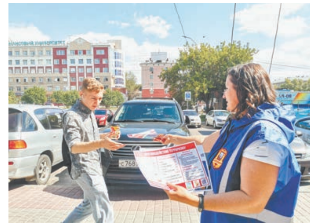
Подготовленные комитетом общественных связей и безопасности администрации города Барнаула листовки по профилактике экстремизма и терроризма распространяют дружинники, сотрудники полиции и специалисты миграционной службы.

Формируем контент для СМИ, социальных сетей и мессенджеров, направленный на социальную профилактику, предупреждение информирование и силовое реагирование.