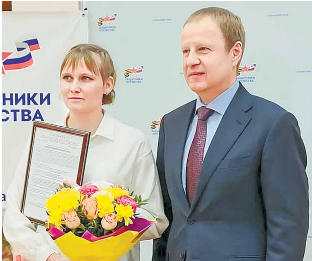
Виктор Томенко поблагодарил военнослужащих и их семьи за службу и защиту страны.

Как отметил губернатор, работа в Алтайском крае по улучшению жилищных условий детей-сирот в последние годы стала более интенсивной. Если раньше помощь оказывалась только в виде предоставления готового жилья, то с 2021 года также выдаются сертификаты на его приобретение. В среднем такую поддержку получают до 600-700 человек в год. Се-