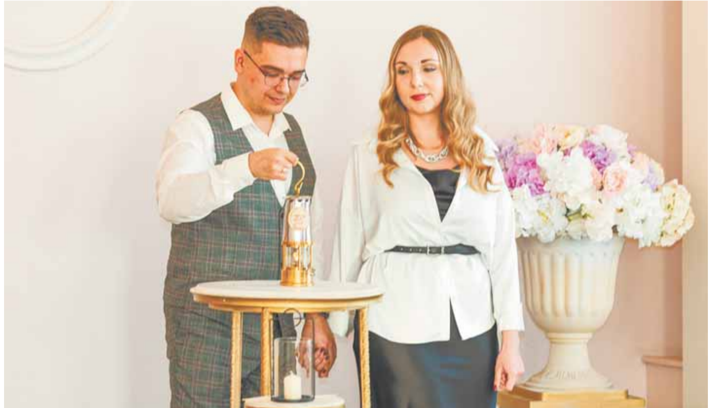
Семья Котовых доставила в Барнаул огонь семейного очага.