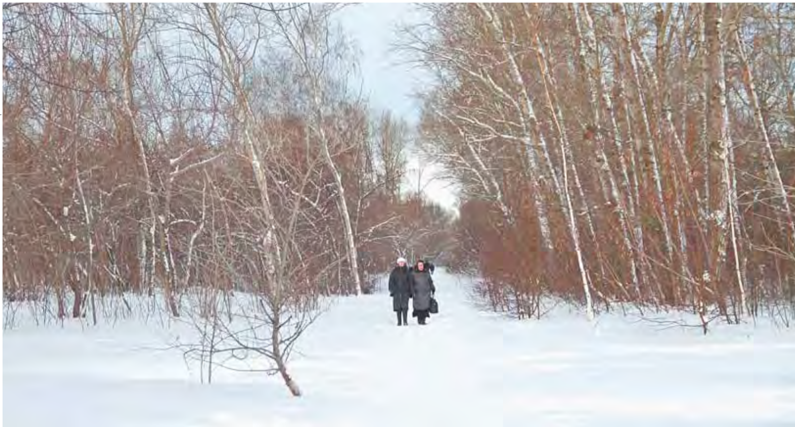
Благоустройство территории парка им. Ленина начнется в этом году.