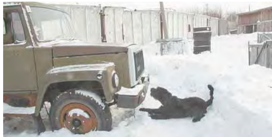
Хорошее настроение – залог успеха любой тренировки.