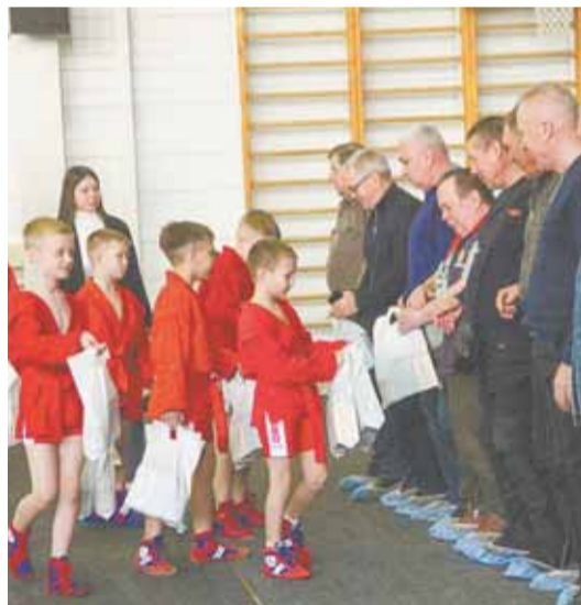
Молодые самбисты в Барнауле не забыли о ветеранах.