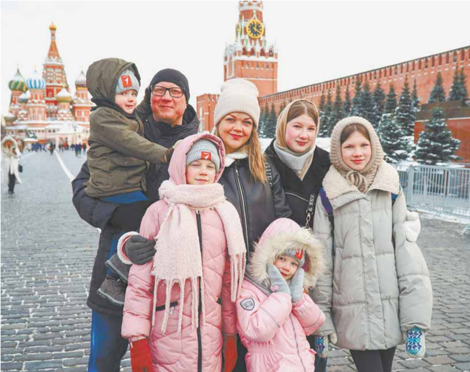
Увидеть зимнюю Москву для дружной семьи было давней мечтой.