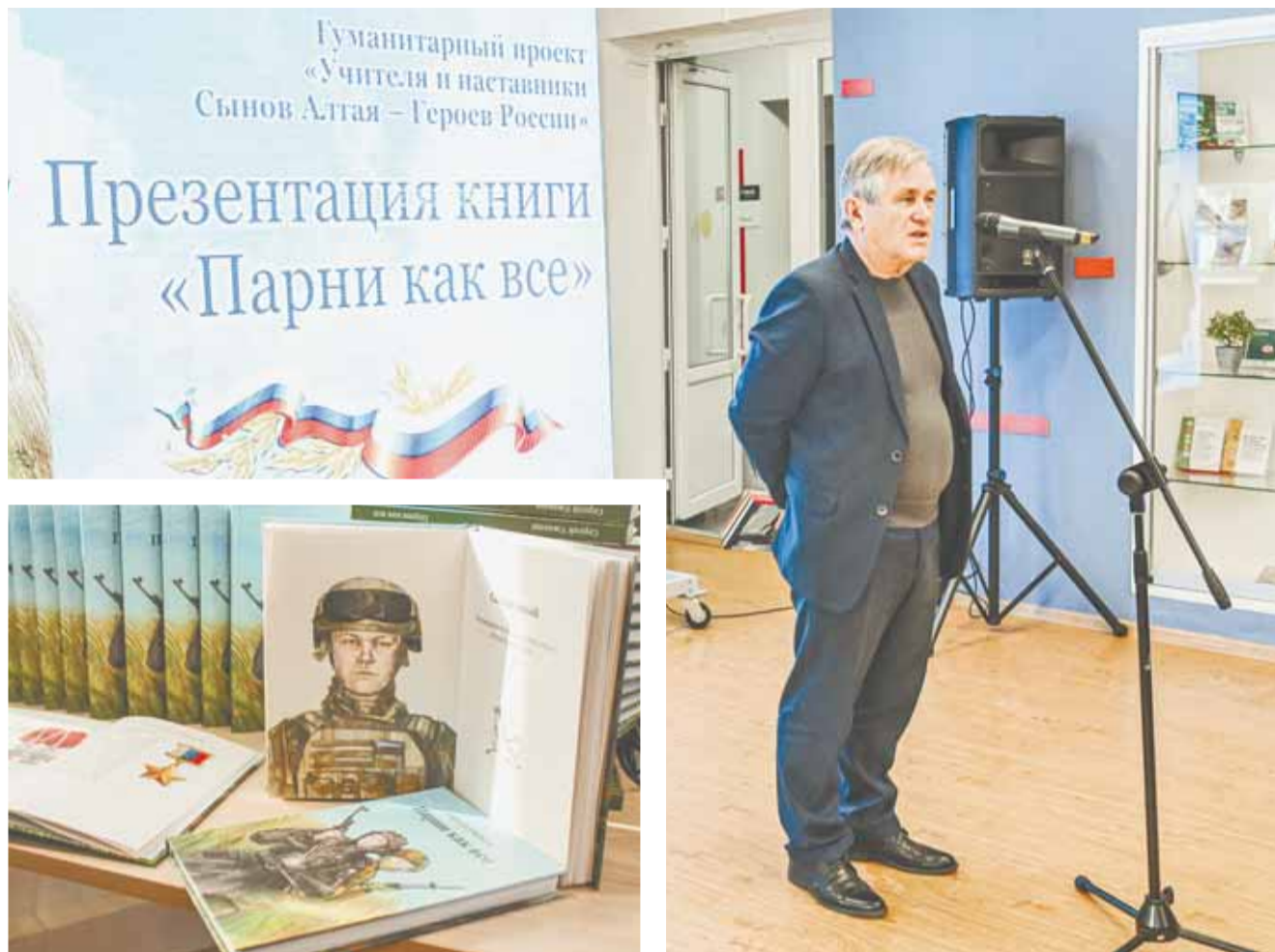
Тираж книги «Парни как все» составляет 400 экземпляров.