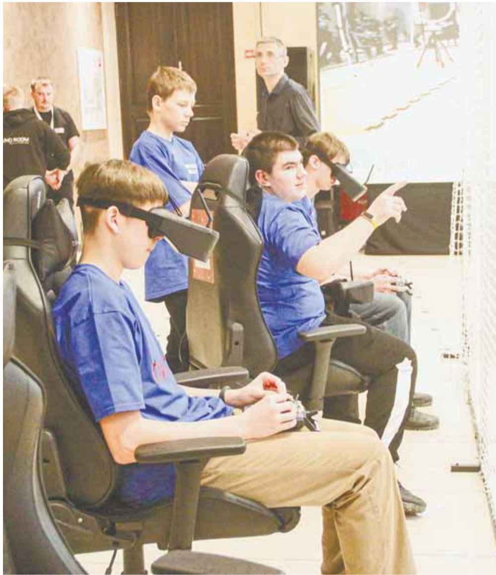
Киберспорт завоевывает все большую аудиторию.

Соревнования проходили по следующей системе. Восемь участников разделили на две группы. Сначала одна четверка выполняла полет на компьютерном симуляторе, вторая в это время, управляя реальными дронами, проходила трассу. Под нее в фойе огородили приличных размеров угол, пространство которого насытили кольцами на разной высоте. Вот сквозь них-то и должны были провести свои летательные аппараты участники. Подведя итоги полетов на симуляторе, судьи отобрали