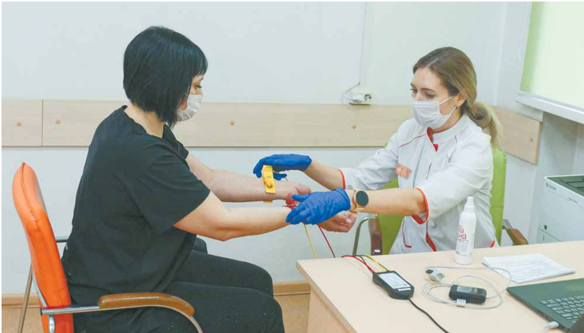
В программу профосмотра входит обследование на кардиовизоре.