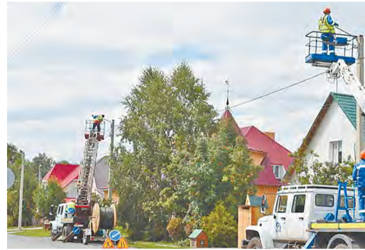
При участии ТОС в программе инициативного бюджетирования за 2022–2024 годы в Барнауле реализовали 80 проектов: асфальтирование дорог, устройство линии наружного освещения, обустройство

В юбилейном для органов ТОС краевой столицы 2024 году барнаульские общественники реализовали рекордное количество инициатив жителей и были отмечены наградами на краевом и федеральном уровнях.