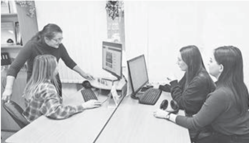
Корреспонденты, дизайнеры, сотрудники сайта и других отделов редакции помогают барнаульцам быть в курсе всех городских событий.