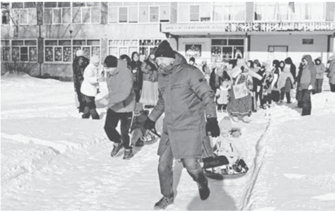
В зимних забавах активно участвовали родители вместе с детьми.