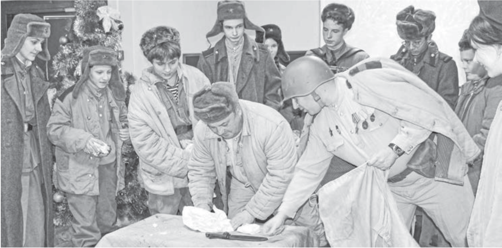
«Новый год на фронте» планируют показывать в школах и библиотеках края.

В репертуаре школьного музея появился спектакль о войне на основе реальных историй