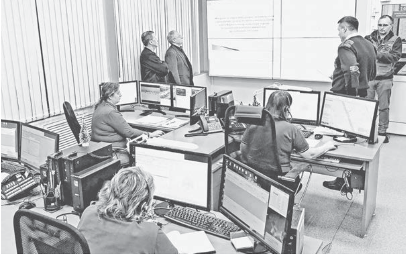
В среднем в сутки ЕДДС принимает и организует реагирование на 200 обращений барнаульцев, служба работает круглосуточно.