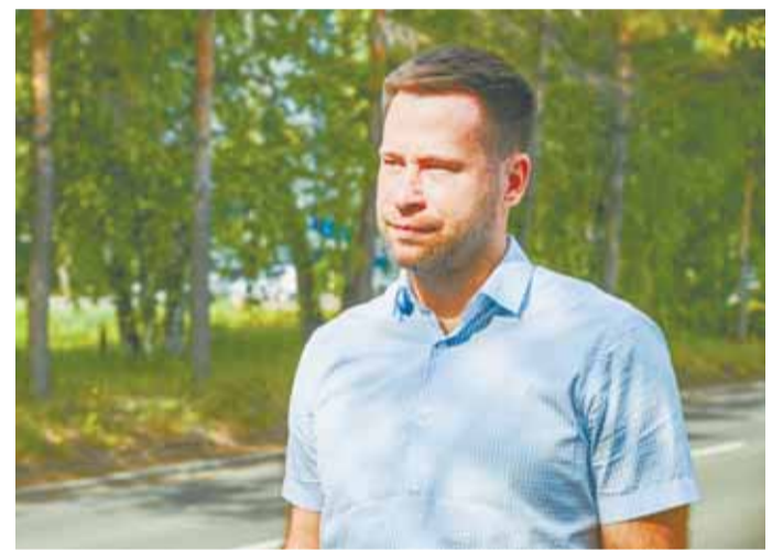
Первые дороги, отремонтированные в этом году в рамках нацпроекта, сданы досрочно и качественно.