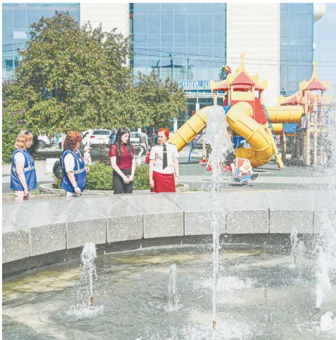
В ходе рейда специалисты напомнили сотрудникам, чем чревато купание в фонтанах.

14 фонтанов сегодня работают в краевой столице.