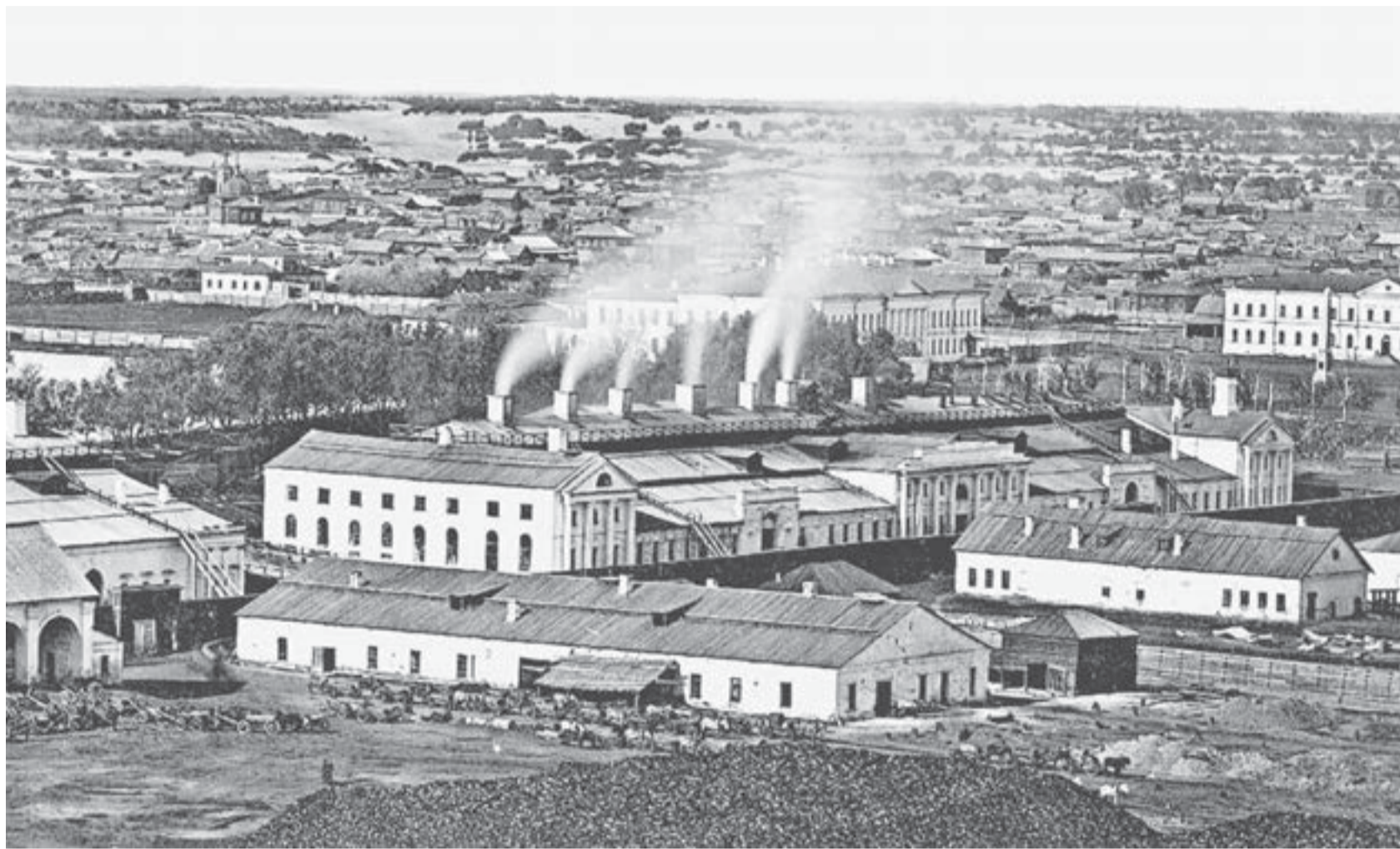
Теплоходная экскурсия Виталия Ведерникова сопровождалась архивными фотографиями и документами.

Барнаульский медеплавильный завод начали строить в устье Барнаулки в 1739