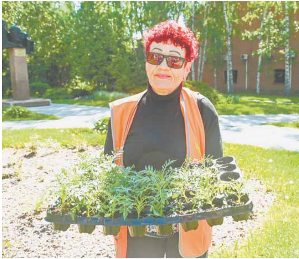
К концу июня высаженные однолетники будут радовать горожан пышным цветением.

Участки для посадки заранее готовит бригада озеленителей, там, где пространство позволяет развернуться, землю вспахивают мотоблоком, где одновременно с однолетниками растут и многолетние