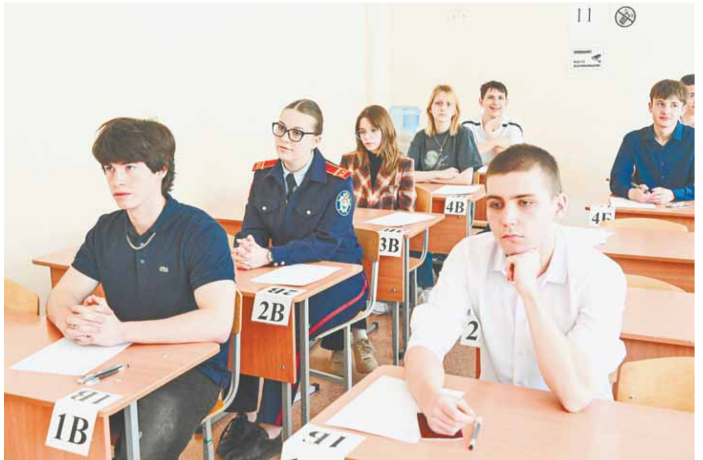
К моменту сдачи экзаменов ребята готовились не один месяц.