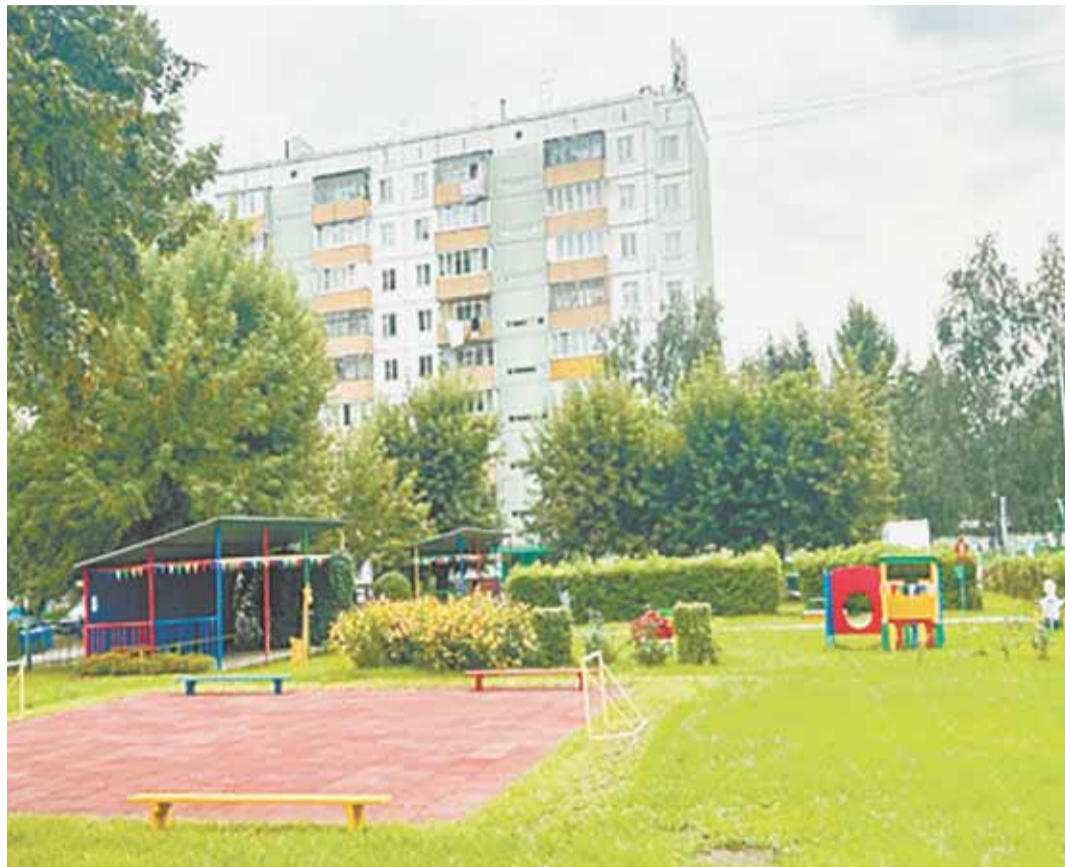
В премии «Служение» принимают участие инициативы барнаульских ТОС, направленные на поддержку участников СВО и на благоустройство территорий.