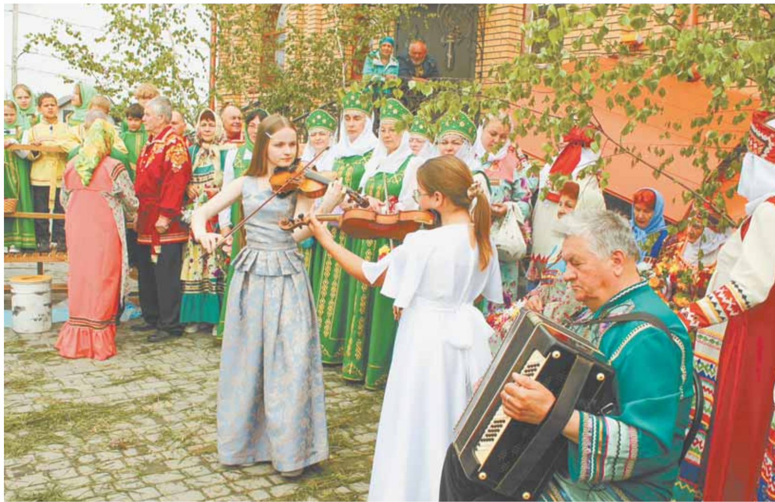
В рамках праздничного концерта звучали песни и музыкальные произведения, исполненные на скрипке юными прихожанками.