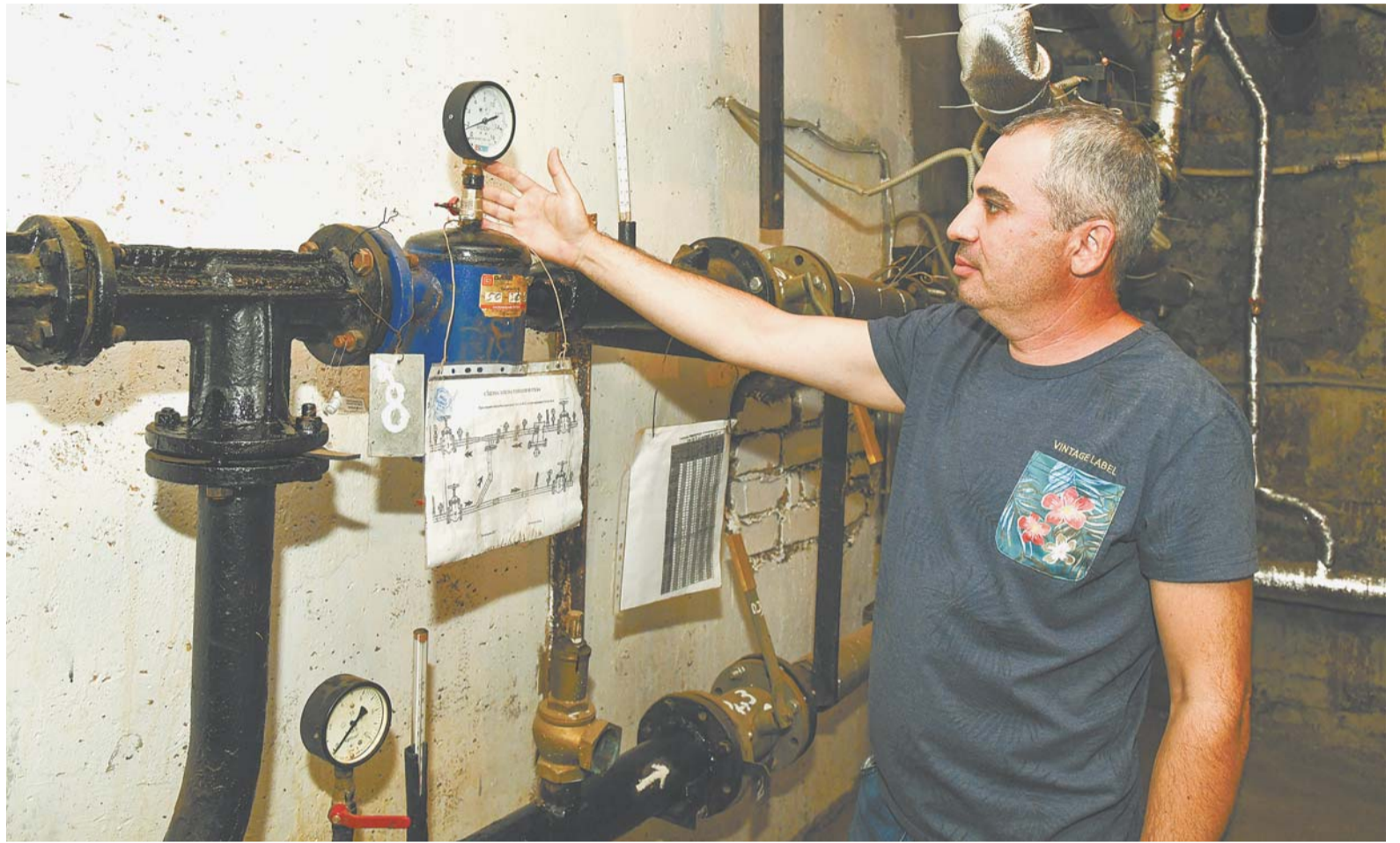
Инженерное оборудование в элеваторном узле даже в доме возрастом 50+ должно выглядеть как в новостройке.

За 5 месяцев 2022 года наши специалисты выполнили работы по ремонту и строительству сетей водоснабжения и водоотведения общей протяженностью 3,2 км, что составляет 42% от годового