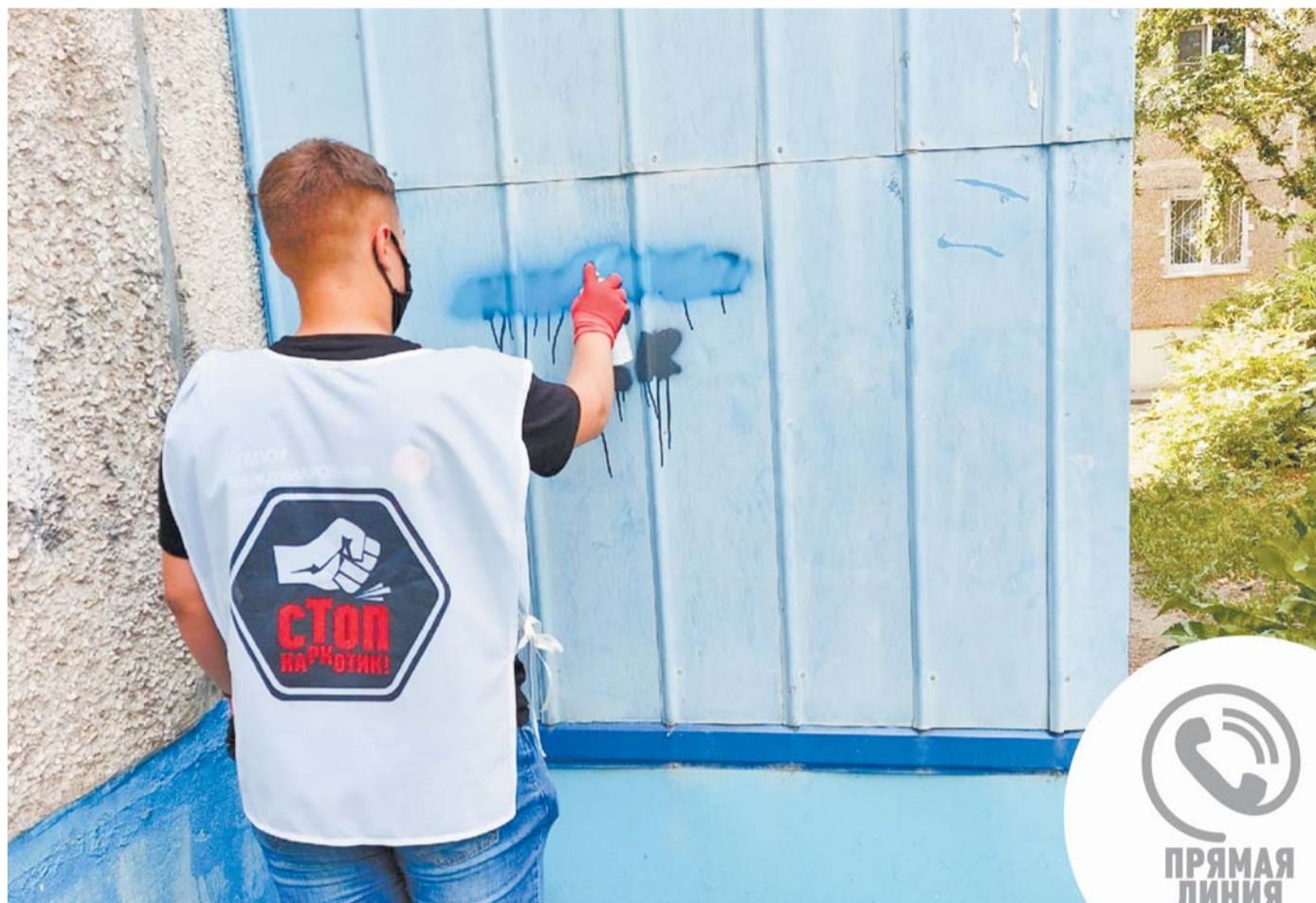
Волонтеры в рамках акции «Стоп-наркотик» закрашивают незаконные надписи.