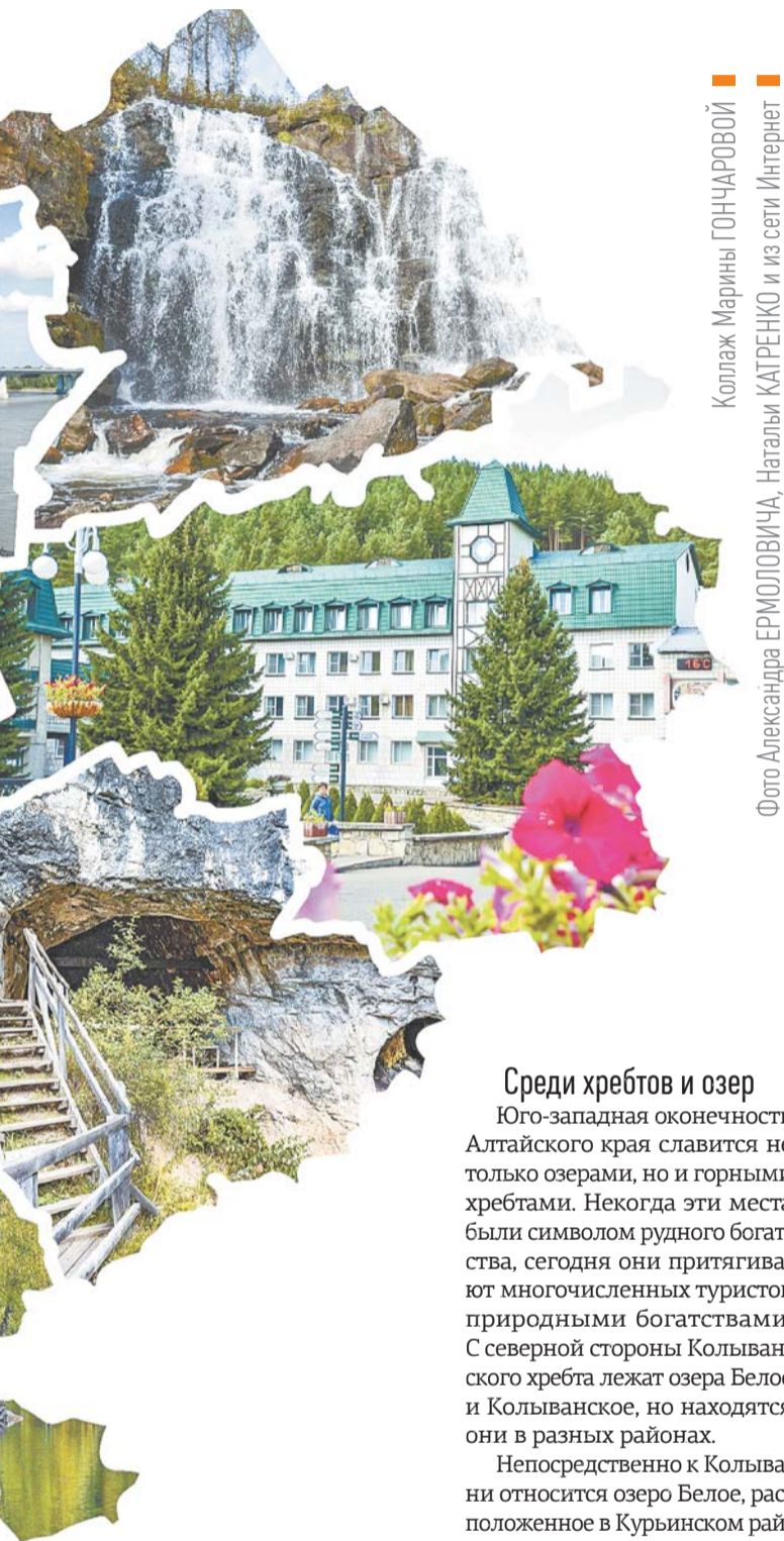
Коллаж Марины ГОНЧАРОВОЙ Фото Александра ЕРМОЛОВИЧА, Натальи КАТRENKO и из сети Интернет