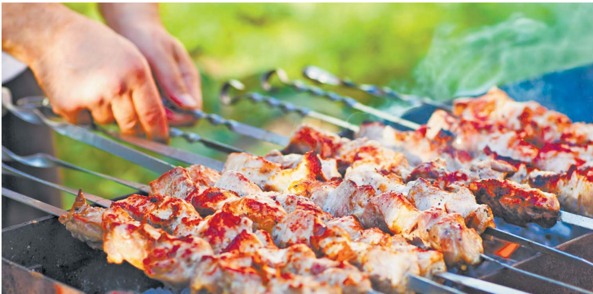
Главное блюдо дачного отдыха - шашлык.