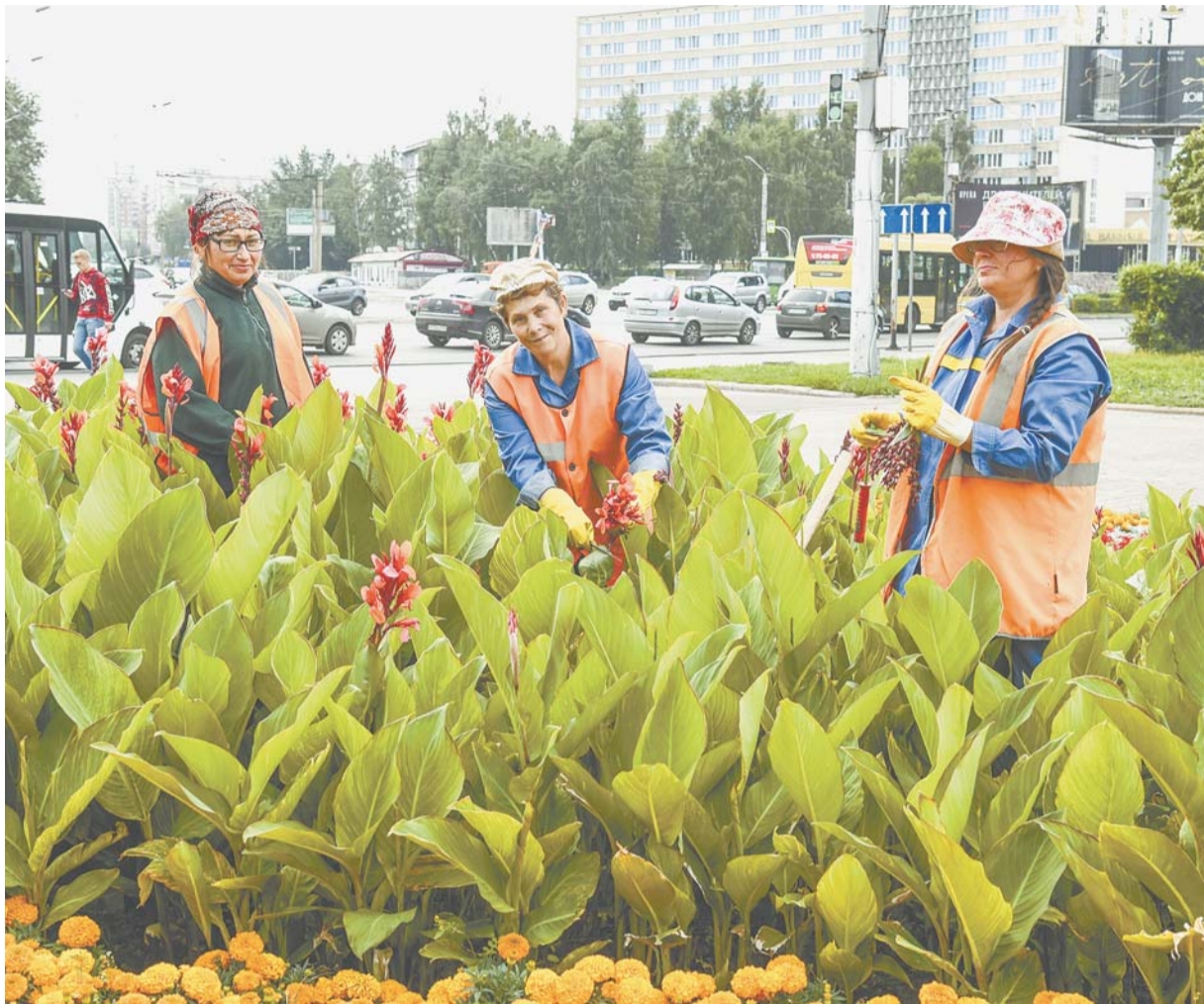
Помочь сделать город красивым может любой желающий.