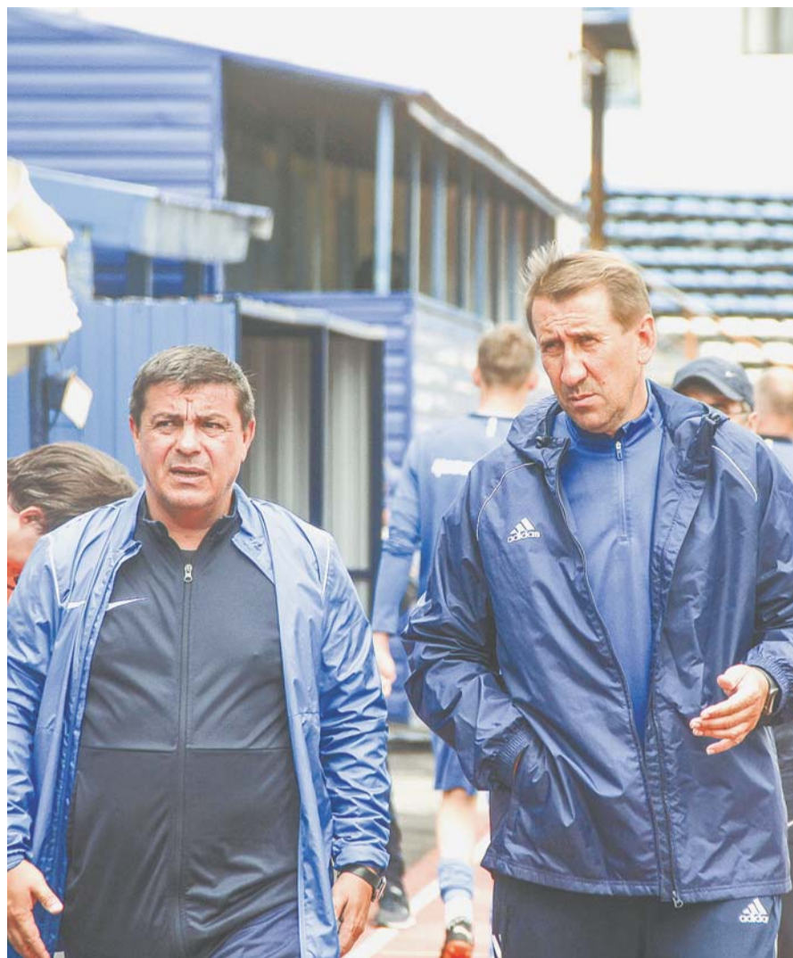
Игра с «Новосибирском» дала возможность тренерам увидеть новичков в деле.