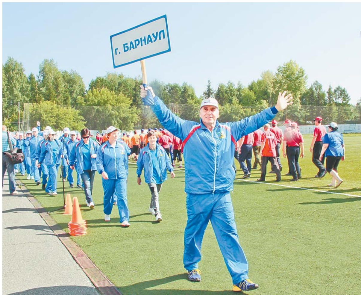
Барнаулская команда – многолетний победитель краевой спартакиады пенсионеров.

Первая спартакиада, пусть и проведенная с организационными недочетами, стала для людей старшего поколения настоящим прорывом. Нет бас-