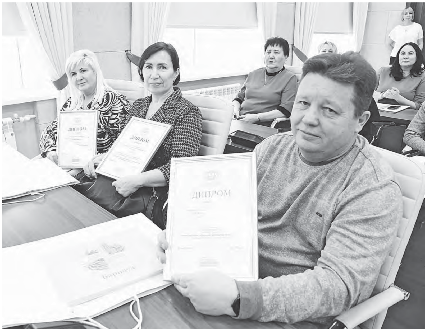
Победители творческого состязания получили дипломы и подарочные альбомы.

В этом году количество номинаций выросло с 13 до 22, так как число участников конкурса за лучшее новогоднее оформление существенно увеличилось.