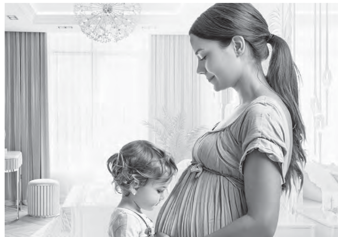
Коллаж Александра ЕРМОЛОВИЧА

Компенсация при рождении первого ребенка предоставляется до исполнения ему трех лет. Сумма этой соцподдержки – не менее 50% фактических расходов по договору найма, но не более предельной величины компенсации (для семей с одним ребенком этот предел в 2025 году составляет 6990,48 руб. ежемесячно). Компенсация при рождении второго и последующих детей, пока младшему не исполнилось три года, предоставляется в размере 75% фактических расходов по договору найма, также не более предельной величины