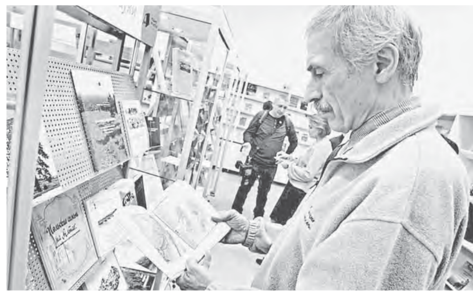
В этом году выйдут в свет как юбилейные издания, так и стихотворные сборники.