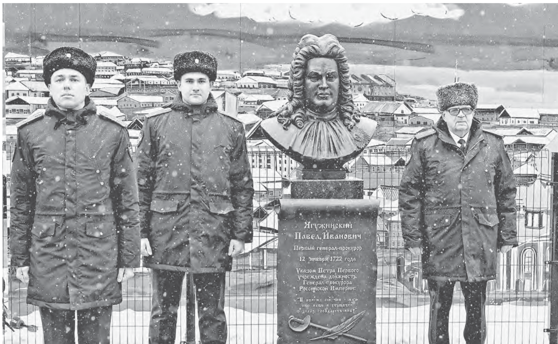
Первый генерал-прокурор России Павел Ягужинский внес значительный вклад в развитие страны.