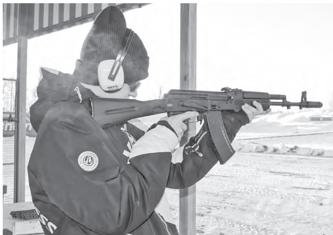
Для многих ребят это был первый опыт огневой подготовки.

Наша задача – охватить как можно больше будущих призывников и проверить их уровень подготовки, поэтому к соревнованиям приглашены только учащиеся десятых классов, – отметил представитель судейского корпуса, заместитель