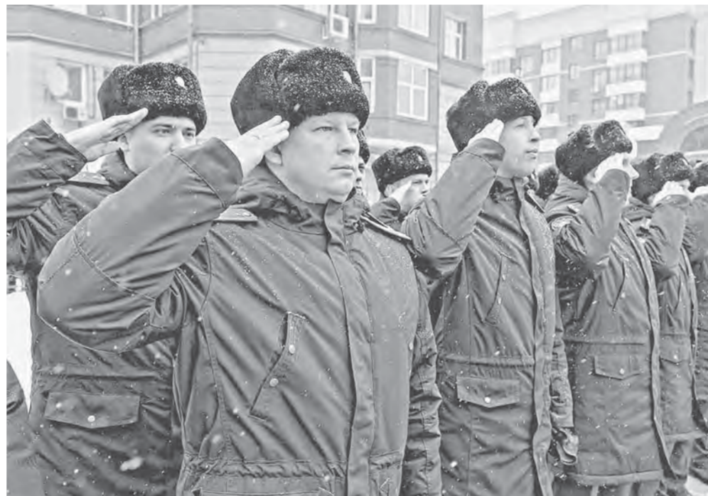
И сегодня работники прокуратуры достойно памяти своих предшественников защищают права и законные интересы граждан.

7 мая 1724 года заслуги П.И. Ягужинского оценены высшей государственной наградой – орденом Святого Андрея Первозванного.