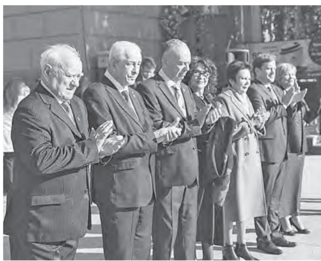
На открытии памятного знака присутствовали почетные профессора АГМУ.

Символично, что памятный знак установлен в год 70-летия медицинского вуза, которому суждено было сыграть ключевую роль в жизни нашего региона и вывести алтайское здравоохранение на совершенно новый качественный уровень. В 1954 году первый профессорско-преподавательский состав