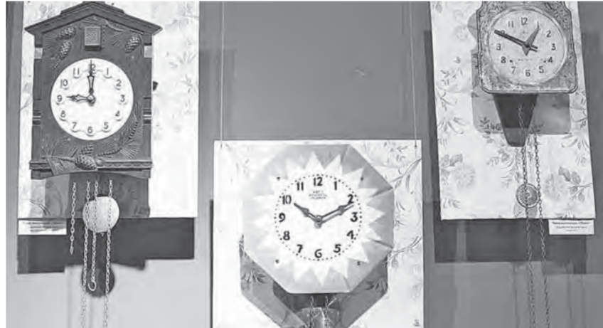
Увидеть необычную экспозицию можно до 6 октября по адресу: ул. Льва Толстого, 2.

Кроме того, эволюцию часов можно проследить на выставке по продукции заводов, расположенных в Минске, Владимире,