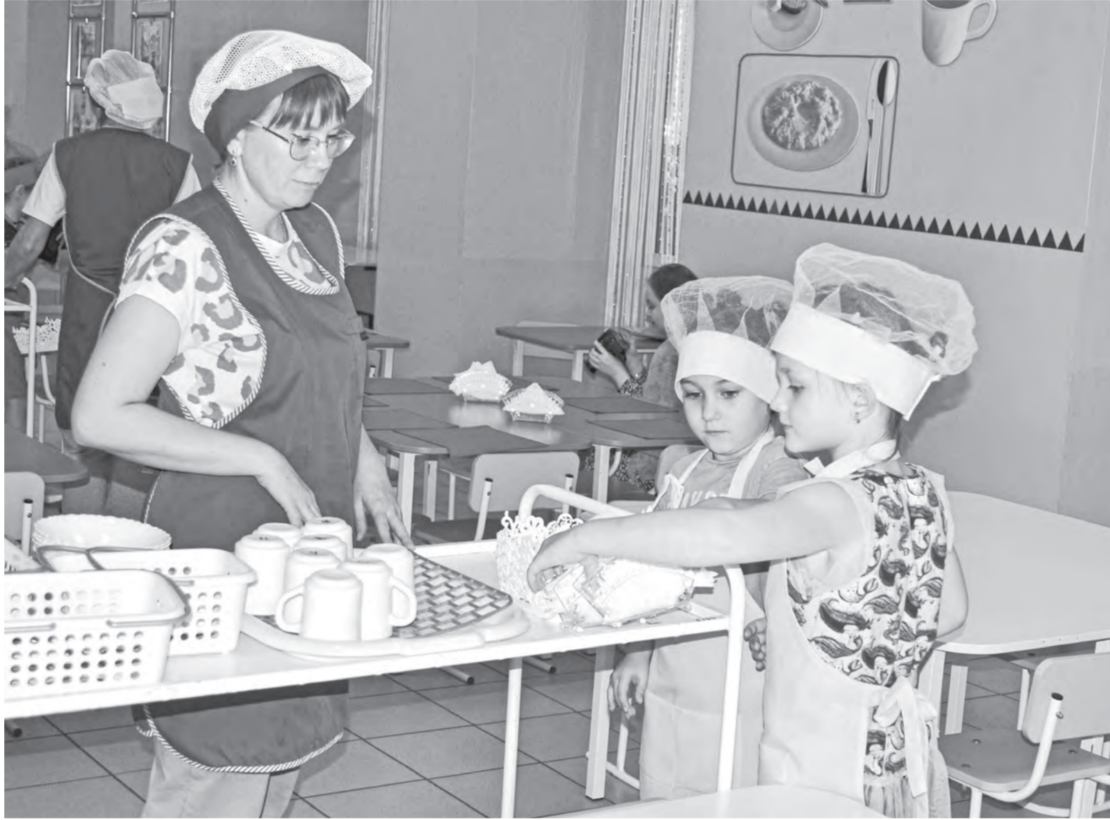
Старшие ребята в детском саду накрывают на столы, обучая культуре питания.