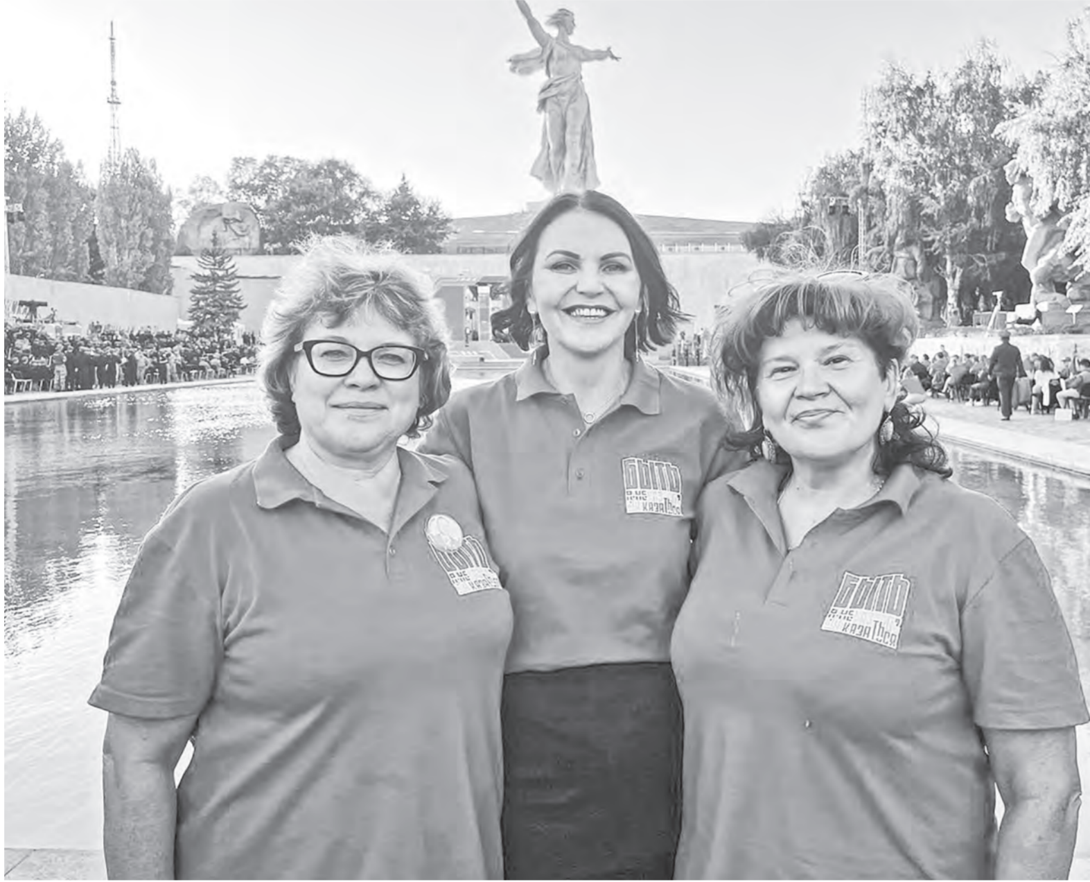
С конкурса победители привезли много идей, которые планируют внедрить в свою практику.

Сами тоже делились опытом. В частности, в качестве направления для мастер-класса