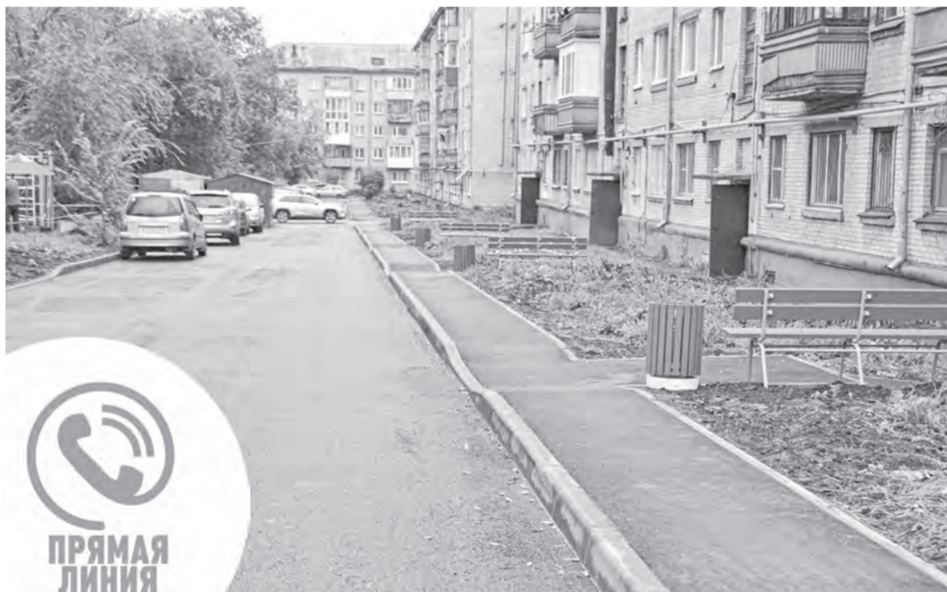
Асфальтирование дворовых проездов, установка урн, лавочек входят в минимальный перечень благоустройства, бесплатный для жителей дома, вошедшего в проект.

– Действительно, в 2024 году из 39 территорий по городу 17 дворовых территорий благоустроят именно в Октябрьском районе. Дворы благоустроят в микрорайонах ВРЗ, Поток, Центр, Западный и Тимуровский. В настоящее время работы полностью завершены по адресам: пр. Ленина, 54; ул. Водопроводная, 103, 105; ул. 80 Гвардейской Дивизии, 26, 40, 42, 64, 66; ул. 4-я Западная, 78; ул. Германа Титова, 10. 17 сентября начались работы на ул. Эмилии Алексеевой, 46, а в