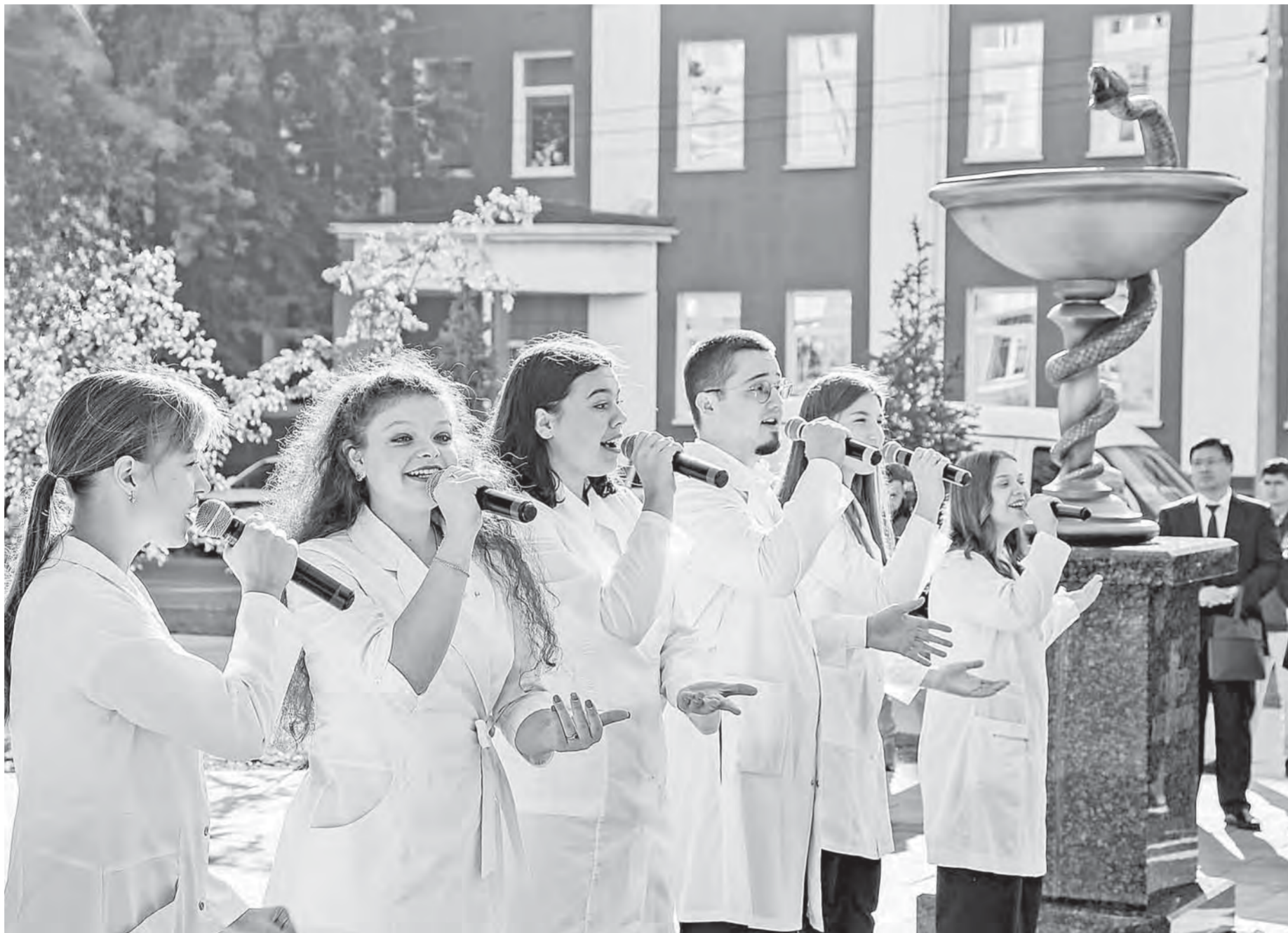
Новый сквер станет местом силы студентов-медиков всех поколений.