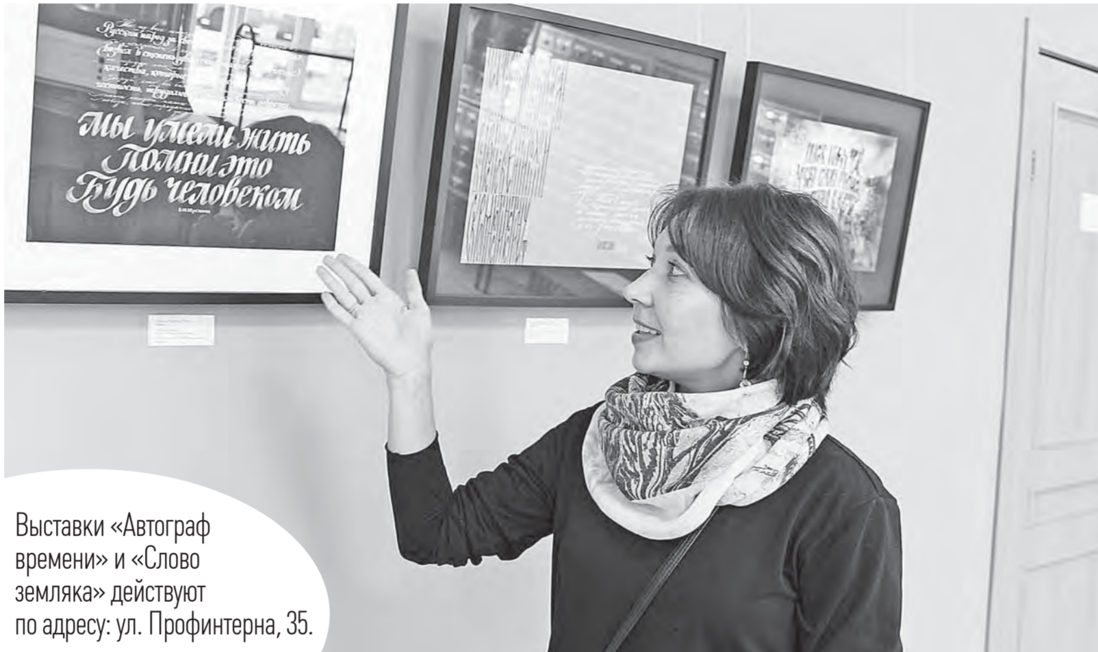
Выставки «Автограф времени» и «Слово земляка» действуют по адресу: ул. Профинтерна, 35.