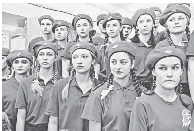
Юнармейцы гимназии № 5 чтут память о подвиге героя и равняются на него.

За три месяца исполнения интернационального долга в Афганистане Константин Павлюков совершил 70 боевых вылетов. Вечером 21 января 1987 года во время взлета его самолет был сбит ракетой. Летчик на земле почти час вел бой с окружившими его бандами. Когда кончились боеприпасы, подорвал себя и подошедших врагов гранатой. Указом Президиума Верховного Совета СССР от 28 сентября 1987 года ему посмертно присвоено звание Героя Советского Союза.