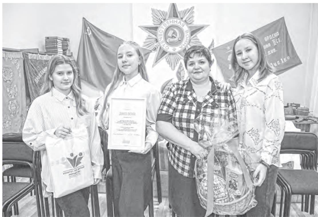
Волонтеров наградили дипломами и памятными подарками.

Прежде чем назвать их имена, для ребят организовали экскурсию по Нагорному парку.