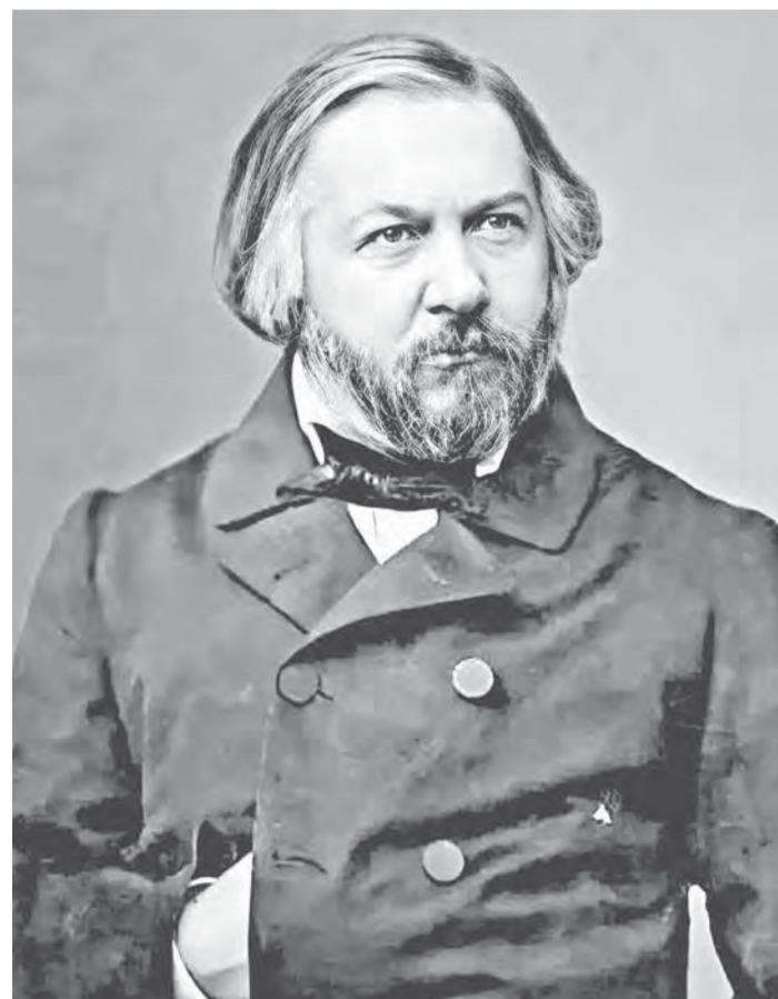
Михаил Глинка заложил основы русской музыки.