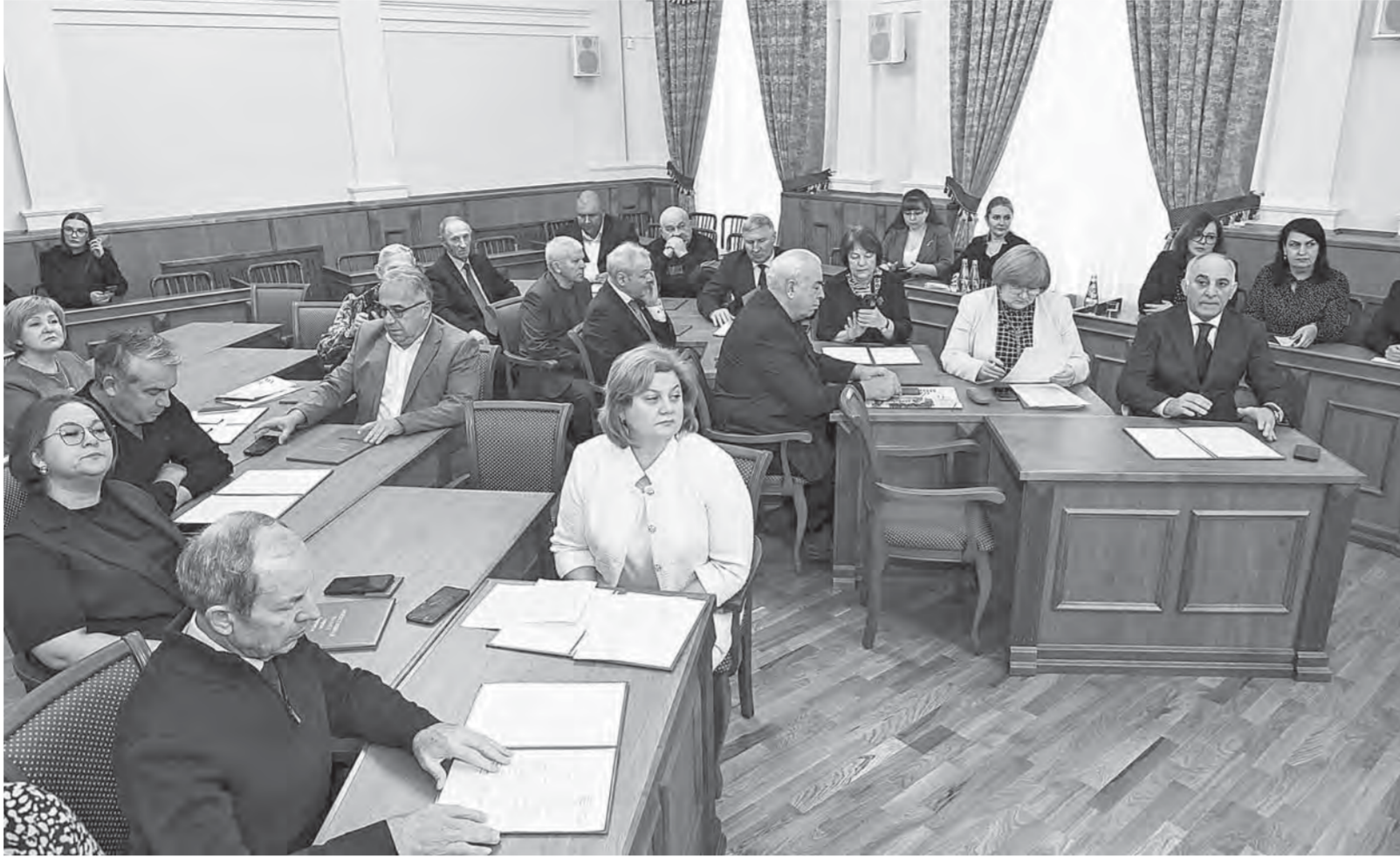
Общественная палата города Барнаула пользуется заслуженным авторитетом у власти и населения краевой столицы.

С информацией о ключевых социально-экономических показателях и перспективах