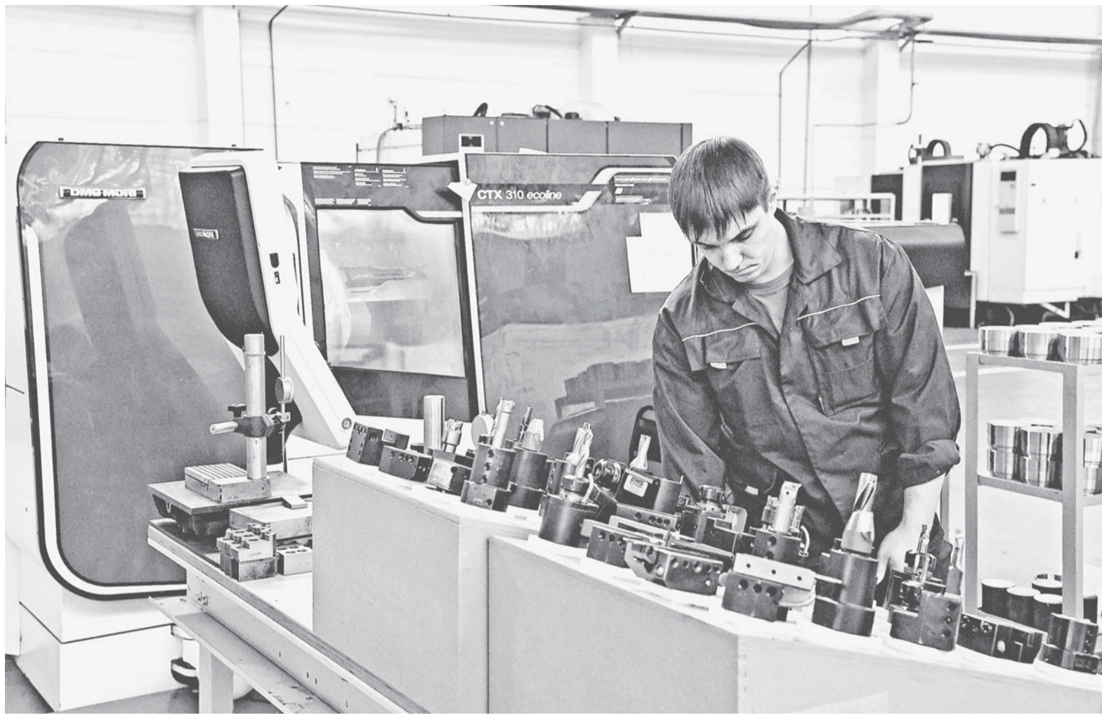
Специалисты АПЗ «Ротор» проходят переквалификацию на базе Алтайского политехнического техникума.

В числе партнеров техникума есть и крупные промышленные предприятия. В частности, Алтайский приборостроительный завод «Ротор». В будущем образовательные программы будут согласовываться с его представителями.