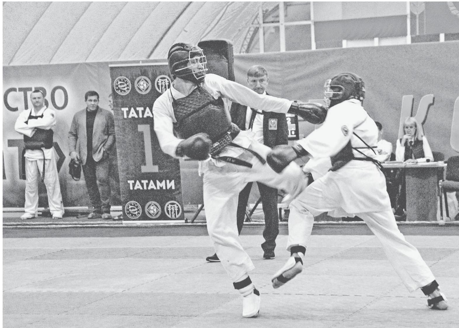
В Сибири алтайские кобудисты – законодатели мод.

По итогам и первенства, и чемпионата СФО победу в общекомандном зачете одержали представители Алтайского края.