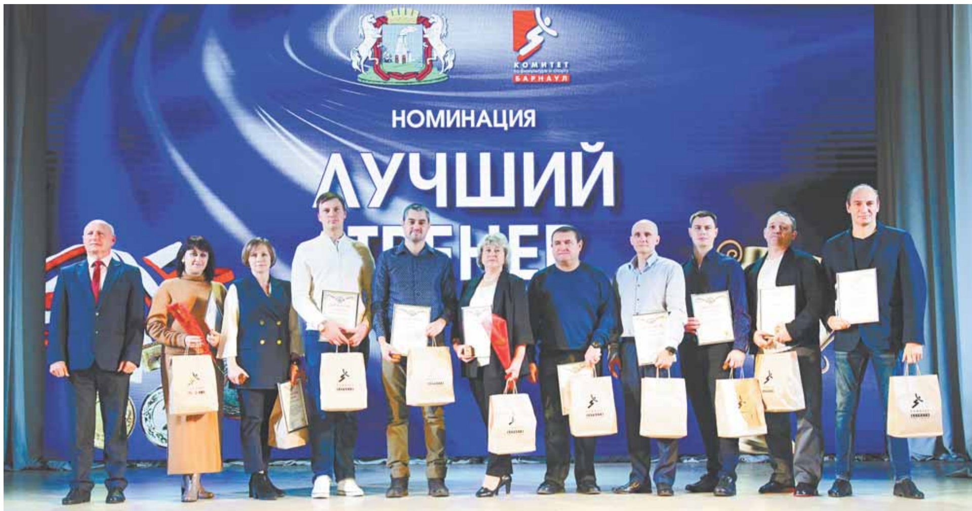
Помимо дипломов наставники получили нагрудный знак «Лучший тренер Барнаула – 2024».