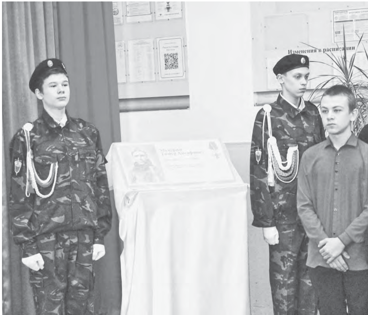
Первое время памятная доска будет располагаться в музее лицея № 2.