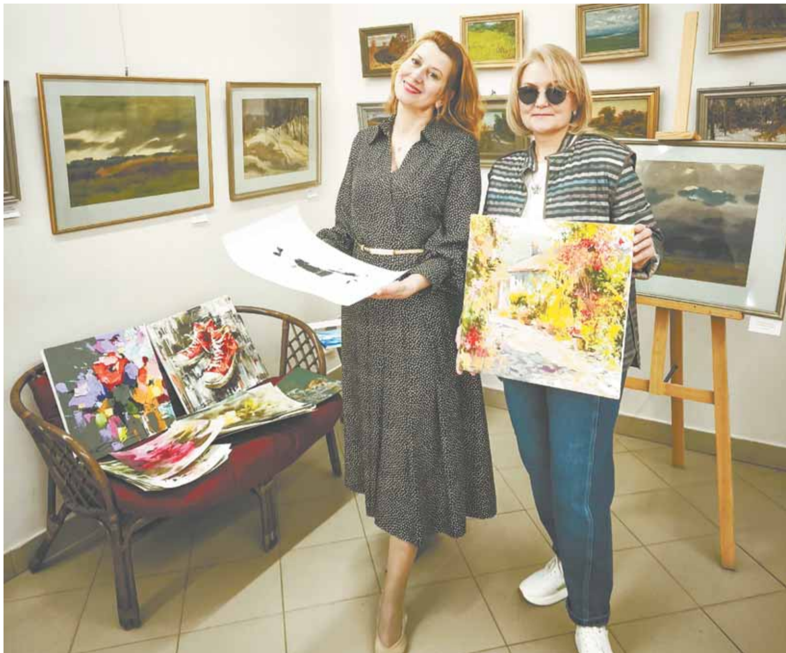
Благотворительный вернисаж стал не только возможностью приобрести картины по приятной цене, но и яркой выставкой.

Проект отличается от обычных гаражных распродаж еще и особой атмосферой. Мало того, что продажа проходит в стенах, заряженных искусством, так и еще каждый покупатель оказывается под влиянием волонтеров, которые