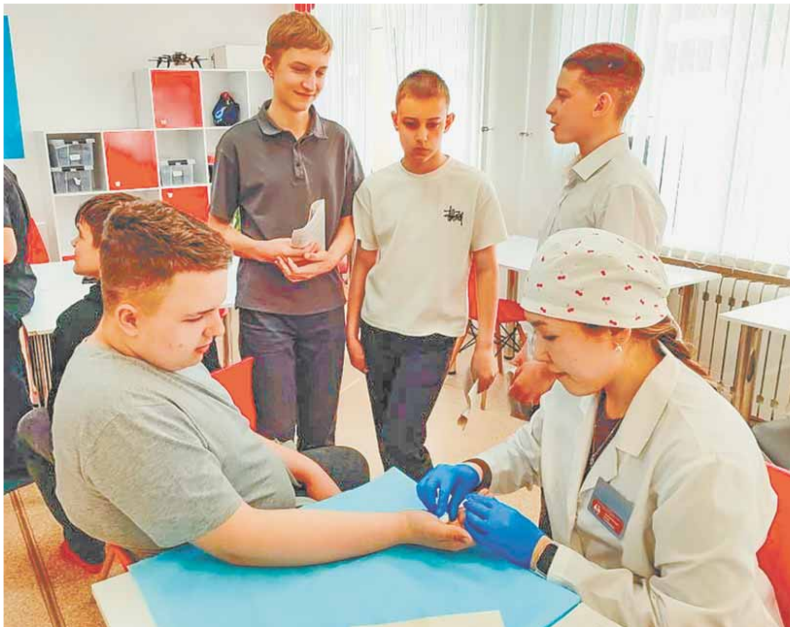
Одна из главных целей проекта – обучить детей заботиться о своем здоровье.

В диагностическом перечне процедур, которые проходят школьники, определяются важные показатели здоровья.