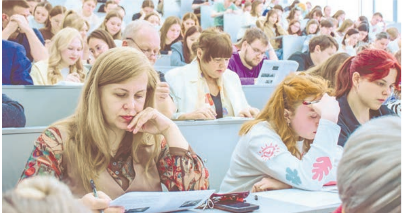
В диктант вошло 25 вопросов, на их решение дается 45 минут.