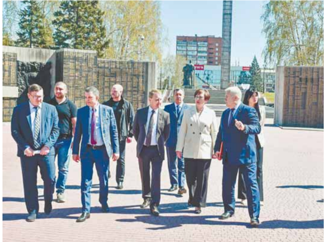
К Дню Победы будут приведены в порядок все памятные места города.

В преддверии Дня Победы на территории Мемориала ведутся работы по благоу-