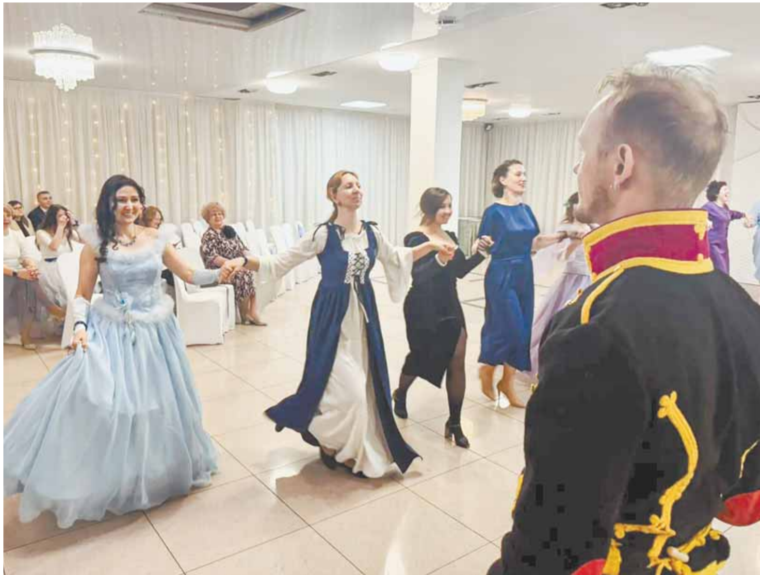
Среди прочих педагоги выучили «Готический танец» – контрданс середины XIX века.

Гости погрузились в атмосферу старинного бала с элементами эпохи горнозаводского Барнаула: звучала живая музыка, проходили исторические танцы, велось светское общение в кругу единомышленников. Организаторы собрали 80 гостей – представителей педагогического и наставнического сообщества региона. Среди участников были педагоги и наставники-просветители, участники СВО, советники