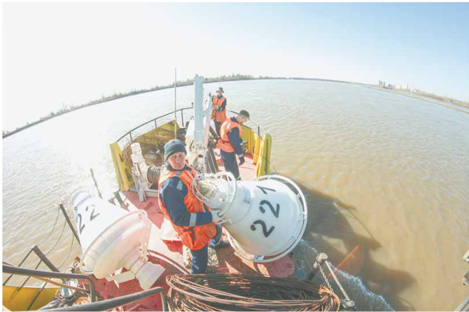
Навигация по Оби начинается с выставления водных ориентиров для судов.

Напомним: несколько лет назад было заключено соглашение между правительством региона, Росморречфлотом, администрацией Обь-Иртышского бассейна водных путей, а также предприятиями речной и добывающей отрасли. В 2025 году в рамках соглашения на развитие речной инфраструктуры направили 150,5 млн руб., из которых 52 млн руб. – из краевой казны, 98,5 млн руб. – федеральные средства.