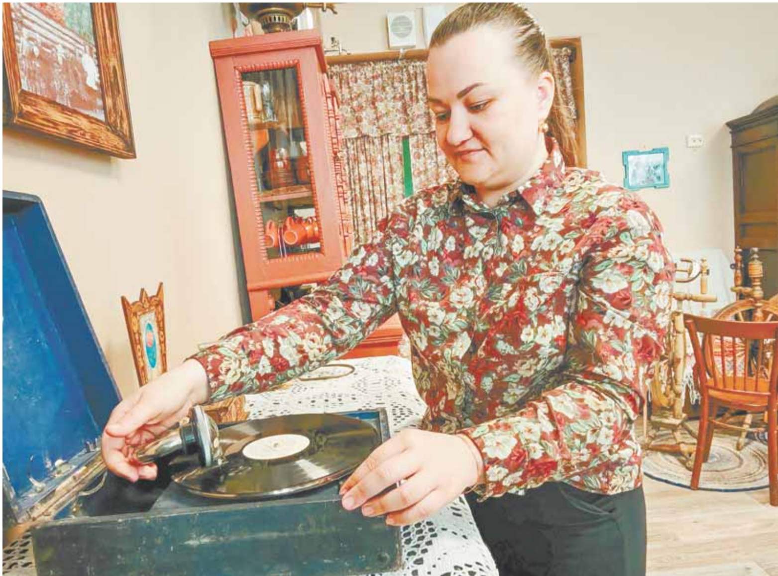
В музее ДШИ «Традиция» с особым трепетом относятся к каждому экспонату.