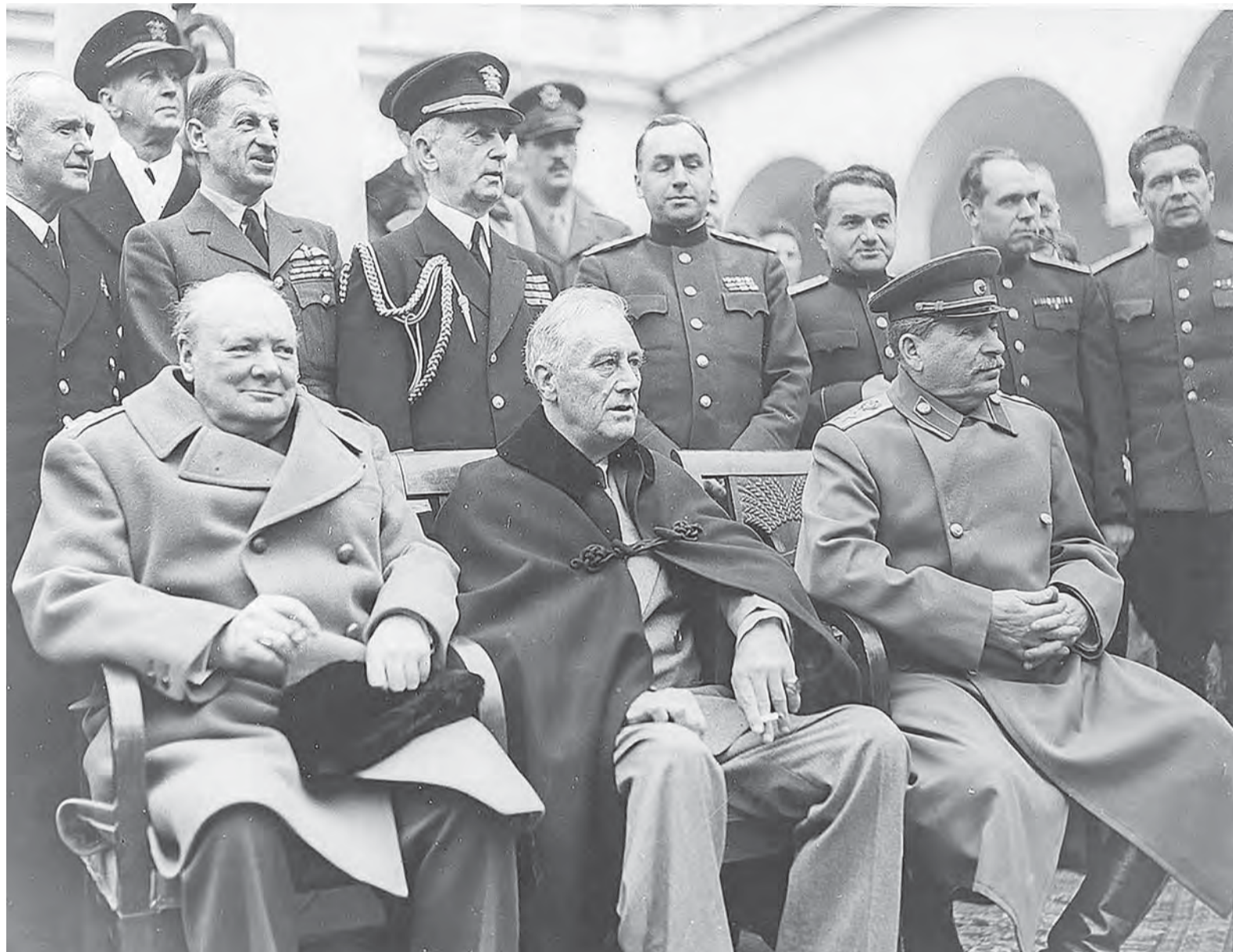
Ялтинскую конференцию в секретных переписках называли кодовым словом «Аргонавт».

17 июля – 2 августа 1945 – Берлинская (Потсдамская) конференция.