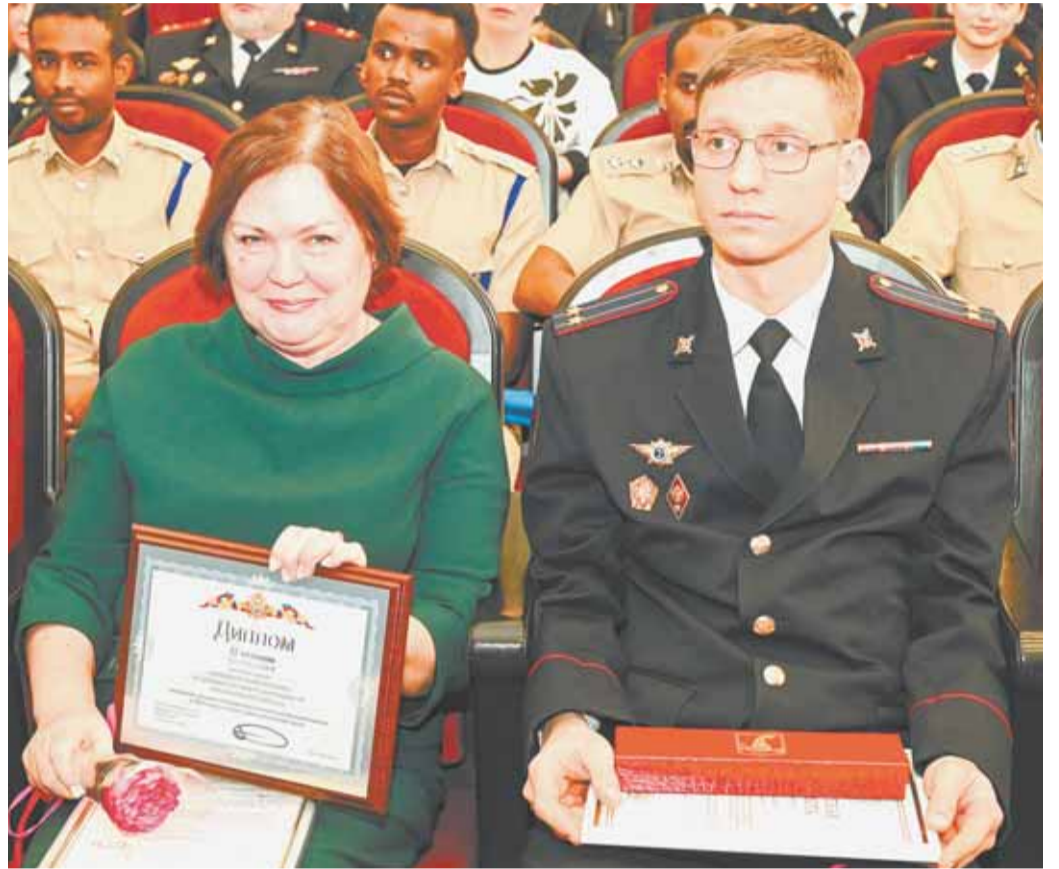
В День науки в каждом вузе отметили своих выдающихся ученых.

Сотрудникам и молодым ученым института вручили