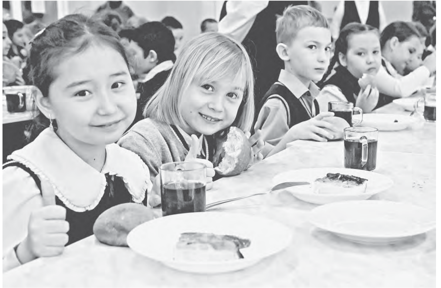
Дети идут на завтрак с удовольствием.