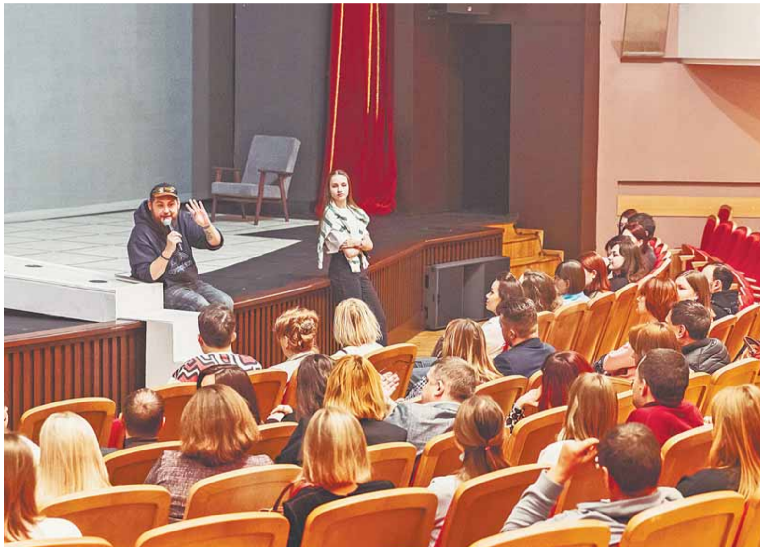
Помимо работы над спектаклями главреж театра регулярно проводит встречи со зрителями.

– Роман Дмитрия Данилова попал мне в руки