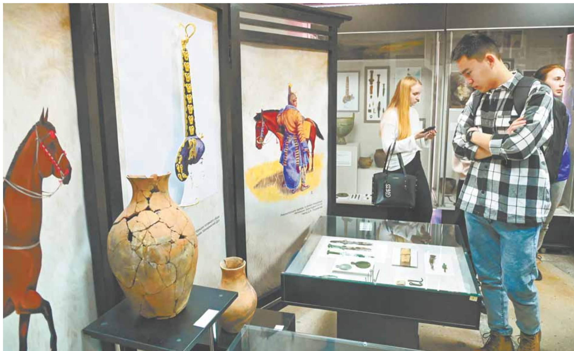
Школьники и студенты познакомились с коллекциями вузовских музеев и связанными с ними исследованиями.