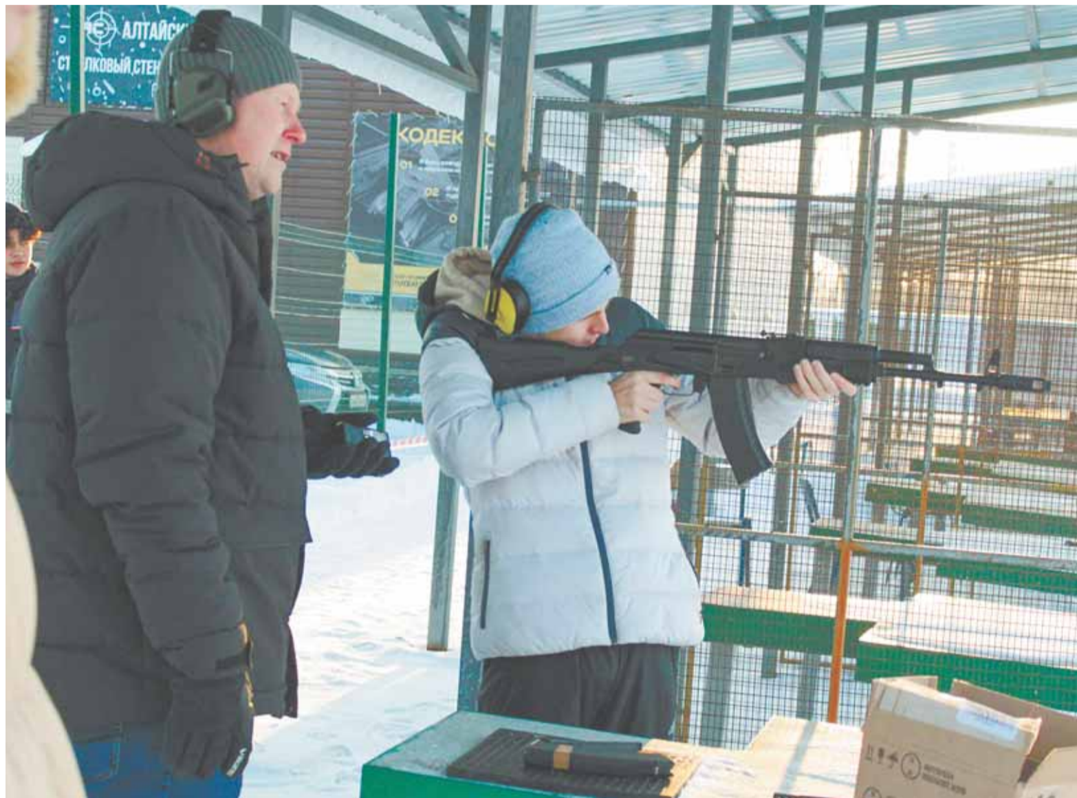
На огневом рубеже школьников сопровождали опытные инструкторы.

Клуб «Алтайский стрелок» существует с 2004 года и явля-