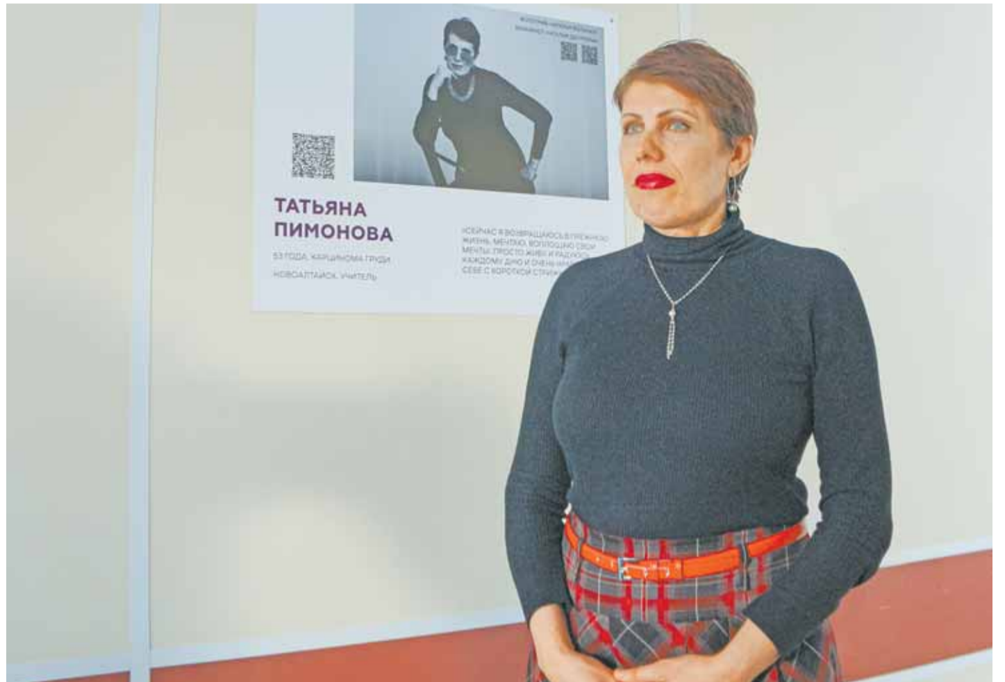
Участие в фотопроекте помогает его участникам поверить в себя и поддержать тех, кто только столкнулся с недугом.

В рамках мероприятия прошла презентация фотовыставки всероссийского проекта по поддержке людей с онкологическими заболеваниями «Химия была, но мы расстались». Подобные проекты состоялись уже в 20 городах России. В Барнауле поддержать всех, кто находится на пути лечения онкологии, решились 15 героев. Их фотоистории разместили в одном из корпусов Алтайского краевого онкологического диспансера.