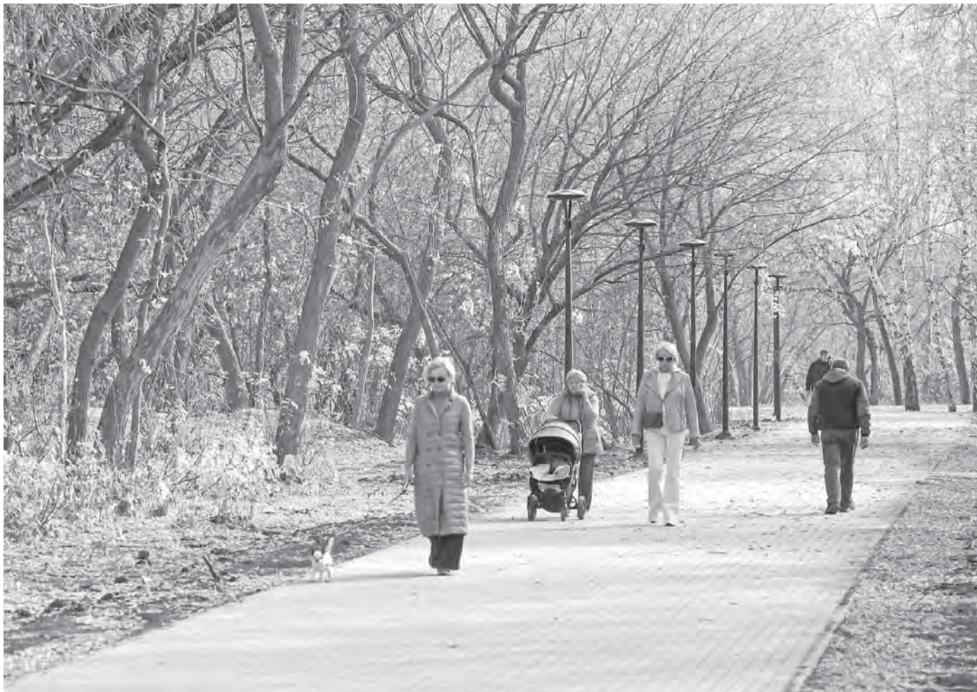
Территория бывшего парка им. В.И. Ленина значительно преобразилась уже на первом этапе благоустройства.