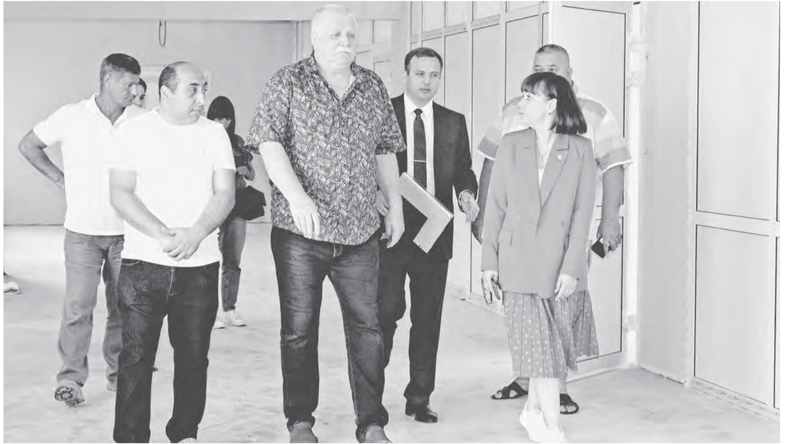
На ремонт Барнаульского кадетского корпуса направлено 56 млн руб. Ход работ здесь находится на постоянном контроле.

По решению администрации города на благоустройство прилегающей территории Барнаульского кадетского корпуса из муниципального бюджета дополнительно выделено 6 млн руб. На эти средства заменят бордюры и асфальтовое покрытие, уберут поросль. Работы ведутся уже сейчас.