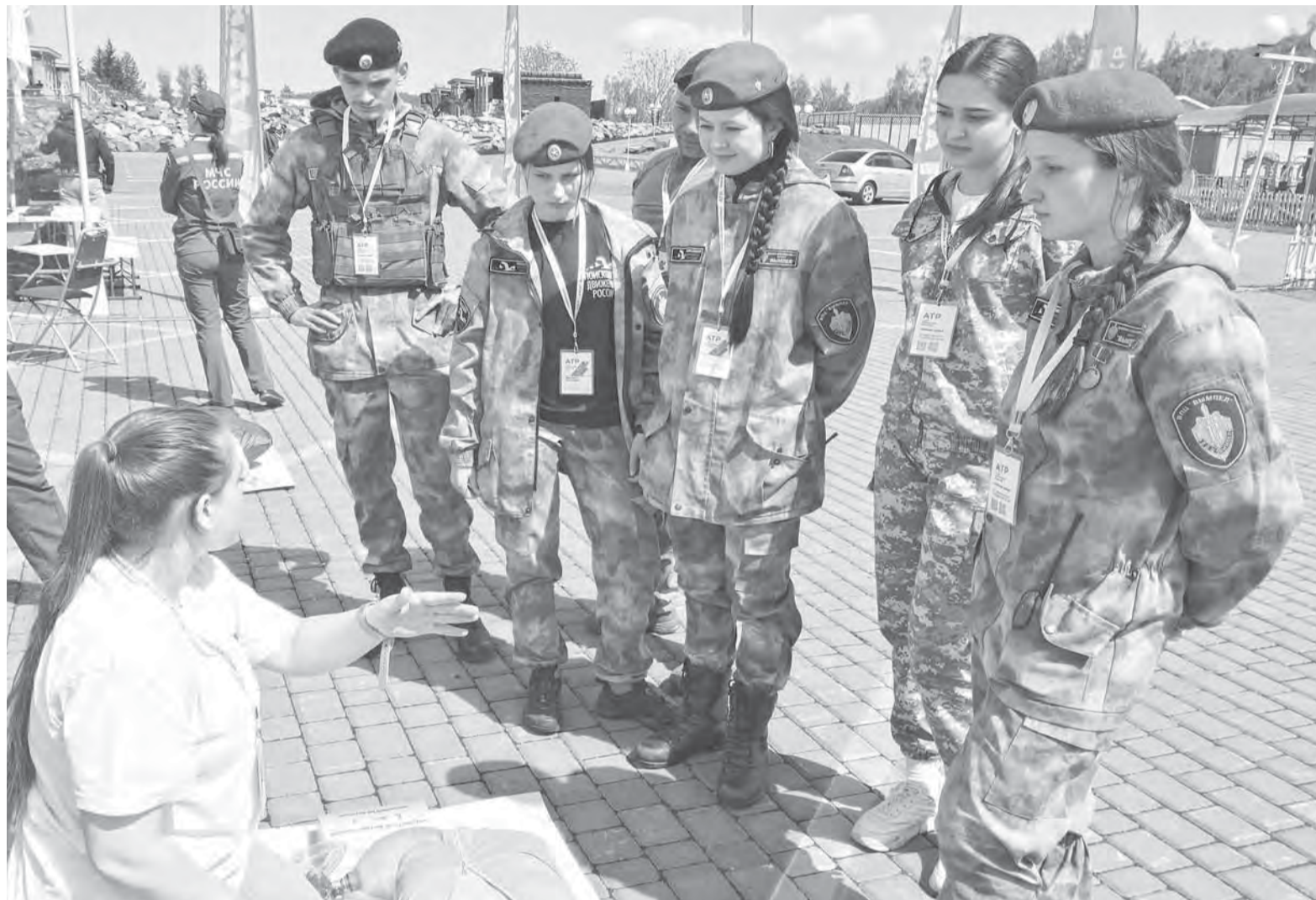
Волонтеры проекта «Научись спасать жизнь» проводят мастер-класс для участников форума АТР.