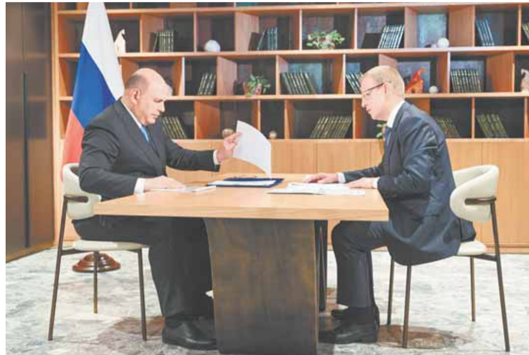
В рамках рабочей встречи Михаил Мишустин обсудил с главой региона социально-экономическое развитие края.