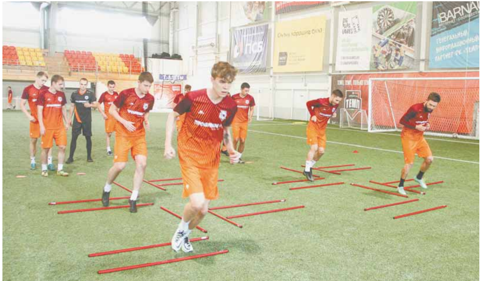
Накануне напряженной недели «Темп» особое внимание уделяет физической подготовке.

В Кубке Сибири нынче стартовали пять команд – две с берегов Байкала, две из Кемеровской области и барнаульский «Темп». Байкальцы составили первую полуфинальную пару, а для оставшейся тройки организовали групповой турнир в Междуреченске, победитель которого проходил в финал. «Темп» обыграл «Новокузнецк» 1:0, сыграл вничью с «Распадской» 1:1, после чего оказалось, что у барнаульцев и междуреченцев абсолютно равные показатели. Дальнейшую судьбу матча определял жребий. Счастливую для темповцев сторону