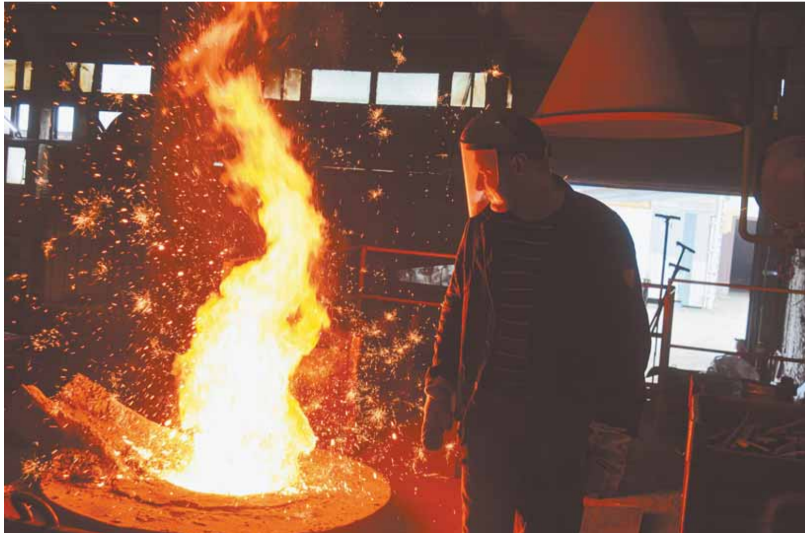
В литейном цехе всегда жарко.