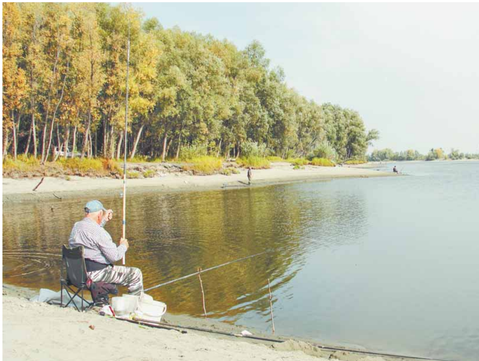
На рыбалке главное не результат, а сам процесс.

Можно и в Затон уехать, на реке Талой, а это протока