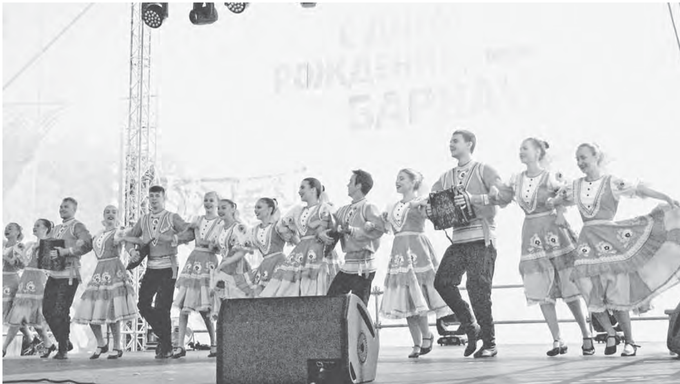
Традиционно на праздничных площадках выступают лучшие творческие коллективы краевой столицы.