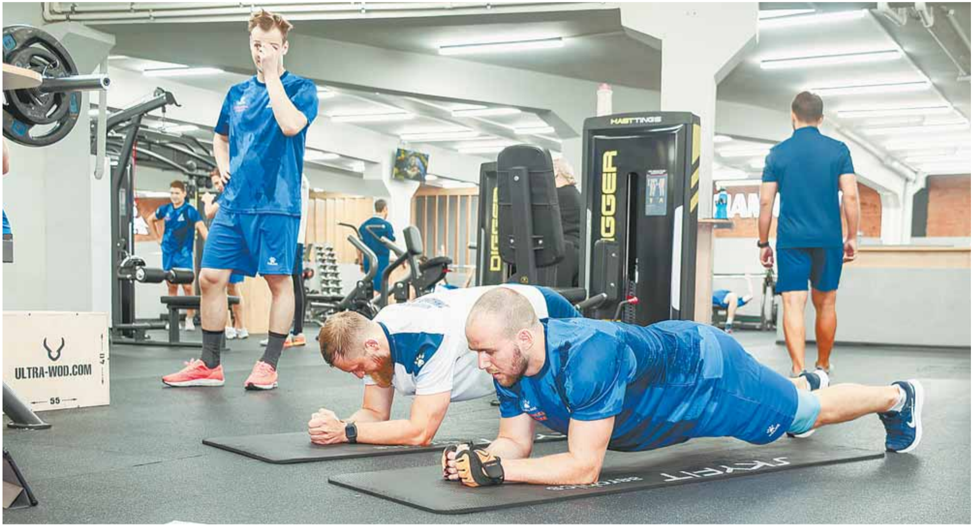
Игроки ХК «Динамо-Алтай» готовы к серьезной работе.

Барнаульские хоккеисты начали подготовку к сезону