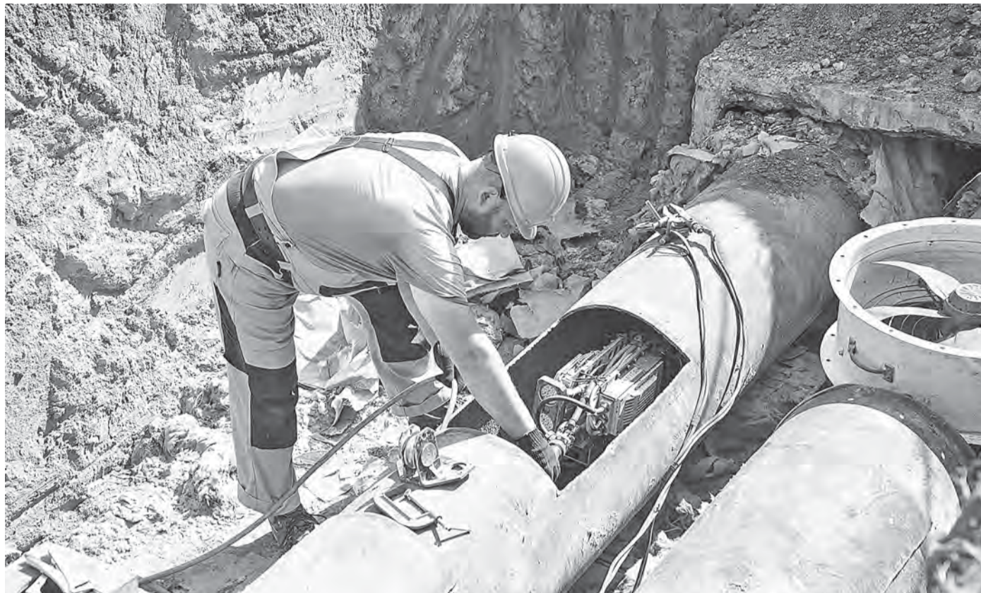
Робот-сканер весит около 100 кг, работает он не быстро, но надежно.