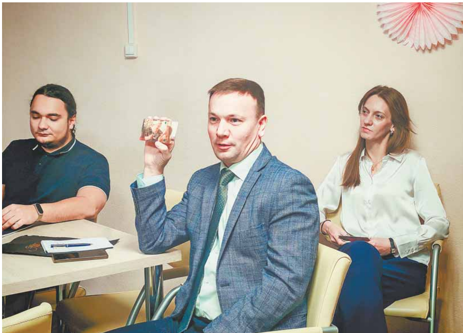
Метафорические карты помогли каждому участнику взглянуть на себя и натолкнуть на новые размышления.