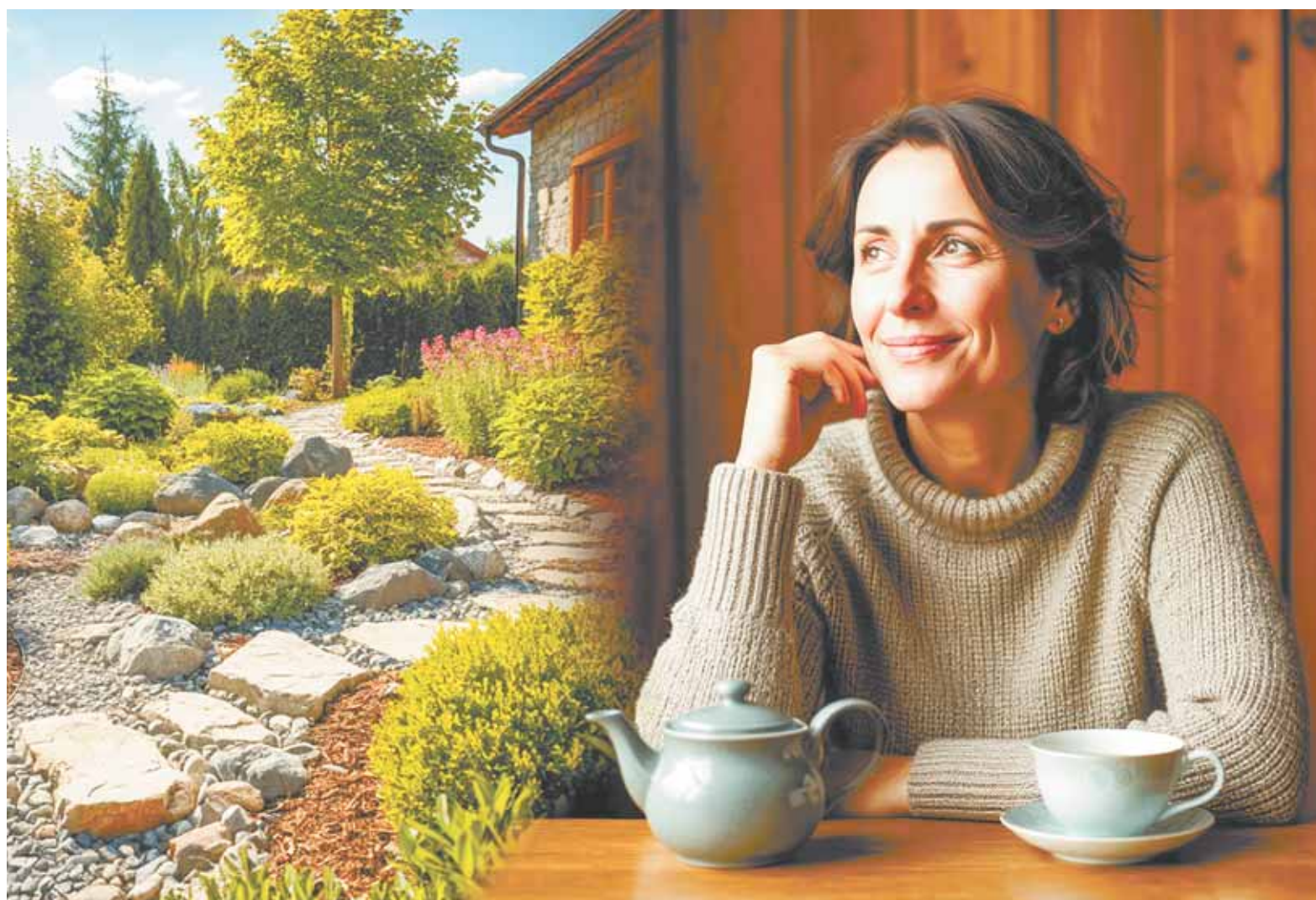
Коллаж Александра ЕРМОЛОВА

Для каменистой горки подойдут такие растения, как ясколка, очиток, молодило, флоксы, тимьян, камнеломка, обриета; луковичные — крокусы, тюльпаны, пролески; злаки — овсяница, ячмень гривастый. Можно высадить и хвойные культуры — низкорослые можжевельники, туи и декоративные кустарники, такие как барбарис и кизильник.