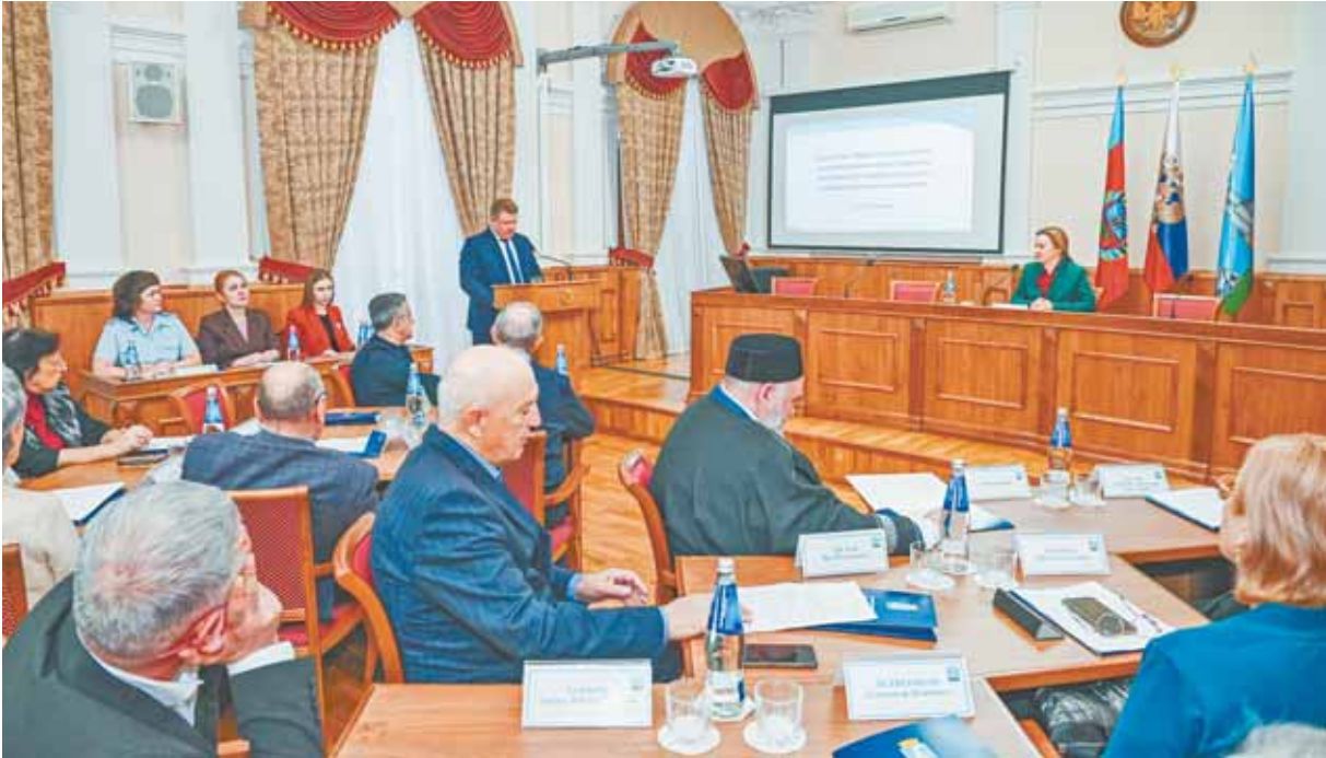
Каждый выступающий подробно рассказал об итогах своей деятельности, направленной на укрепление межнациональных отношений.

Также на заседании особое внимание уделили порядку сдачи экзаменов по русскому языку, истории и законодательству России. К слову, с начала года представители отдела миграции г. Барнаула проверили законность нахождения