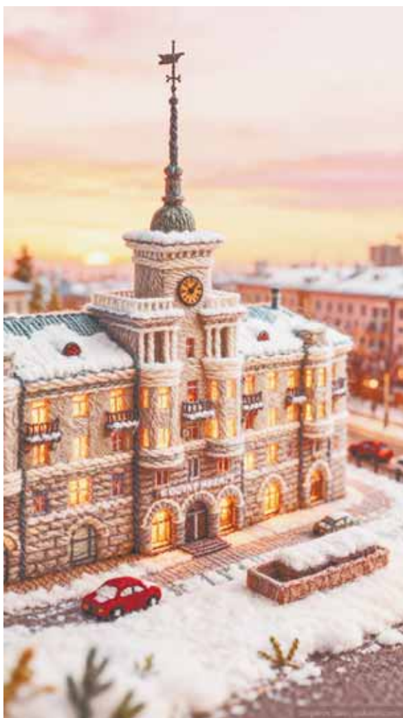
Виды города из пряжи уже сегодня можно увидеть в соцсетях.