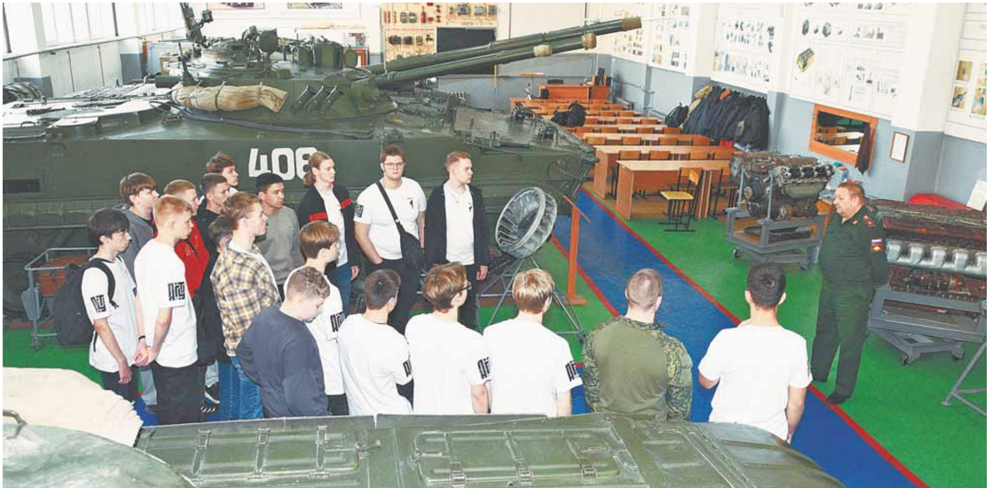
Студентов колледжей впечатлила экскурсия в военно-учебный центр АлтГТУ.

Школьники и студенты колледжей приняли участие в инженерной школе АлтГТУ