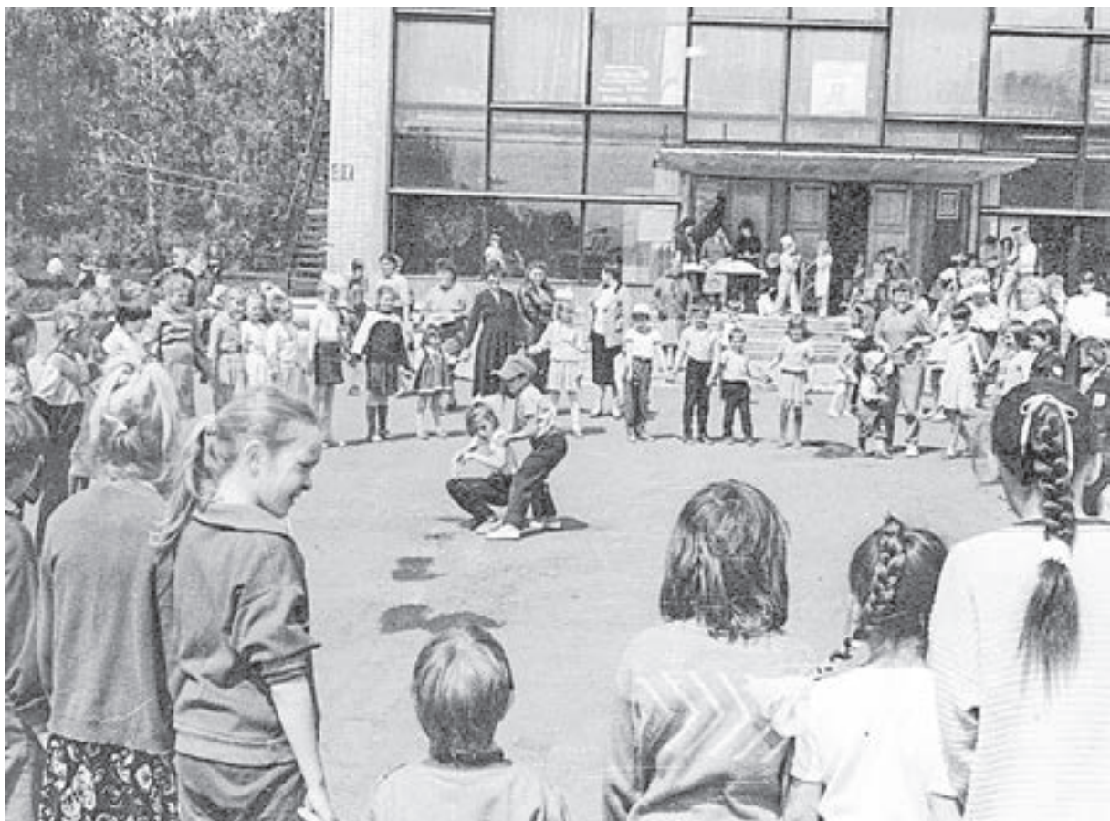
Дом культуры с момента открытия стал центром притяжения для жителей поселка всех возрастов.