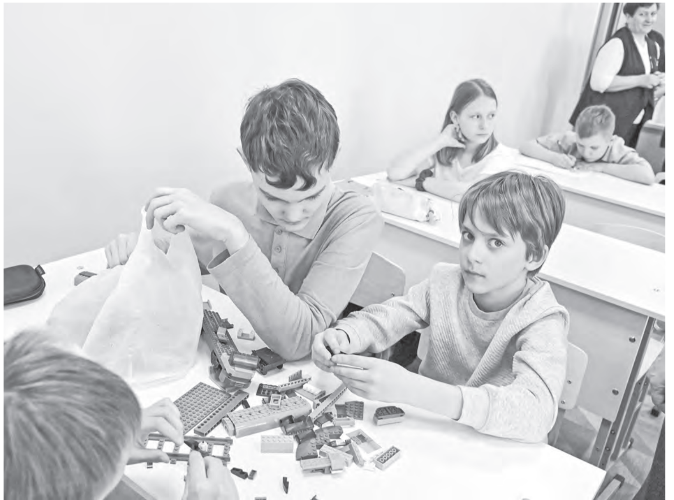
В лицее проводят для школьников увлекательные занятия.