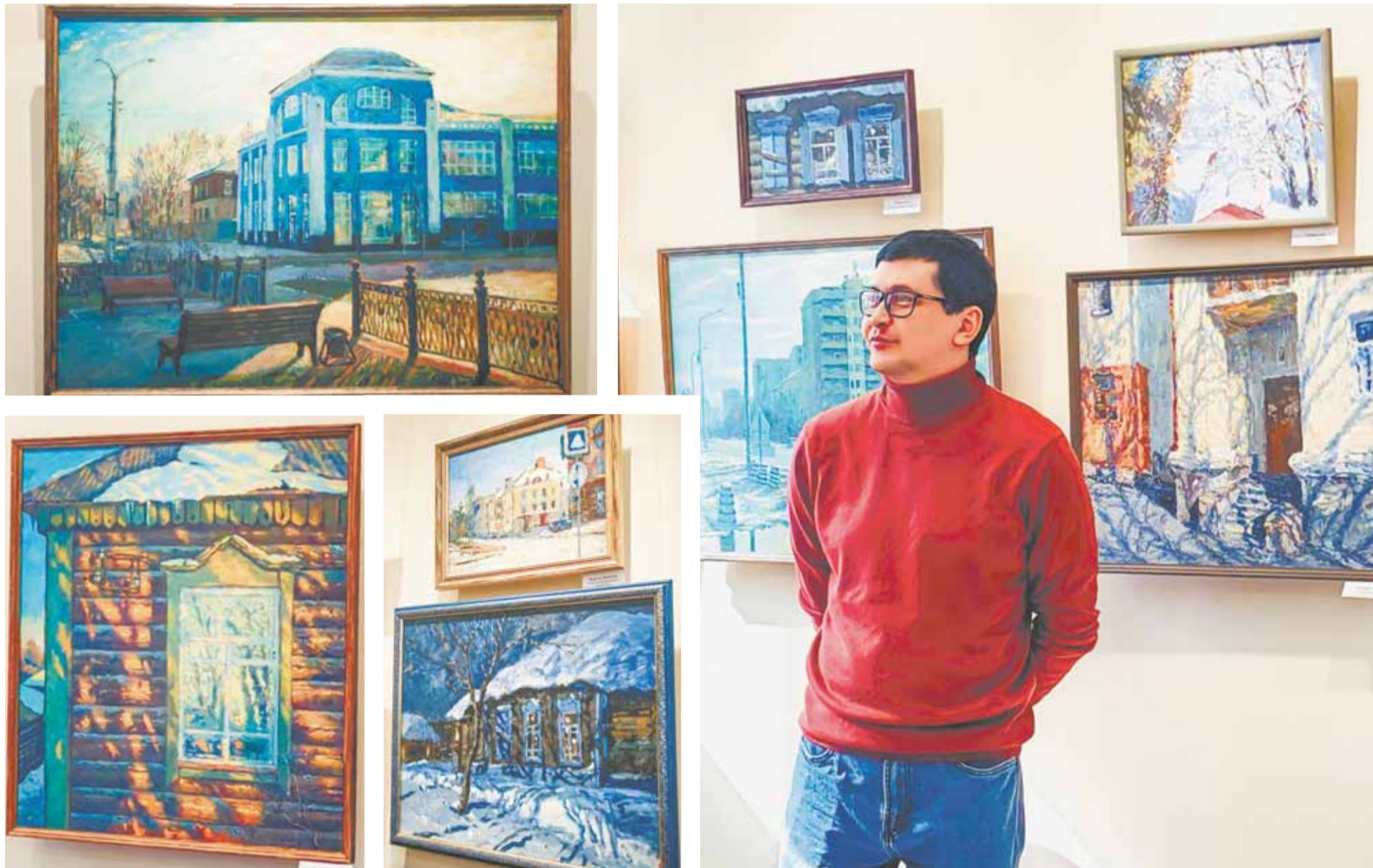
На выставке представлены преимущественно городские пейзажи.