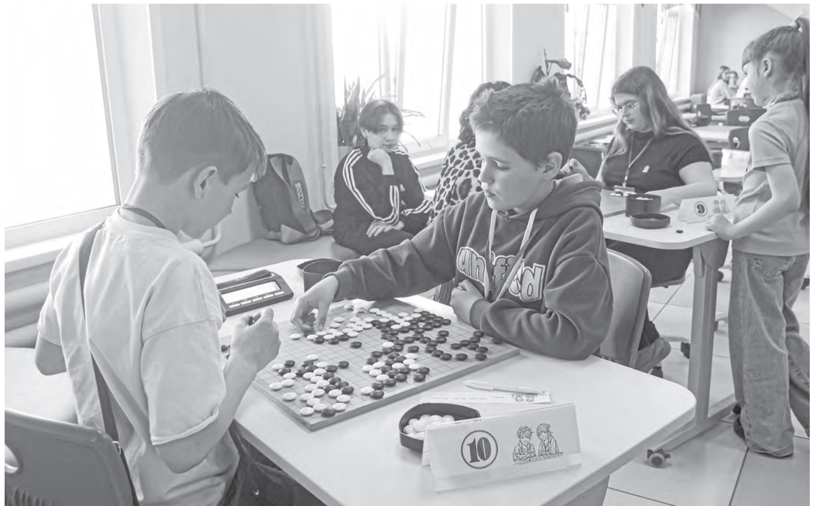
Го развивает у игроков стратегическое мышление.

Но с шахматами на самом деле здесь мало общего. Внеш-