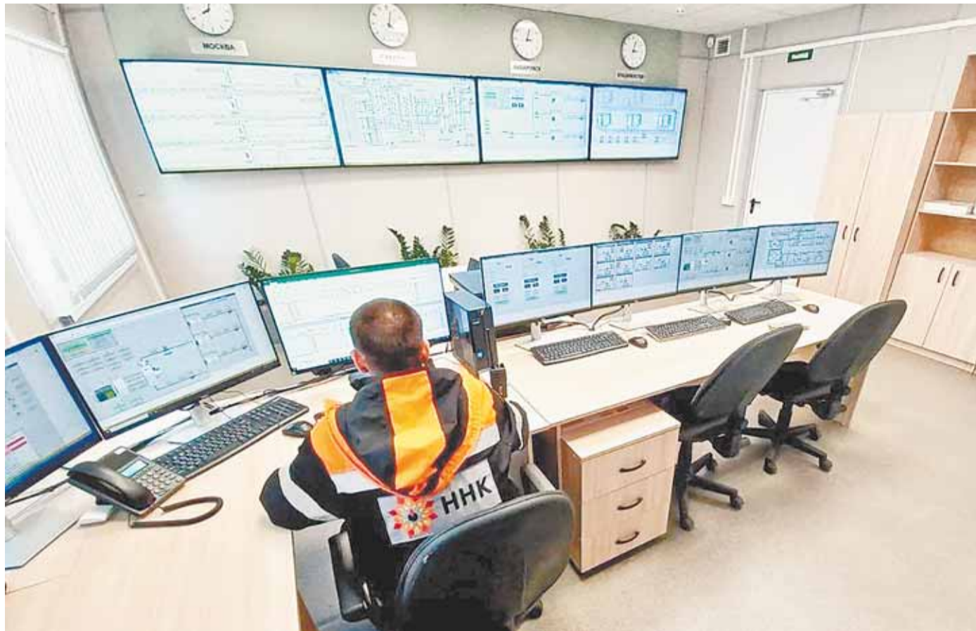
Нефтеперерабатывающий комплекс на Сахалине успешно работает при участии барнаульских программистов.