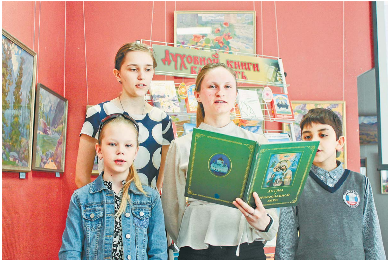
Укращением конкурса стали воспитанники воскресной школы Никольского храма.