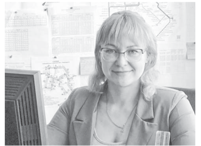
Представители династии Компанец отвечают за безопасность движения ГЭТ.