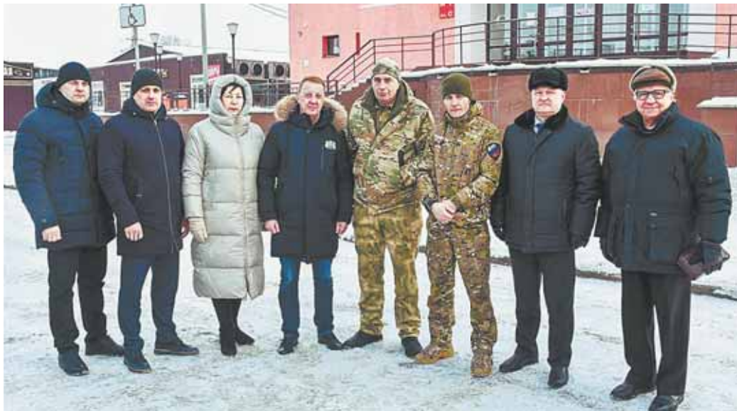
Гуманитарный груз из Барнаула в зону СВО отправили в 23-й раз.