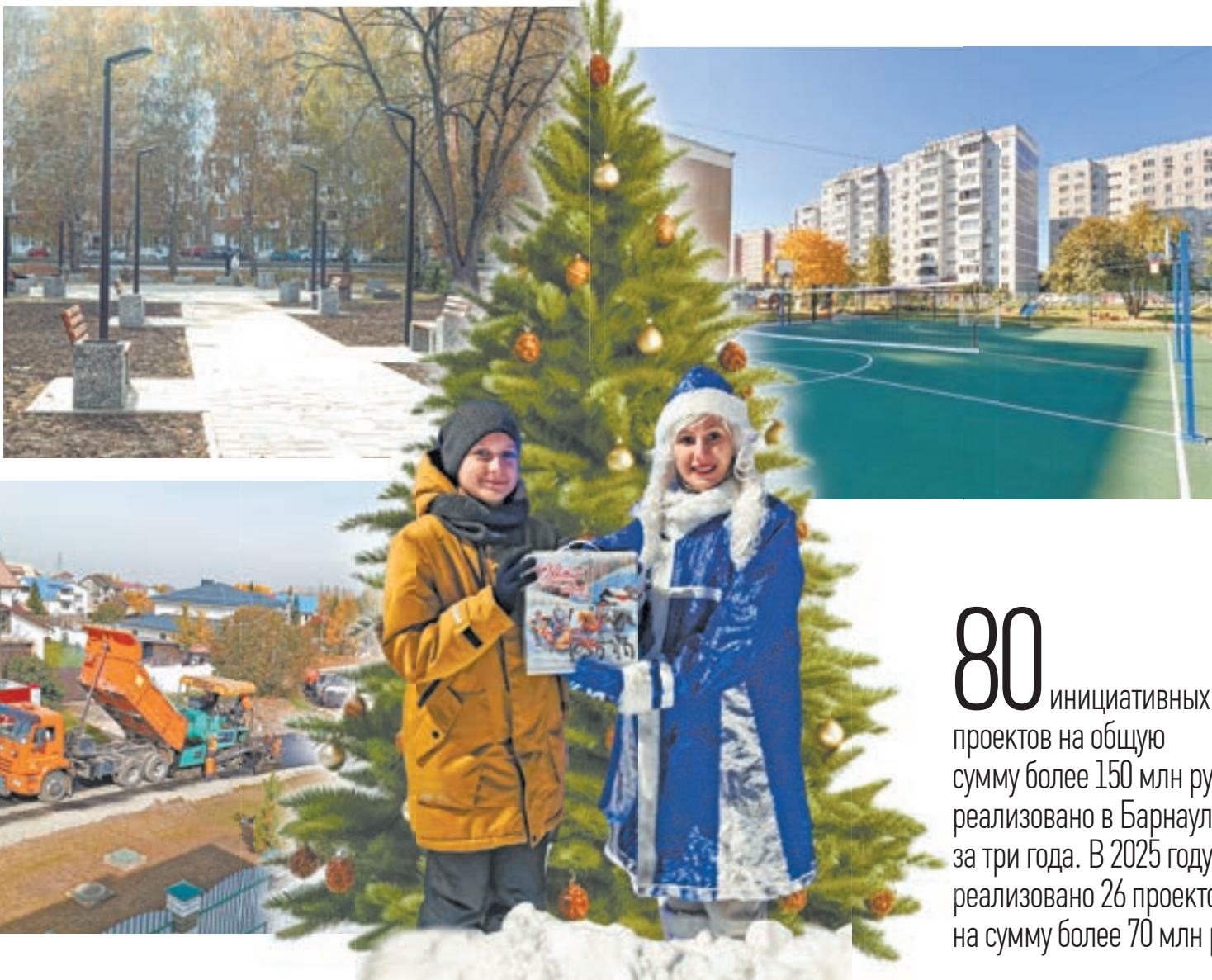
Общественники не только поздравляют горожан с праздниками и проводят различные мероприятия, но и благодаря инициативам населения вносят достойный вклад в преображение родного города.