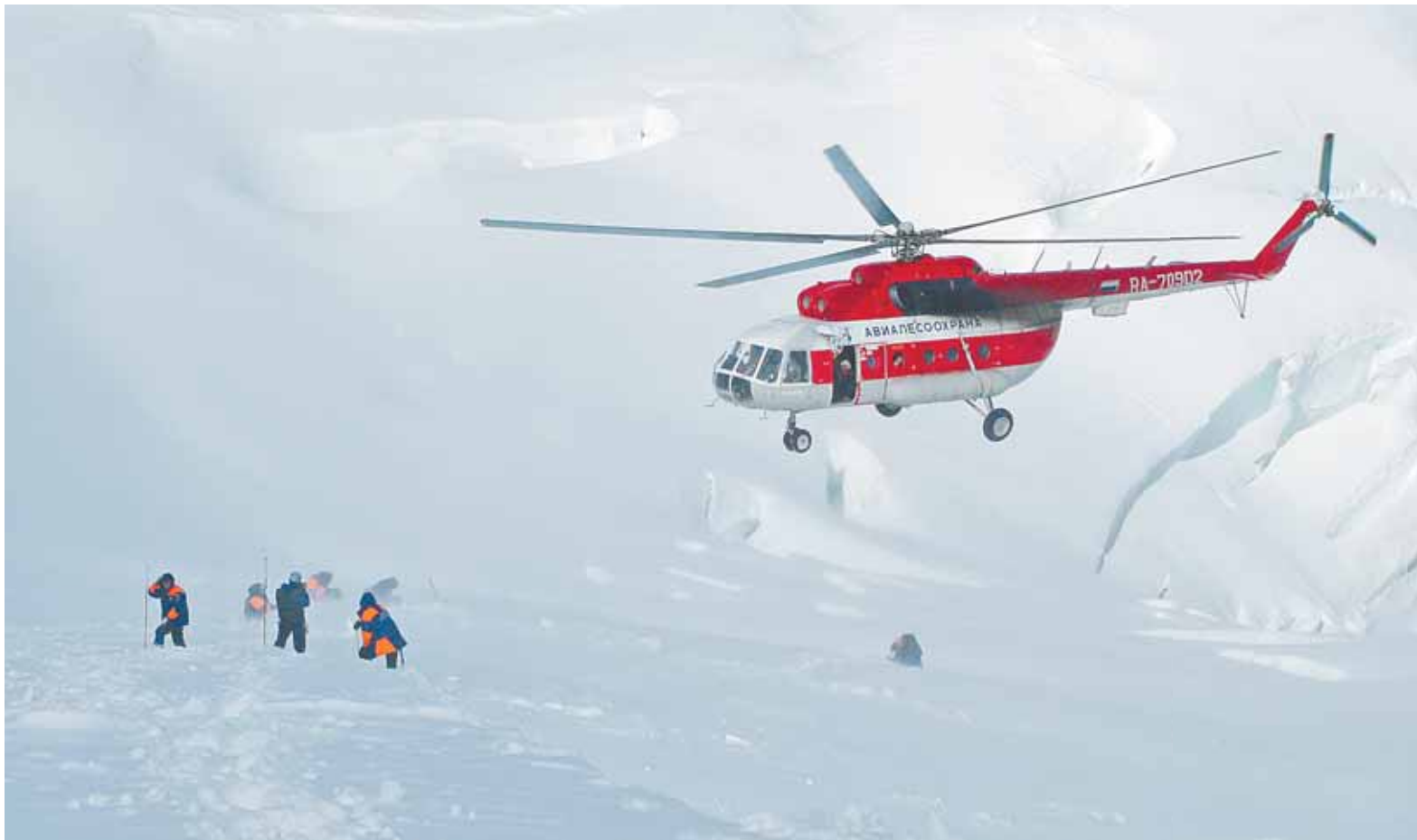
Барнаульские спасатели готовы работать в любых, даже самых сложных условиях.