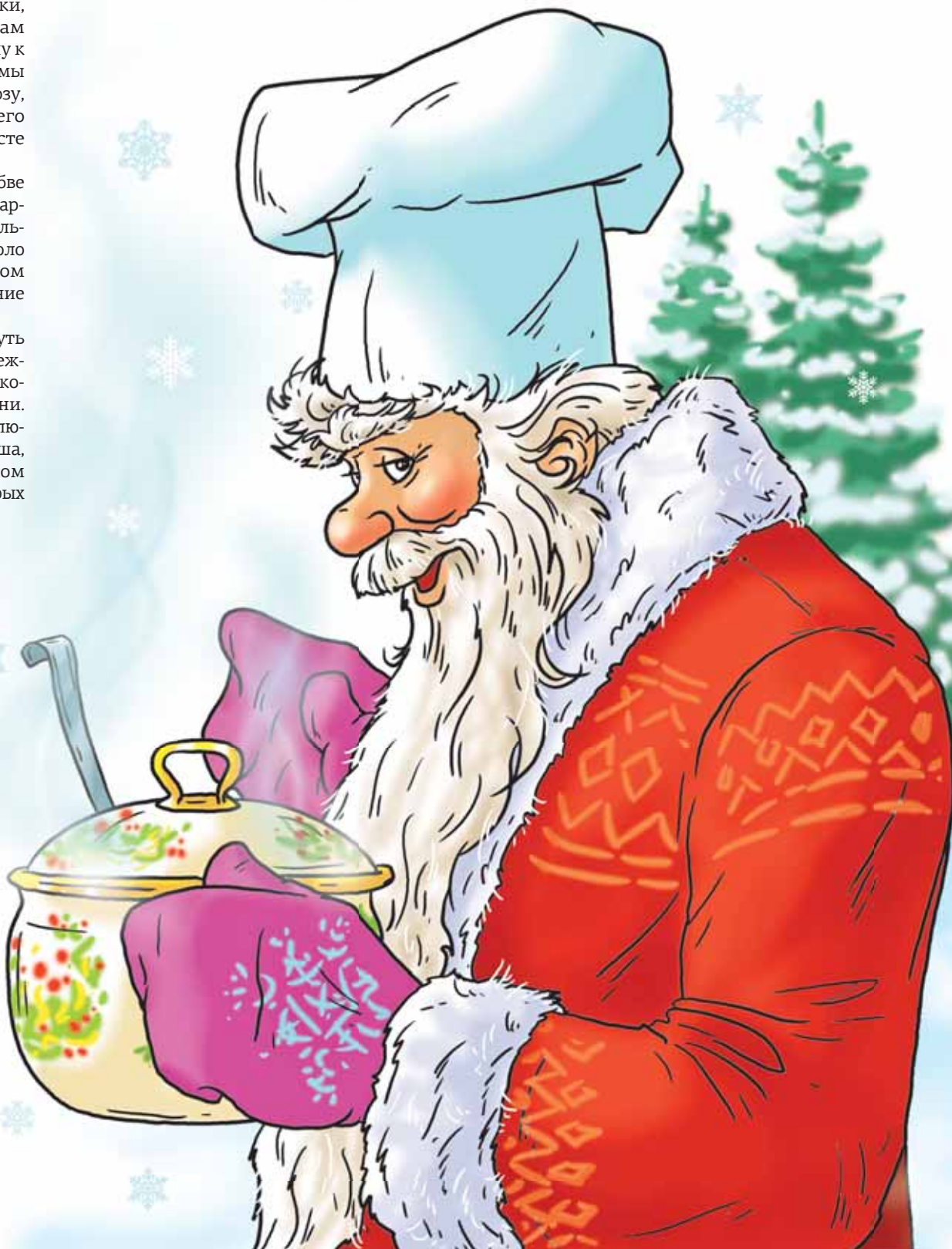
Рисунок Александра ЕРМОПОВИЧА

У армян перед Новым годом принято печь бездрожжевой обрядовый пирог тареац (в переводе «хлеб года»), который украшают орешками и сухофруктами как символами изобилия. В пирог кладется фасолинка либо монетка, и кому достанется кусочек с ней, тому весь год будет сопутствовать удача. Всей семьей гадают и на фигурных печенках с изюмом, каждое из которых символизирует членов семьи или пожелания для них. Если во время выпечки тесто поднялось, год для прототипа фигурки будет благоприятным.