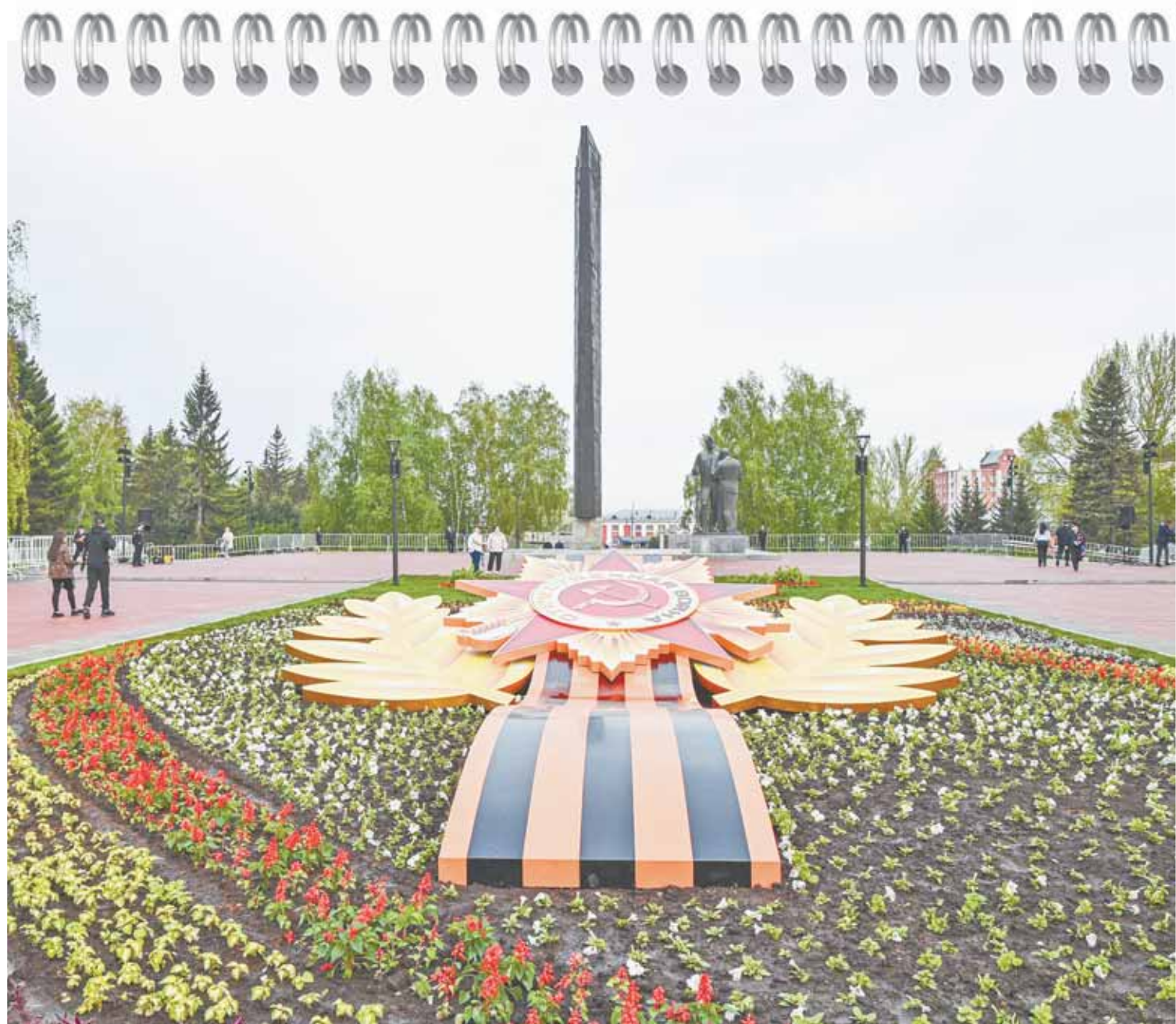
Барнаул в калейдоскопе событий: от празднования 80-летия Победы до установки памятника Достоевскому.