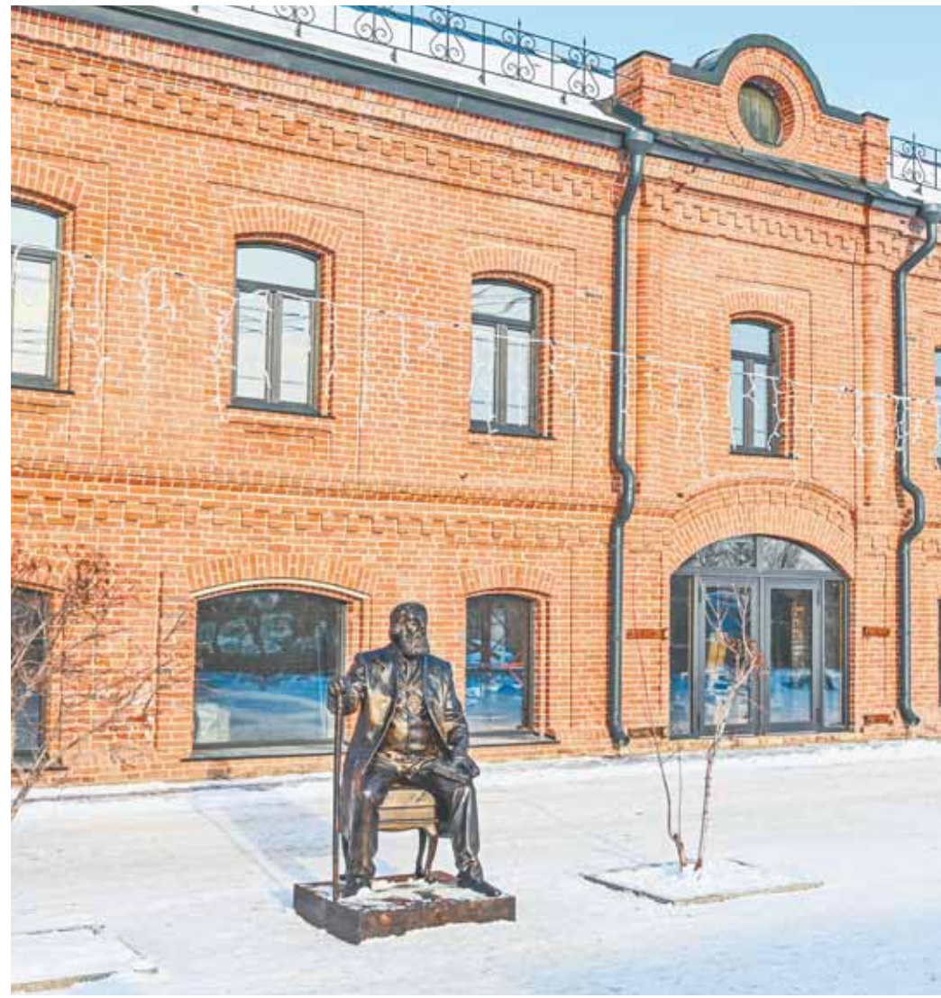
Отреставрированный купеческий особняк украсил туристическую часть города.

В 1998 году старинный особняк серьезно пострадал от пожара. Но какое-то время в здании, расположенном в центре базарной жизни, еще велась торговля. Затем исторический памятник стоял в запустении, время постепенно разрушало то, что не успел уничтожить огонь, пока в 2020 году на него не обратил внимание Евгений Лишин. Ему удалось практически невозможное – повернуть время