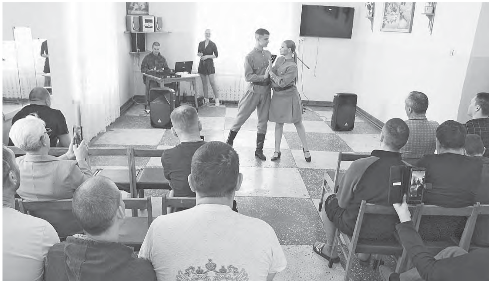
Барнаульские студенты подняли бойцам настроение трогательными музыкальными номерами.

– Поскольку я являюсь еще и постановщиком танцев, мы выбрали с ребятами народную тематику, – рассказала преподаватель техникума Альбина