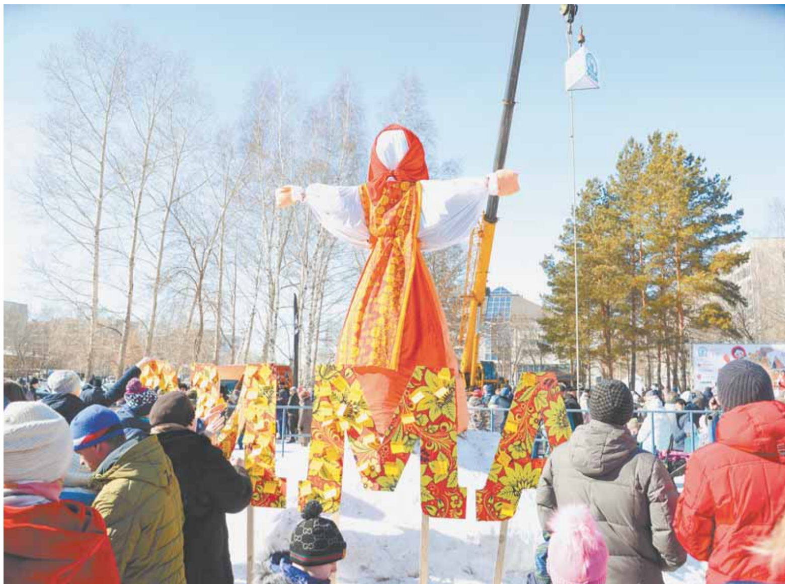
Сжигание чучела Масленицы символизирует избавление от старого и освобождение места для нового.