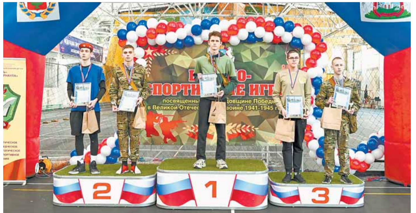
В манеже наградили ребят, отличившихся на предыдущих этапах военно-спортивных игр.