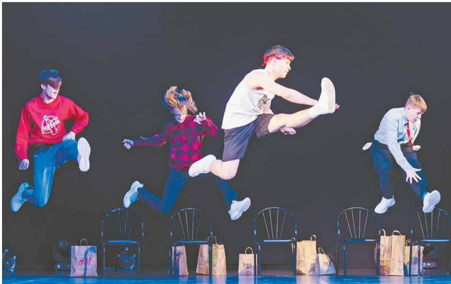
Воспитанники «Меридиана» мастерски исполняют разные виды современных уличных танцев.

Барнаулский коллектив современного танца покоряет региональные и международные площадки